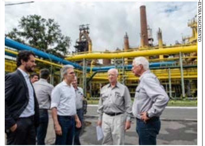
Retomada do Alto-Forno 3 da Usiminas é marcada com presença de Lideranças Políticas