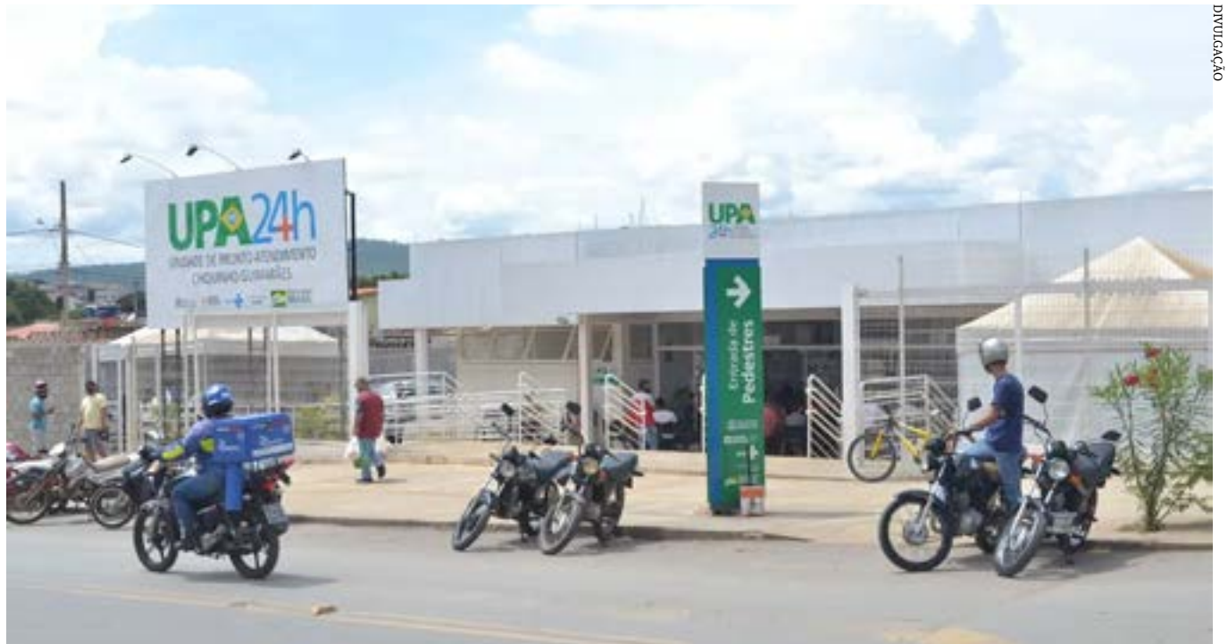
A UPA do Chiquinho Guimarães

O presente Decreto regulamenta, no âmbito do sistema municipal de saúde, o disposto no artigo 19-J, da Lei Federal nº 8.080, de 19 de setembro de 1990, Lei Orgânica da Saúde, com redação dada pela Lei Federal nº 14.737, de 27 de novembro de 2023, para estabelecer rotinas da administração pública municipal. O direito consignado nas disposições da Lei Federal nº 14.737, de 27 de novembro de 2023 será igualmente assegurado à mulher trans. A Secretaria Municipal de Saúde deverá ultimar todas as providências necessárias para que em consultas, exames e procedimentos realizados em unidades de saúde públicas ou privadas, em Montes Claros, toda mulher tenha o direito de ser acompanhada por pessoa maior de idade, durante todo o período do atendimento, independentemente de notificação prévia.