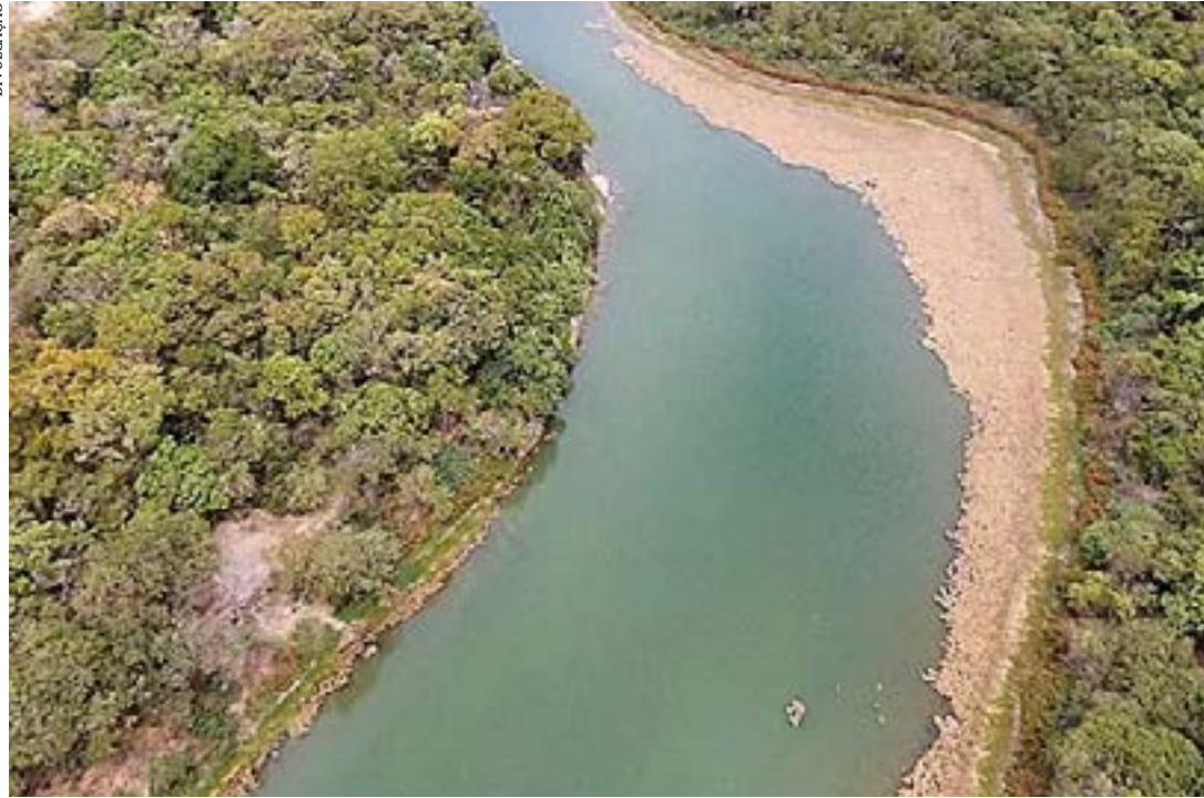
O rio Verde Grande