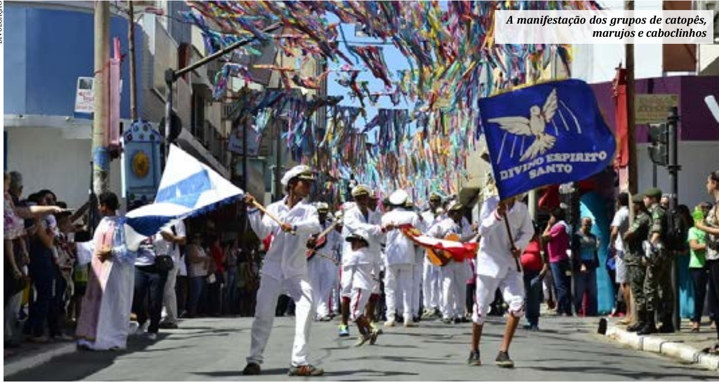
A manifestação dos grupos de catopês, marujos e caboclinhos