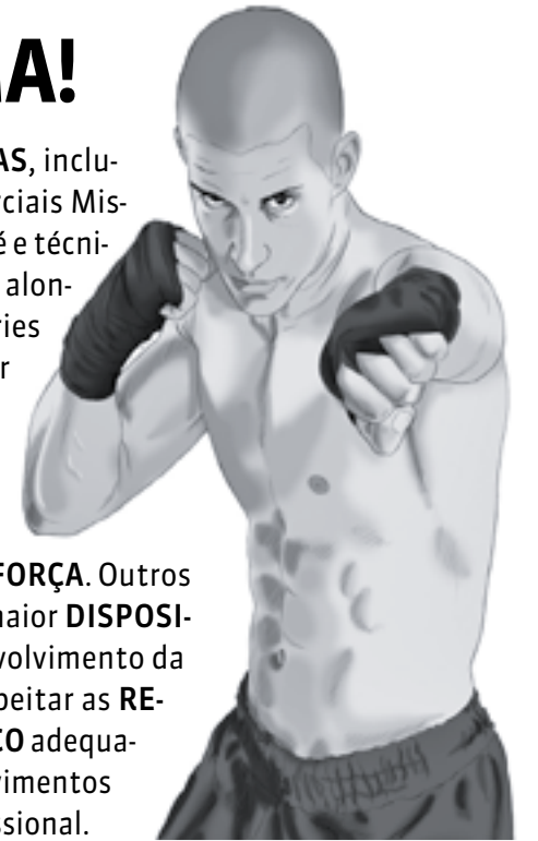
ILUSTRAÇÃO: RAFAEL MONTEIRO

Cada vez mais praticado nas ACADEMIAS , inclusive por MULHERES , o MMA (Artes Marciais Mistas) envolve GOLPES de COMBATE em pé e técnicas de LUTAS no CHÃO . As aulas incluem alongamento e AQUECIMENTO , além de séries para SOCAR , chutar, agarrar, correr, pular corda e levantar peso. O esporte ajuda no EMAGRECIMENTO , defesa pessoal, definição MUSCULAR e condicionamento físico, pois combina exercícios cardiorrespiratórios, FLEXIBILIDADE e FORÇA . Outros benefícios são sensação de bem-estar, maior DISPOSIÇÃO , melhora da AUTOESTIMA e desenvolvimento da disciplina. Para isso, é fundamental respeitar as REGRAS do esporte, realizar o preparo FÍSICO adequado, ter o conhecimento TÉCNICO dos movimentos e seguir todas as ORIENTAÇÕES do profissional.