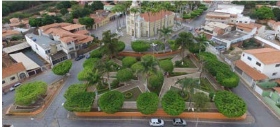
O projeto funciona na região oeste da cidade

viadas, a equipe técnica da Defesa Civil Nacional avalia as metas e os valores solicitados. Com a aprovação, é publicada portaria no DOU com o valor ser liberado. Desde 22 de dezembro o governo federal prometeu ajudar os municípios afetados pela seca e passados 33 dias nada foi liberado ainda.