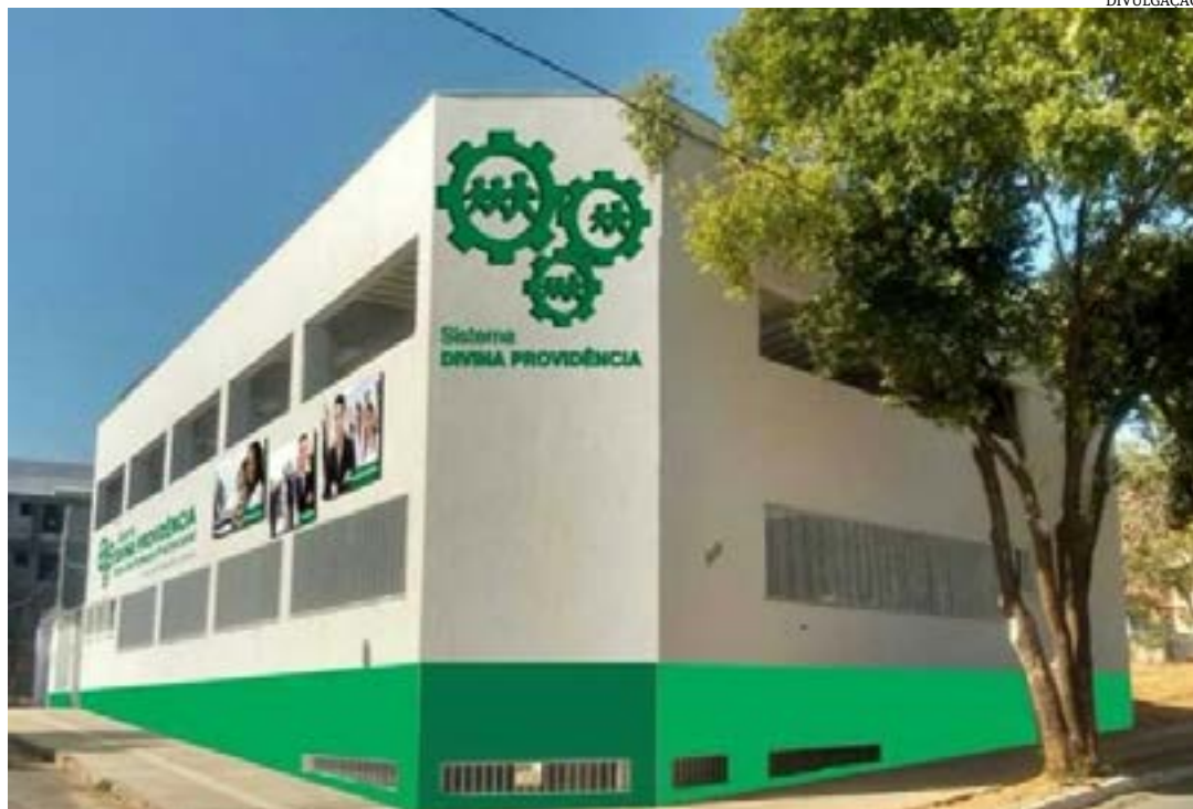
O projeto funciona na região oeste da cidade

no processo de resgate da dignidade humana.