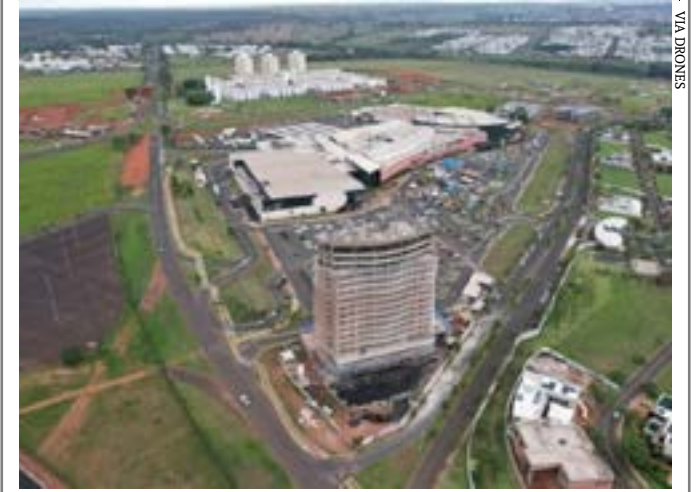
Expansão urbana e infraestrutura são apontados como os principais atrativos para o segmento em Uberlândia