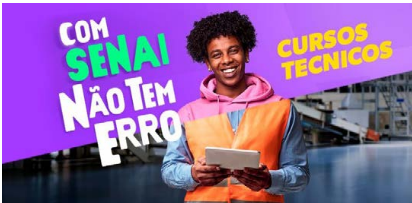
Inscrições vão até o dia 25 de fevereiro e a primeira mensalidade custa R$ 79,90 para todos os cursos

INSCRIÇÕES - As inscrições para os cursos técnicos do SENAI MG podem ser feitas por meio do preenchimento de um formulário de pré-matricula no site da FIEMG. Em seguida, o interessado deve realizar o pagamento do boleto e comparecer à unidade do SENAI escolhida até o dia 29/2 com os documentos exigidos para concluir a matrícula.