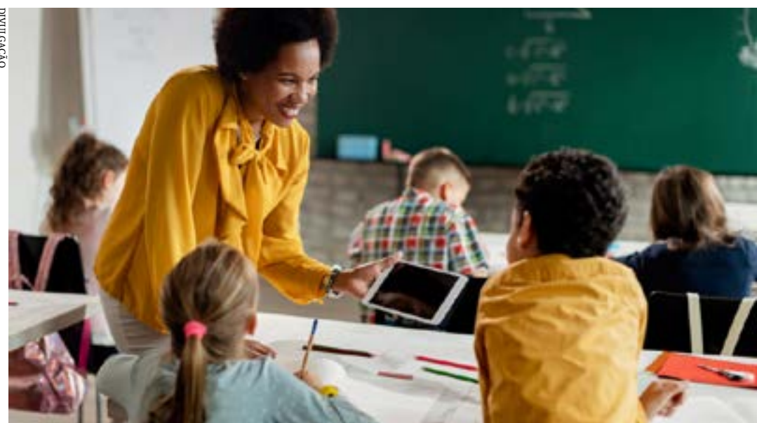
Em sua segunda edição, disputa prevê etapas estaduais e regionais no formato on-line. Vencedores serão conhecidos em março