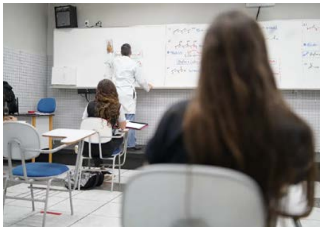
Resultado final deve ser divulgado em 30 de janeiro

O SisU reúne as vagas ofertadas por instituições públicas de ensino superior de todo o Brasil, e possibilita o ingresso no ensino superior por meio da nota do Exame Nacional do Ensino Médio (Enem). Para a edição de 2024, o SisU ofertou 264 mil vagas, em 6.827 cursos de graduação, de 127 instituições públicas de educação superior. (FABÍOLA SINIMBU/Agência Brasil)