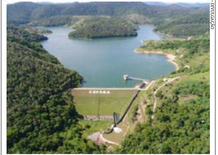
Obras iniciadas neste mês vão garantir a redução dos vazamentos e a melhoria do serviço com o reforço de novas redes de distribuição de água