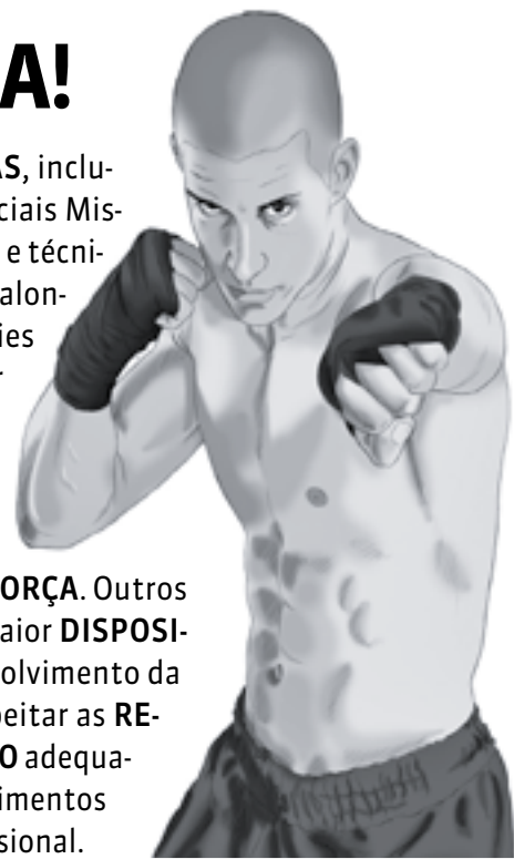
ILUSTRAÇÃO: RAFAEL MONTEIRO

Cada vez mais praticado nas ACADEMIAS , inclusive por MULHERES , o MMA (Artes Marciais Mistas) envolve GOLPES de COMBATE em pé e técnicas de LUTAS no CHÃO . As aulas incluem alongamento e AQUECIMENTO , além de séries para SOCAR , chutar, agarrar, correr, pular corda e levantar peso. O esporte ajuda no EMAGRECIMENTO , defesa pessoal, definição MUSCULAR e condicionamento físico, pois combina exercícios cardiorrespiratórios, FLEXIBILIDADE e FORÇA . Outros benefícios são sensação de bem-estar, maior DISPOSIÇÃO , melhora da AUTOESTIMA e desenvolvimento da disciplina. Para isso, é fundamental respeitar as REGRAS do esporte, realizar o preparo FÍSICO adequado, ter o conhecimento TÉCNICO dos movimentos e seguir todas as ORIENTAÇÕES do profissional.