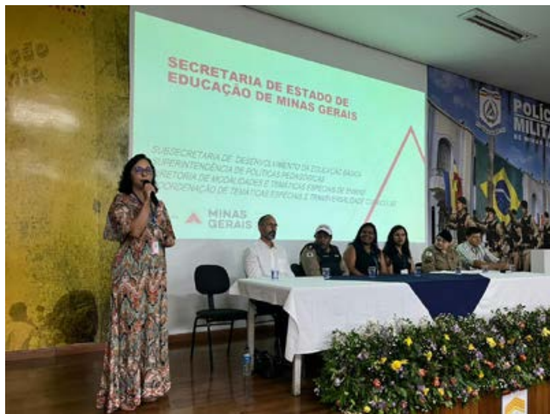
Seminário organizado pela PMMG envolveu diversos atores da comunidade escolar para discutir ações preventivas