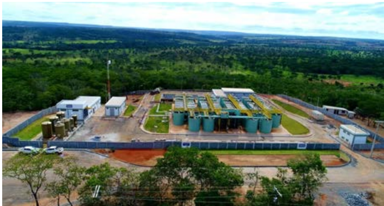
A ETA de Montes Claros

O aumento na conta em Montes Claros somente pode ocorrer se a Agência Reguladora Municipal autorizar, o que não ocorreu nos dois últimos aumentos. O promotor propôs que os consumidores de Montes Claros deixem de pagar as contas a partir de janeiro, caso seja cobrado o aumento indevido. Em seu despacho, o juiz alega que se acatar todo pedido do Ministério Público causará grande tumulto processual e tem de aguardar o trânsito em julgado. A estatal alega que não consegue descontar nas contas o aumento de 8,69% concedido em 2017, por causa do efeito cascata.