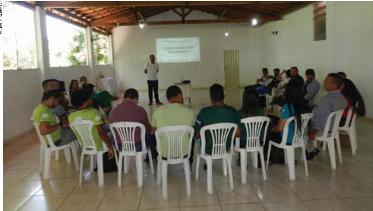
Municípios participam de reunião para discutir estratégias

Próximo de completar um ano de seu lançamento oficial, o projeto "Cordilheira do Espinhaço" ganhou projeção nacional como destino turístico. O projeto abrange atualmente oito municípios: Bocaiuva, Botumirim, Cristália, Grão Mogol, Itacambira, Montes Claros, Olhos D'água e Turmalina.