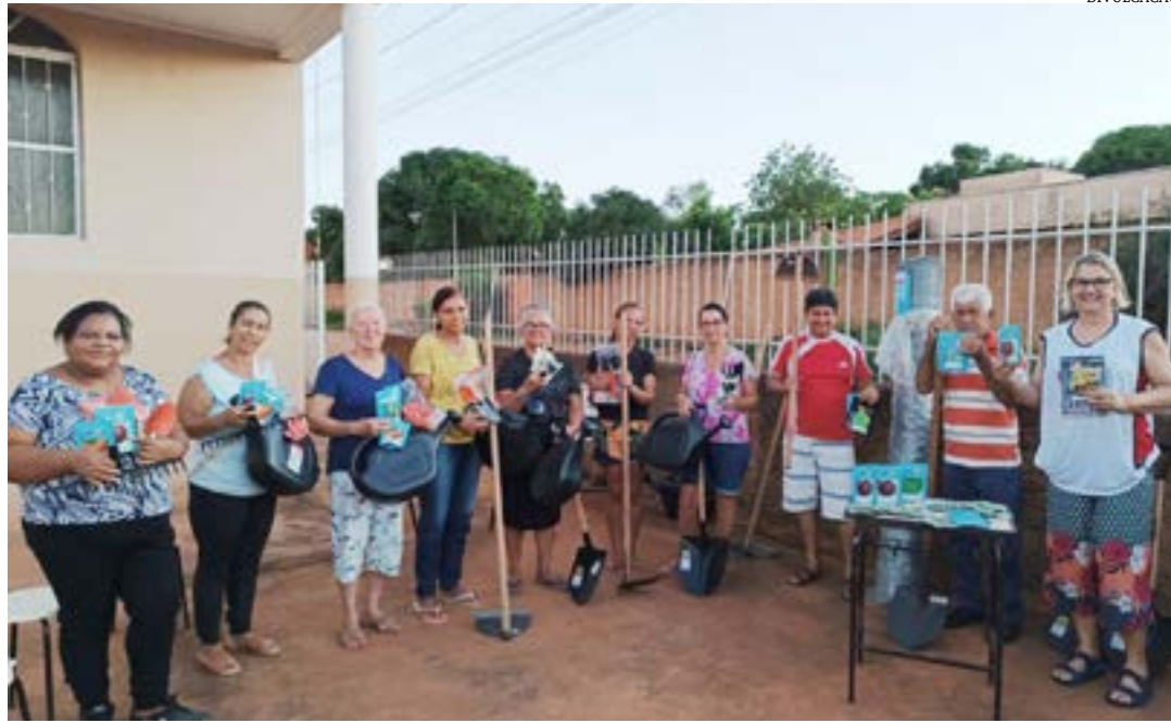
A ação desenvolvida pelas integrantes