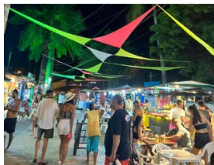
ARRAIAL D' AJUDA continua em clima de festa neste verão mas amanhã voltarei para minha super querida Montes Claros