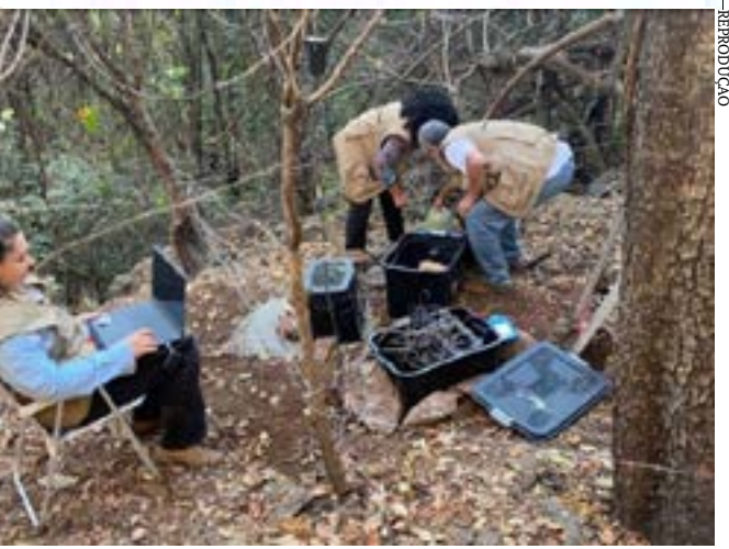
Pesquisadores do Centro Sismológico da UnB instalam os aparelhos em Sete Lagoas

União Sindical MG - www.unionsindicalmg.com.br