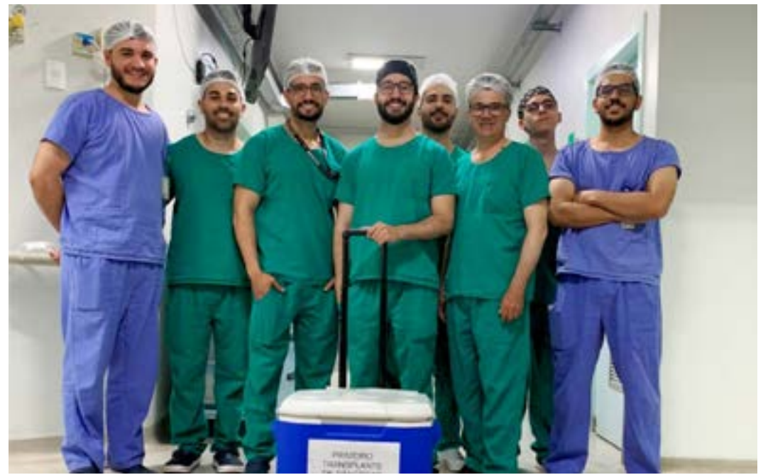
A equipe que realizou o procedimento cirúrgico

A Santa Casa Montes Claros tem se destacado ao longo dos anos como pioneira e referência no cenário de transplantes, registrando importantes marcos na história da medicina na região. O mais recente grande feito foi a realização do primeiro transplante de pâncreas.