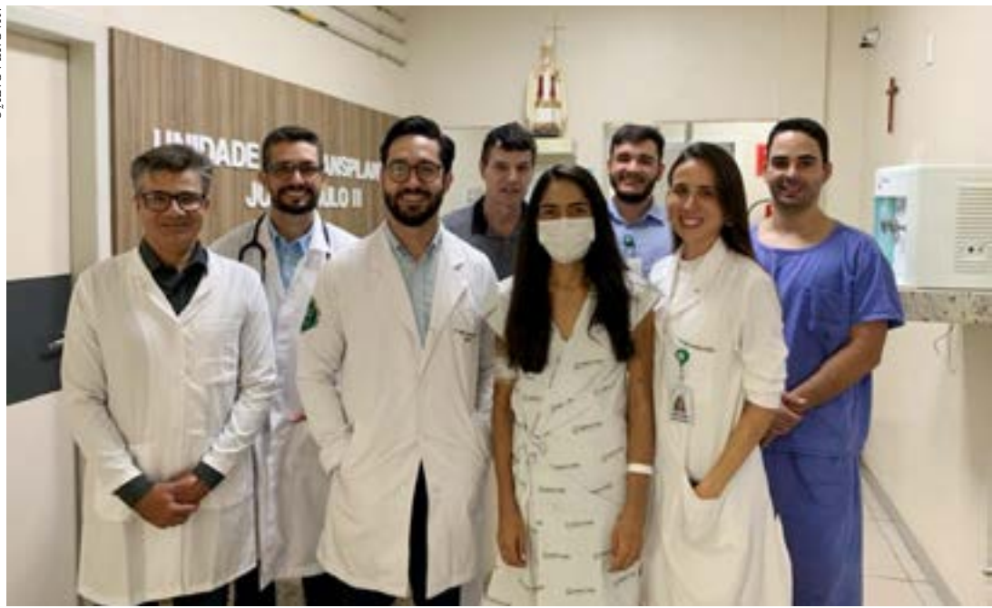
A equipe que realizou o procedimento cirúrgico e a paciente