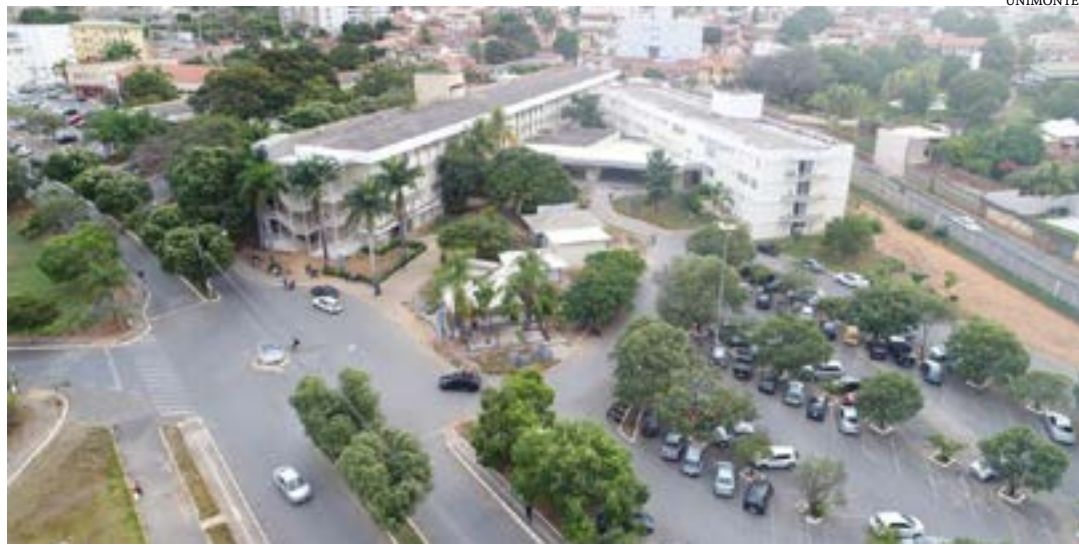
A Unimontes irá oferecer 470 vagas em 39 cursos de graduação

O início das aulas do primeiro semestre letivo está previsto para o dia 19 de fevereiro. O segundo semestre letivo será iniciado em 31 de julho, conforme calendário acadêmico da Unimontes disponível em https://unimontes.br/wp-content/uploads/2023/10/resolucao_cepex154-1.pdf . (FABRÍCIA ANDRADE)