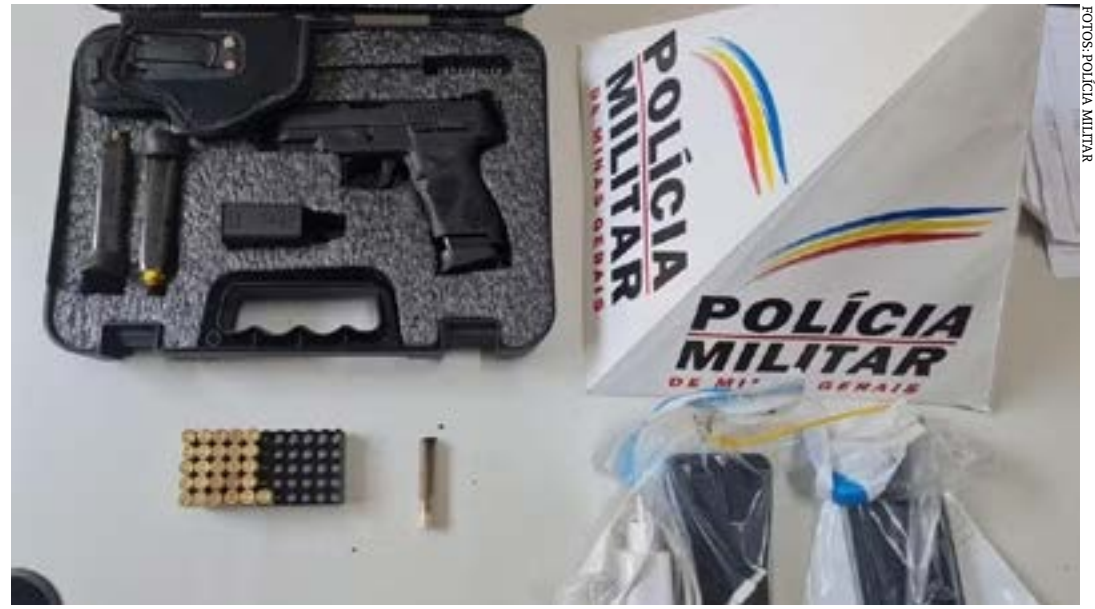
Arma apreendida na operação

Três pessoas foram presas em uma operação de combate ao tráfico de drogas realizada em São Francisco, Montes Claros e Ilhota (SC). A ação, denominada 'Doce Inimizade', foi deflagrada pela Polícia Militar nesta sexta-feira (19).