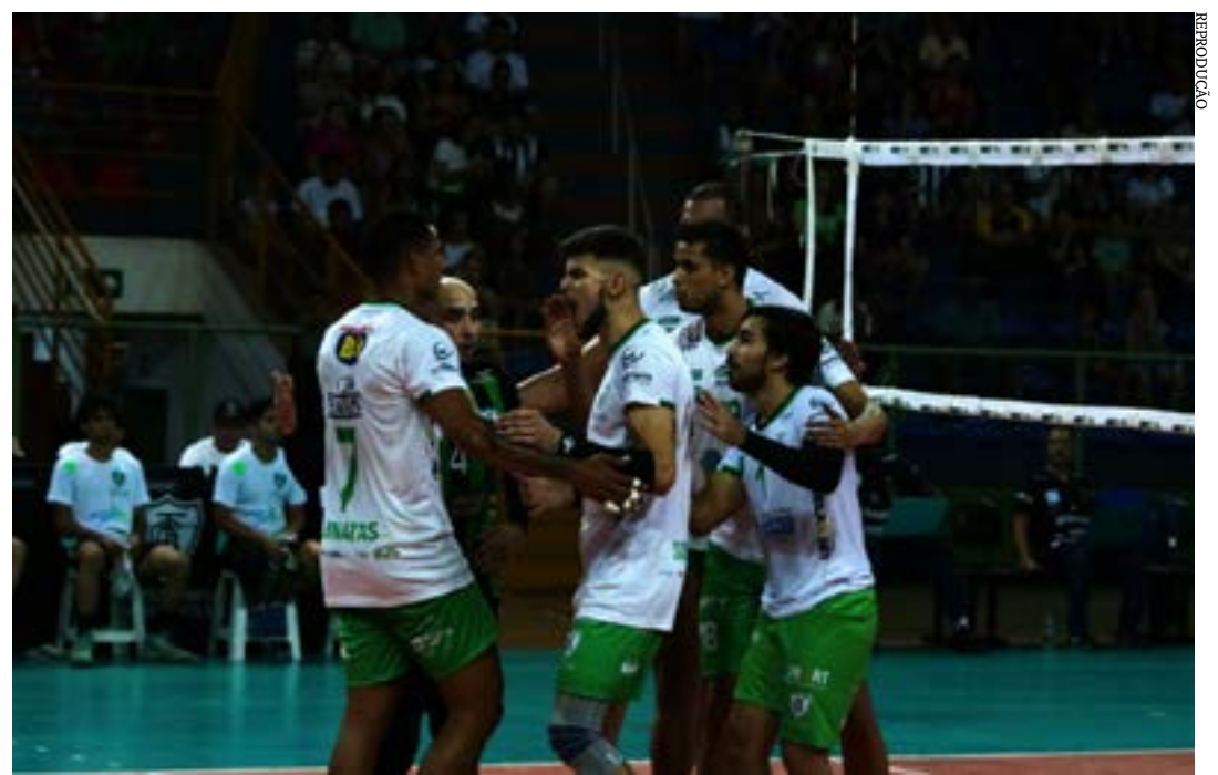
O fórum federal

6ª RODADA 24/02 (sábado) 16h (SporTV) | Vedacit Vôlei Guarulhos x Montes Claros América Vôlei, no