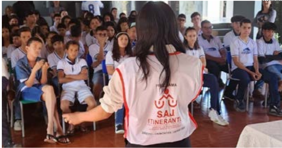
O projeto de extensão é vinculado ao curso de Direito

Ao longo de 21 anos, o SAJ Itinerante beneficiou mais de 50 mil pessoas com atendimento jurídico e palestras educativas em diferentes locais e ainda com a organização e apoio em seminários e congressos acadêmicos.