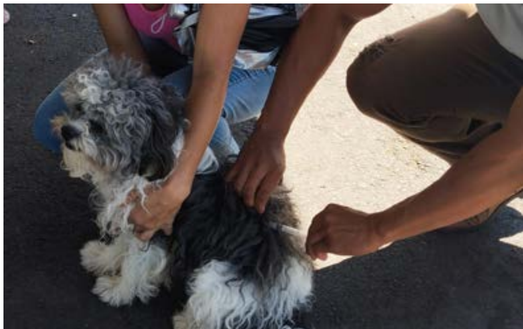
Ação de bloqueio ocorre após encontro de morcego com a doença no bairro Panorama

Acontece no campus-sede da Universidade Estadual de Montes Claros (Unimontes) até às 16h, de hoje (19), a vacinação de cães e gatos contra a raiva. A tenda de vacinação foi instalada pelo Centro de Controle de Zoonoses (CCZ)