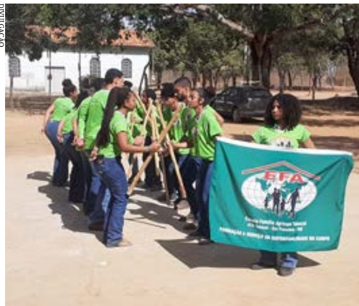
O evento de lançamento para aumentar a vigilância com o projeto 'Rua Segura'

O IFNMG publicou o Edital nº 12/2024, do processo de seleção simplificado para cadastro de reserva de vagas de docentes para atuarem no Curso de Formação Continuada em Agropecuária, nas Escolas Família Agrícola de Minas Gerais. O curso será ofertado na modalidade de educação, para professores e educadores dessas escolas.