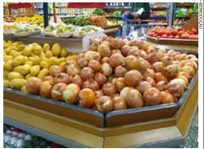
Os alimentos tiveram o maior impacto no aumento do custo de vida na cidade de Montes Claros

INFLAÇÃO DE MONTES CLAROS MAIS BAIXA QUE A NACIONAL