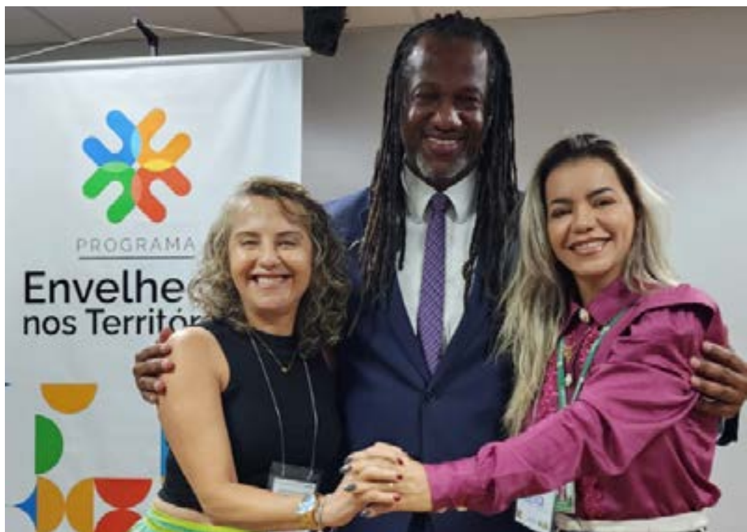
O evento de lançamento para aumentar a vigilância com o projeto 'Rua Segura'

Quanto à escolha dos IFs, este foi um reconhecimento do saber desses institutos, uma escolha pela competência técnica, por ser um órgão federal e ter a facilidade do repasse dos recursos, pela proximidade desses institutos com a população local e a visão geral que a população tem dos IFs, de ver esse instituto próximo a ela", celebrou a idosa.