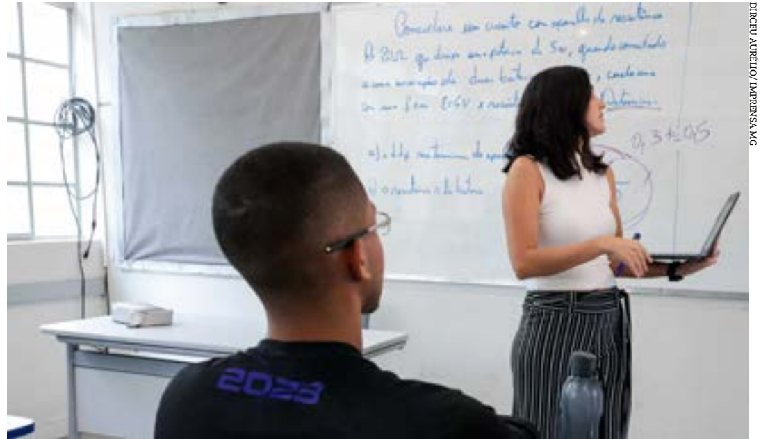
Período de inscrição está previsto para 1 a 9/2

lisar os recursos e realizar as publicações de listagem final. (Agência Minas)