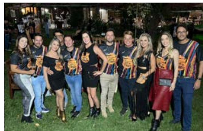
Este jornalista esteve na "Feijoada do Theo" do ano passado com um animado grupo de amigos. No dia 27 de abril, teremos a comemoração dos 30 anos deste fervilhante encontro no "Mirante Eventos".