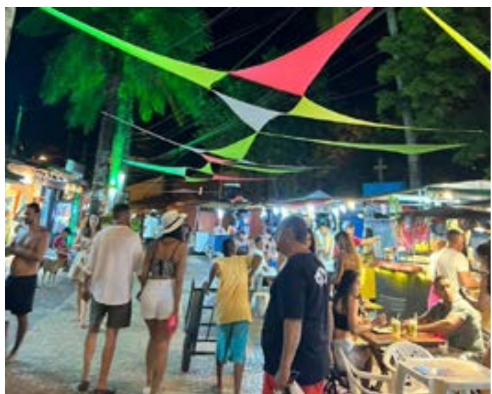
O verão em Arraial D'Ajuda continua fervilhante, com muita música e pessoas bonitas.