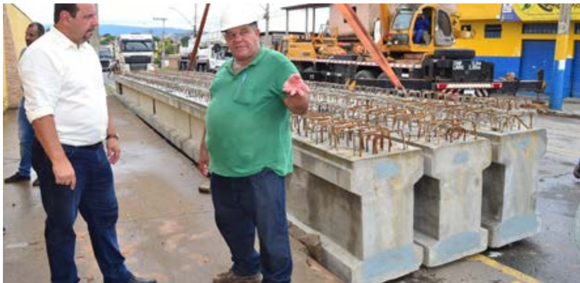
A Prefeitura de Montes Claros continua em ritmo intenso com as obras de construção da nova ponte sobre a linha férrea na avenida Minas Gerais, na divisa dos bairros Floresta e JK (região do grande Renascença). Na manhã dessa quarta-feira (3), o vice-prefeito visitou o canteiro de obras para fiscalizar o recebimento das seis vigas de concreto que serão colocadas no local ligando os dois pontos da ponte.

Vigas da ponte do JK já estão no canteiro de obras