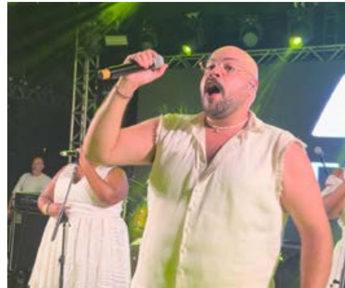
QUEM NUNCA assistiu ao show de Thiago Abravanel, deve fazer pois ele sabe movimentar o público