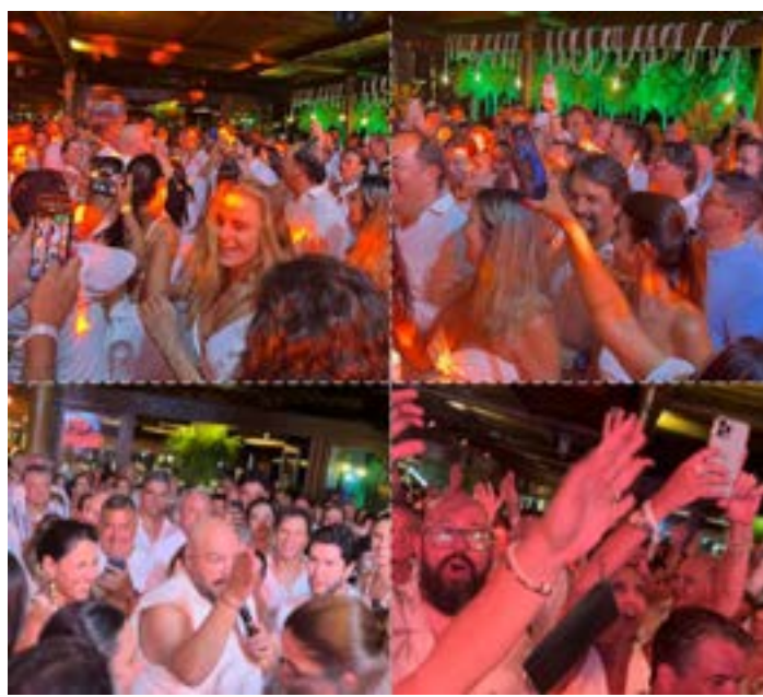
UMA VERDADEIRA explosão de alegria no grande salão do hotel Kuara. Até o cantor Thiago Abravanel entrou no agito