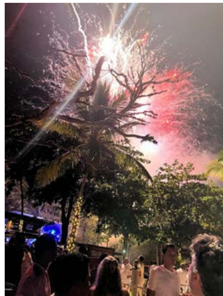
OUTRA FOTO dos fogos, no Kuara