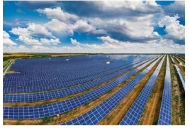
Os investimentos em infraestrutura de transmissão garantirão a necessária e urgente interligação das regiões produtoras de energias renováveis, incluindo o Norte de Minas

O maior leilão de transmissão de energia elétrica da história do Brasil, realizado nesta sexta-feira (15) pelo Ministério de Minas e Energia (MME), na Bolsa de Valores (B3), em São Paulo (SP), teve arrematados os três lotes oferecidos em cinco estados (Minas Gerais, Goiás, Maranhão, São Paulo e Tocantins), para a expansão de 4.471 quilômetros de novas linhas, acompanhadas de reforço de subestações e conexões com o SIN (Sistema Interligado Nacional).