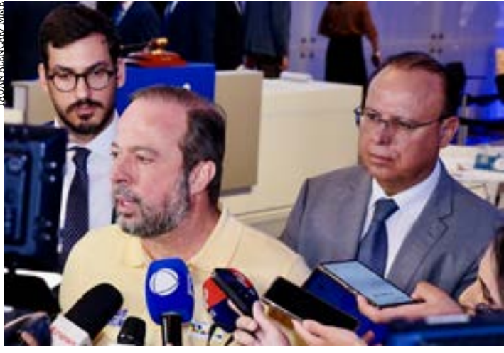
Ministro de Minas e Energia, Alexandre Silveira, e deputado Gil Pereira, durante entrevista sobre o megaleilão de transmissão de energia, realizado em São Paulo