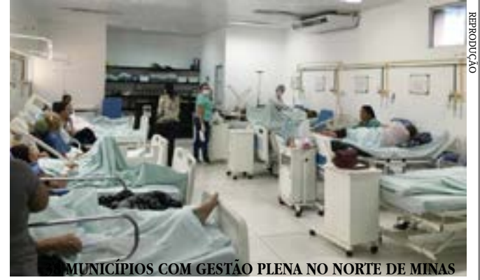
MUNICÍPIOS COM GESTÃO PLENA NO NORTE DE MINAS

Principais destaques dos jornais integrantes da Rede Sindijori MG