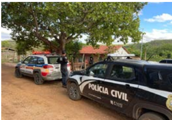
Policiais durante cumprimento de mandado

Todo o material apreendido foi levado para a delegacia da Polícia Civil.