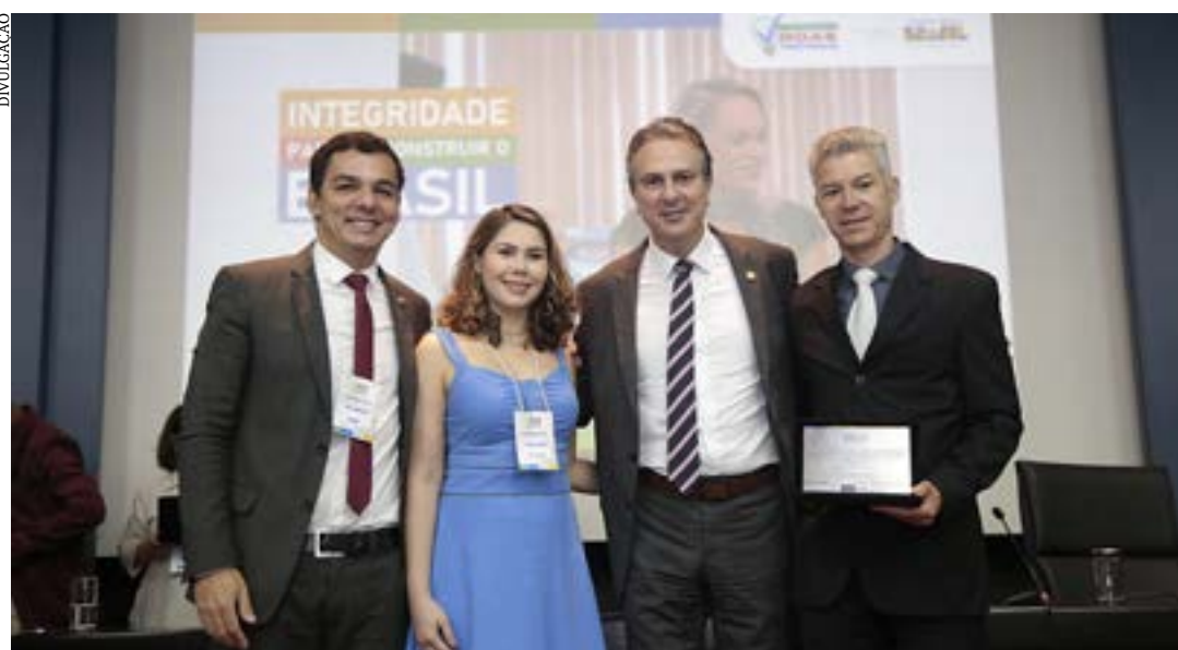
O ministro Camilo Santana e os auditores