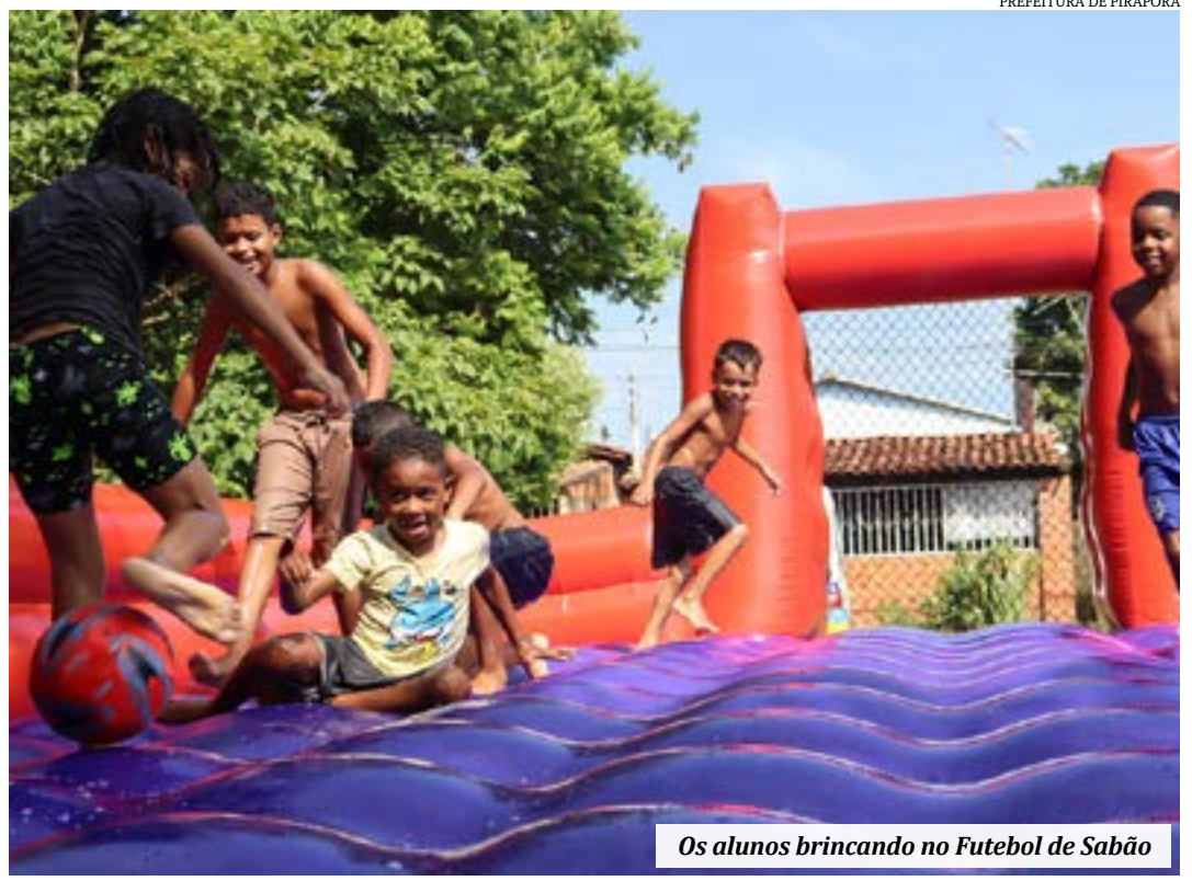
Os alunos brincando no Futebol de Sabão