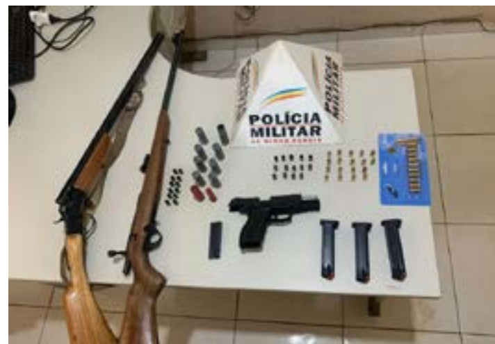
Materiais apreendidos pelos policiais