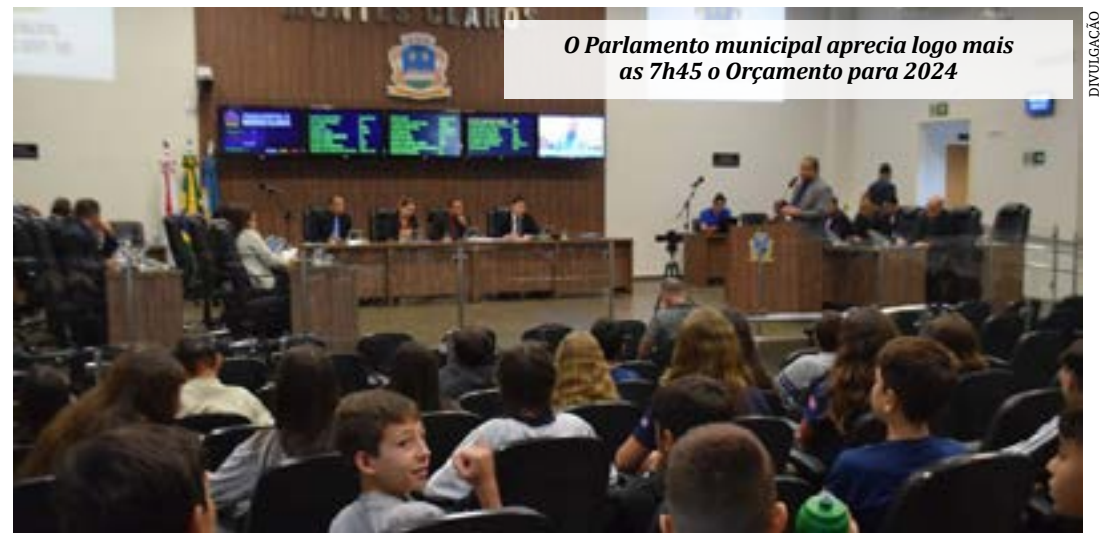
O Parlamento municipal aprecia logo mais as 7h45 o Orçamento para 2024

As maiores rubricas são da Secretaria de Saúde com R$ 718.062.000,00 e da Secretaria de Educação com R$ 460.007.000,00. A Câmara Municipal terá R$ 33.747.920,00 e a menor rubrica é da Secretaria de Administração Regional e Articulação Política com R$ 1.491.000,00.