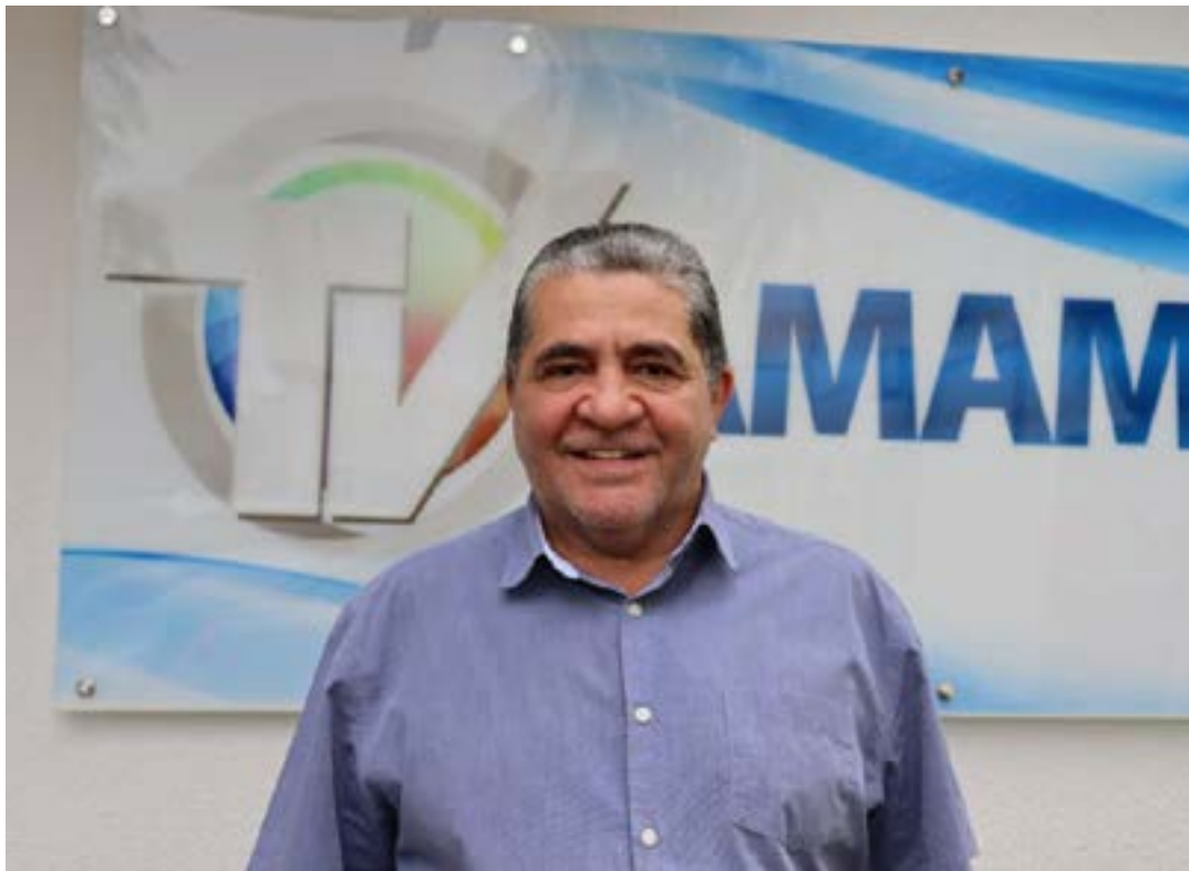
O presidente da entidade municipalista

A Associação dos Municípios da Área Mineira da Sudene (Amams), solicitou ao senador Rodrigo Pacheco, presidente do Congresso Nacional para que seja derrubado o veto ao projeto de desoneração. O documento foi assinado por toda