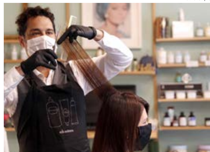
Iniciativa, gratuita, tem o objetivo de evitar que os profissionais da beleza enfrentem problemas trabalhistas e tributários

O grupo é composto por proprietários de salões e barbearias, que se uniram e receberam capacitações, cursos, consultorias e passaram a atuar na rede. Os participantes tiveram missões técnicas para eventos do setor como a Beauty Fair - Feira Internacional da Beleza, em São Paulo, e a Feira do Empreendedor, em Belo Horizonte.