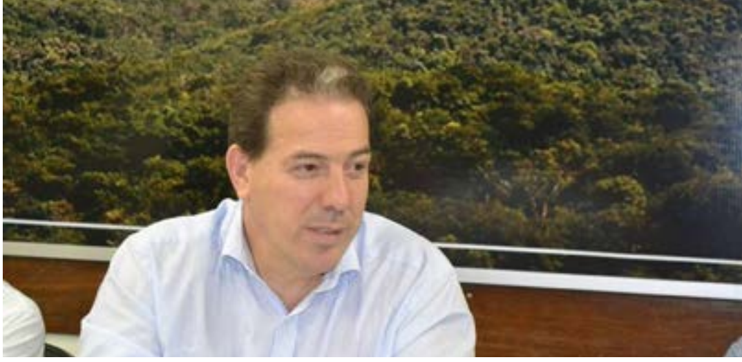
O ex-prefeito é aguardado na tarde desta sexta-feira (1º), para esclarecer as contas do período em que esteve a frente da Administração municipal, em 2016