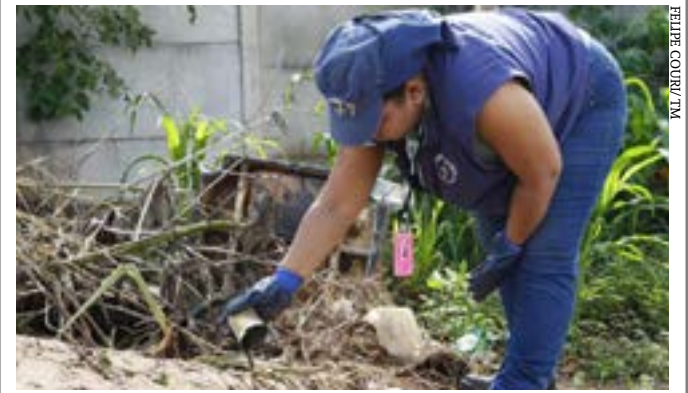
Unidade de Vigilância de Zoonoses mantém as ações do Programa Municipal de Controle das Doenças Transmitidas pelo Aedes

Principais destaques dos jornais integrantes da Rede Sindijori MG