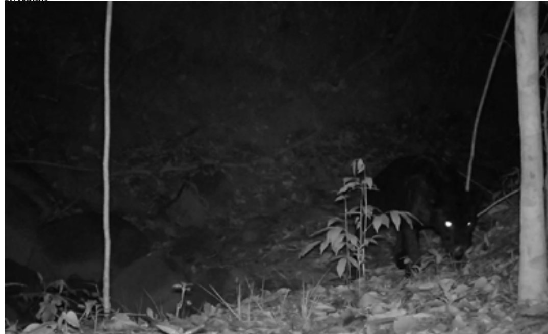
A onça-preta foi encontrada próximo à borda da chapada