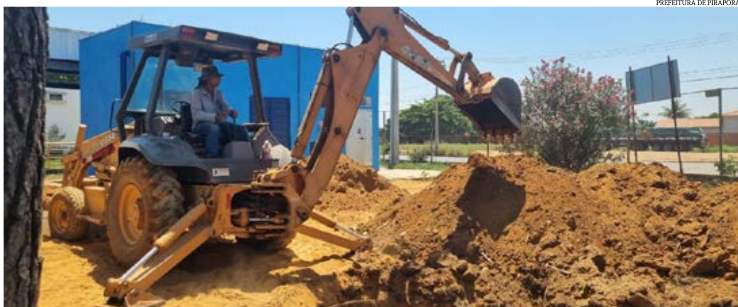
PREFEITURA DE PIRAPORA

dois novos conjuntos motobomba, com seus respectivos painéis de comando e controle, e também a escavação do terreno para instalação dos tubos que serão interligados as novas redes adutoras, uma para o reservatório do Nova Pirapora, que abastece Cidade Jardim, São João e Porto Belo, e outra que abastecerá os bairros Industrial, Nossa Senhora de Fátima e Cinquentenário. A previsão é de que os trabalhos sejam concluídos após o dia 22/11, data em que a Cemig agendou para efetuar a ligação da nova subestação, que irá alimentar o novo sistema de bombeamento. (TIAGO RODRIGUES – Colaborador)