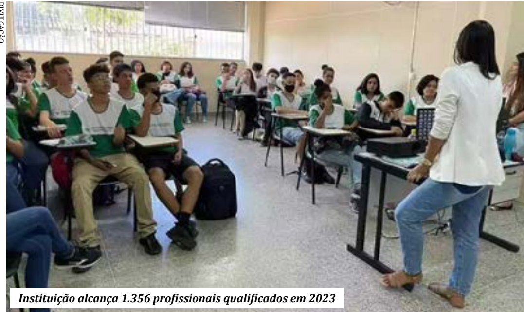
Instituição alcança 1.356 profissionais qualificados em 2023