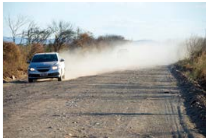
Dona da maior malha do País, Minas enfrenta desafios para a conservação e o desenvolvimento das suas rodovias