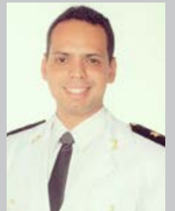
(*) Capitão PM – Comandante da 210ª Cia/10º Batalhão PM.

Nesse instante alguém poderia se perguntar: “e o urso”? O homem já não se importava mais com o urso. “Mas e as onças”? O homem não prestava mais a atenção às onças. Bem, esse conto serve para nos lembrar de que, por vezes, concentramos nossas forças apenas nas adversidades do dia a dia, quando deveríamos nos concentrar nos “morangos” que a vida nos propõe! De certo que o verdadeiro homem mede a sua força quando se defronta com o obstáculo, nos ensina o escritor Antoine de Saint-Exupéry. Na verdade tudo tem seu devido tempo! Quando a hora é de contemplar e saborear morangos, que o façamos por completo; mas se a hora é para enfrentarmos as onças e ursos, então que façamos a luta! O que não podemos é deixar de saborear os morangos e viver de mau humor com nossos familiares, colegas de serviço e com os amigos somente porque temos ursos e onças para enfrentar. Afinal ursos e onças nós encontraremos em nosso caminho até o final do último suspiro de vida! Precisamos mesmo é aprender a saborear os morangos para que a vida tenha um gosto e um significado maior de força, equilíbrio e felicidade! Certa vez, o poeta sulista, Mário Quintana disse: “um dia... pronto! Me acabo. Pois seja o que tem de ser. Morrer: Que me importa? O diabo é deixar de viver”.