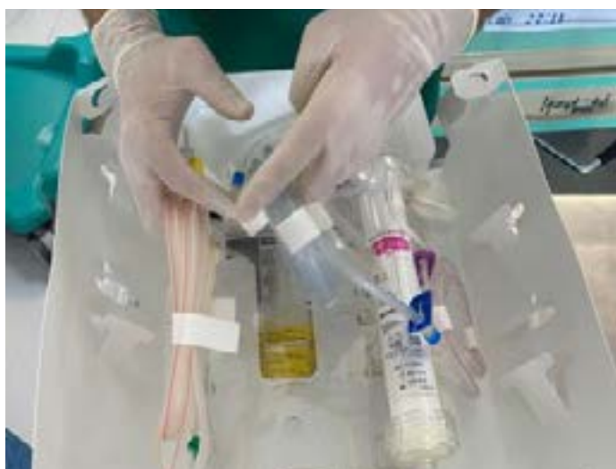
Procedimento de Plasmaferese

(PTT) que envolve a formação de pequenos coágulos de sangue por todo o corpo e bloqueiam o fluxo de sangue para órgãos vitais, como o cérebro, coração e os rins.