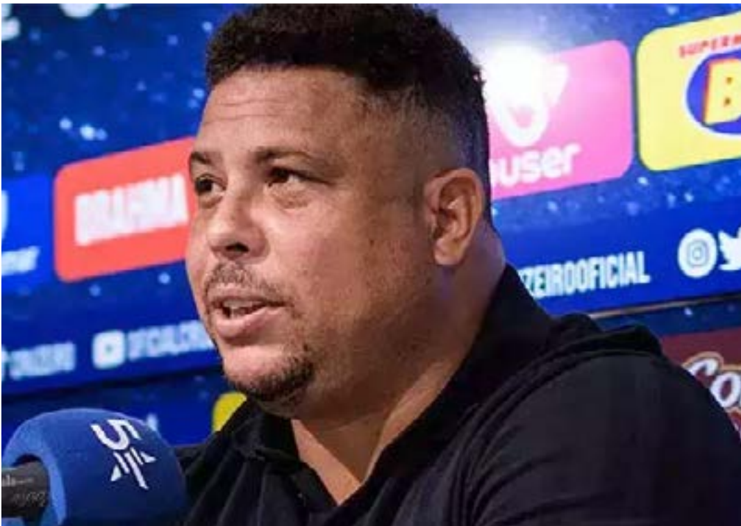
Ronaldo está com olhar atento às dívidas do Cruzeiro

O Cruzeiro quitou a dívida com o Independiente del Valle, do Equador, pela compra do zagueiro