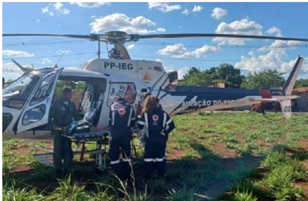
Criança será transferida de helicóptero para Montes Claros

Uma criança, de cinco anos, que tinha sido baleada pelo pai na entrada de uma escola de Claro dos Poções, morreu na tarde desta quarta-feira (1º).