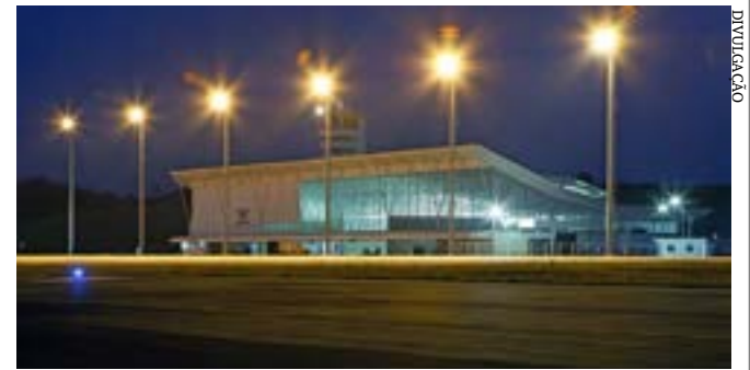
O Aeroporto Regional da Zona da Mata também se destaca pelo transporte de cargas

Principais destaques dos jornais integrantes da Rede Sindijori MG