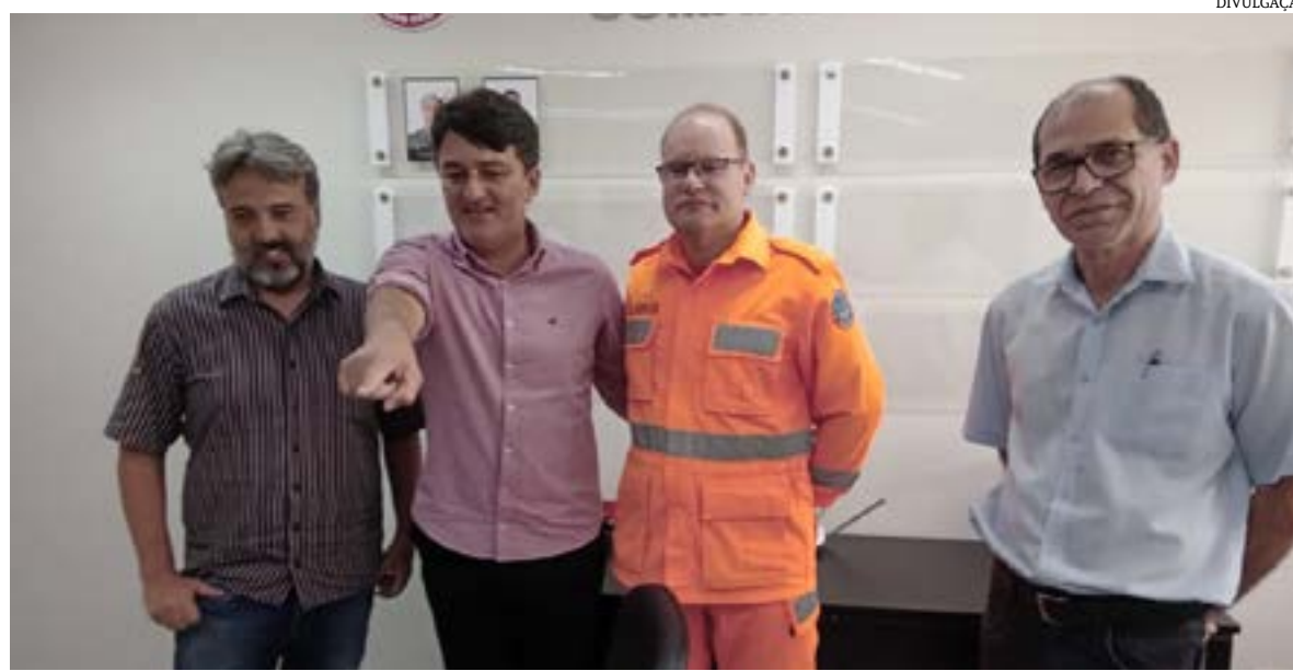
O 4º Comando Operacional dos Bombeiros Militares do Norte de Minas propôs a criação de brigadas da corporação nos municípios de São João da Ponte e São Romão, durante reunião realizada na manhã desta terça-feira, na Região Integrada de Segurança Pública, em Montes Claros, articulada pelo Conselho de Veneráveis do Norte de Minas a pedido das Lojas Maçônicas Vigilantes da Ponte e Aurora de São Romão.