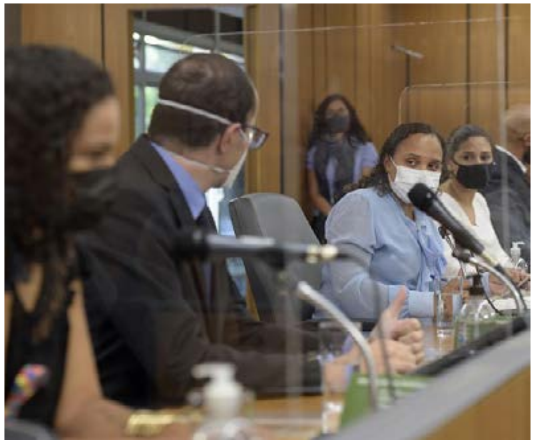
Comissão ouviu relatos de mães e especialistas com vistas a aprimorar as políticas públicas

ausência de representantes das Secretarias de Saúde e de Educação, que enviaram, apenas, a justificativa de ausência dos titulares. Ela anunciou requerimentos direcionados às duas pastas com pedidos de informações sobre ações, projetos e políticas para a população autista. (Portal ALMG)