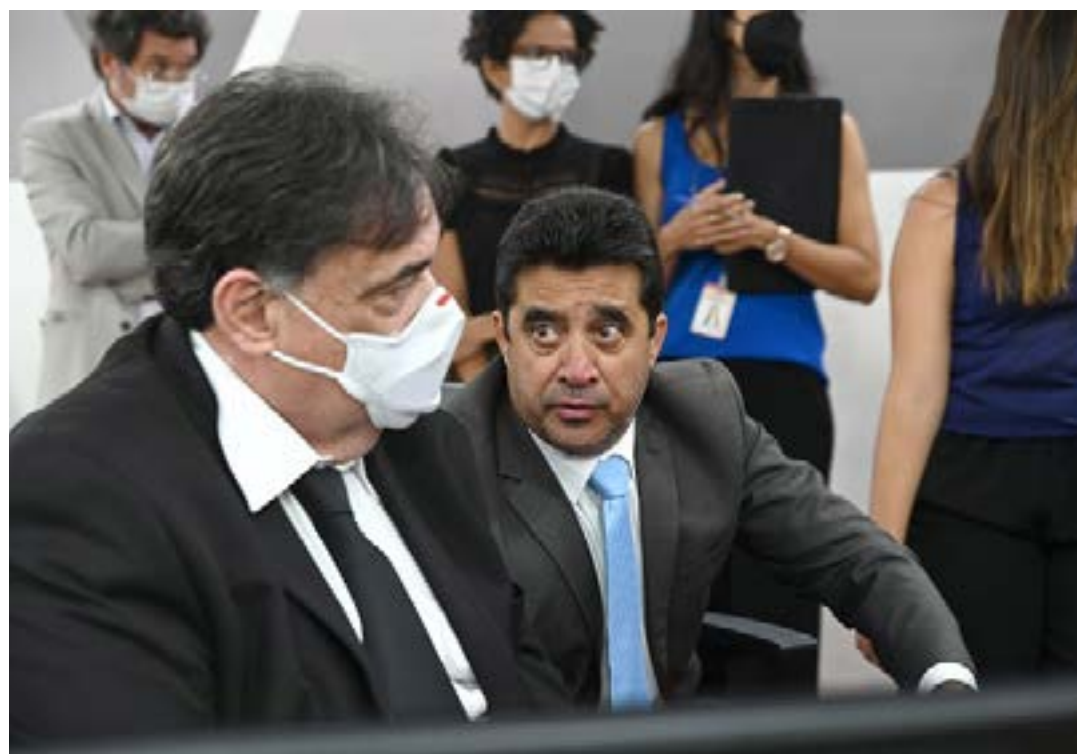
Deputados entraram em acordo para apresentar o mais breve o parecer sobre a matéria

O conteúdo não vetado da proposição deu origem à Lei 24.035, sancionada na última segunda (4), que traz a revisão geral de 10,06% para todos os servidores públicos. (Portal ALMG)