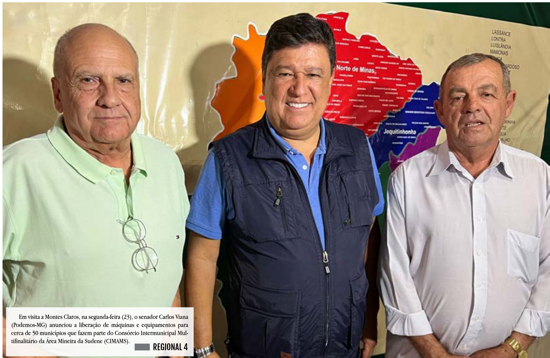
Em visita a Montes Claros, na segunda-feira (23), o senador Carlos Viana (Podemos-MG) anunciou a liberação de máquinas e equipamentos para cerca de 50 municípios que fazem parte do Consórcio Intermunicipal Multifinalitário da Área Mineira da Sudene (CIMAMS).