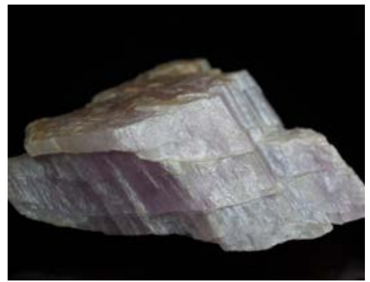
O lítio é um mineral considerado estratégico na transição para a economia de baixo carbono, necessária ao controle das mudanças climáticas

duto e perfuração dos trilhos para a implantação da ferrovia. A partir daí, o projeto será apresentado à Agência Nacional de Transportes Terrestres (ANTT) e feito o pedido de licenciamento ambiental. Depois, a licitação para execução da obra.