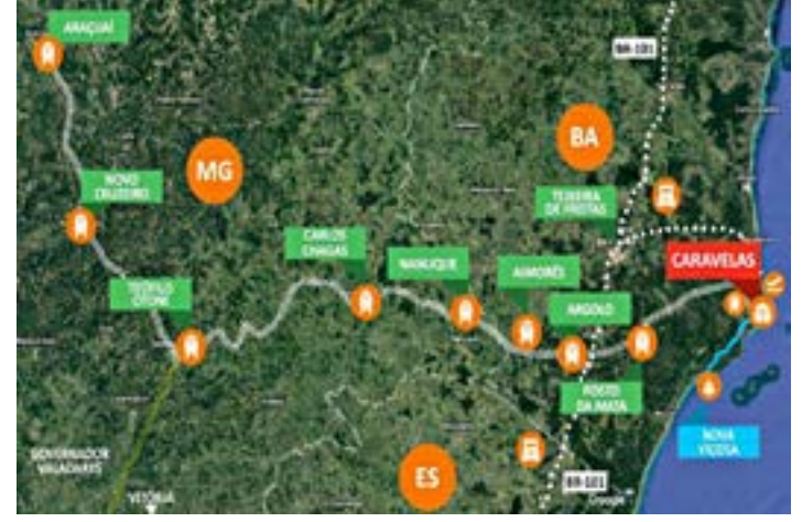
Projeto de Caravelas (Sul da Bahia) a Araçuaí (Vale do Jequitinhonha) poderá ser expandido até Salinas (Norte), a depender da viabilidade econômica do ramal ferroviário