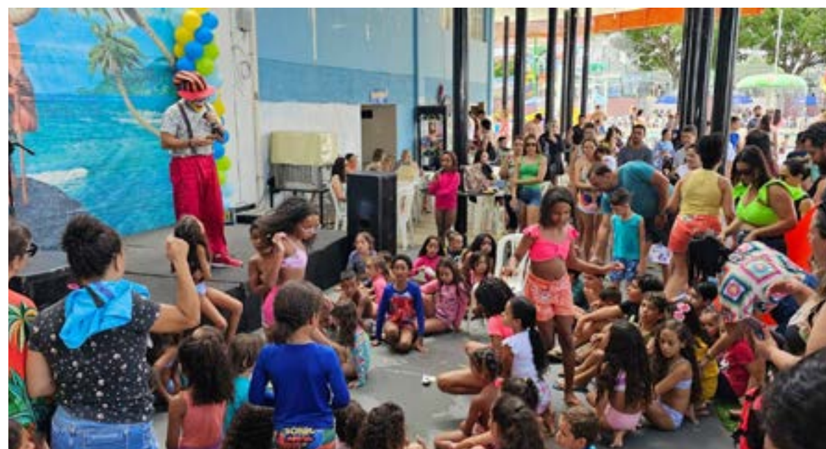
Dia de muita alegria, brincadeiras, guloseimas. A festa, em comemoração ao dia das crianças do Clube da AABB em Montes Claros foi animada e farta. Além da linda decoração, com o tema de Moana e brincadeiras com palhaço, os participantes desfrutaram de pipoca, algodão doce, picolés, cachorro quente e muito mais. O Clube ficou lotado e o clima de alegria predominou. ESPECIAL 4

CIDADE 4 Conab inicia visitas de campo para o 2º levantamento da safra de grãos 2023/24