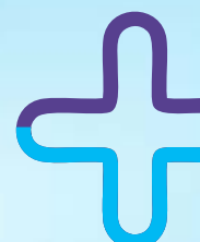
*Sujeito a alterações sem aviso prévio. Atendimento conforme liberação do Plano de Saúde.