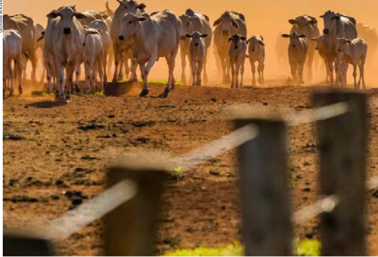
Brasil possui 234,4 milhões de cabeças de gado, segundo o IBGE

Número de bovinos no Brasil supera a população humana, segundo o IBGE