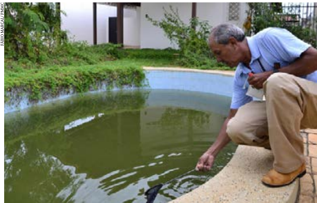
Trabalho dos agentes de controle de endemias poderá contar com suporte inovador de drones

A Resolução 9.035, publicada pela SES-MG, define três critérios para o repasse de recursos aos municípios e consórcios intermunicipais de saúde para a implementação do projeto. Para 34 municípios com população superior a 100 mil habitantes, o cálculo da área a ser