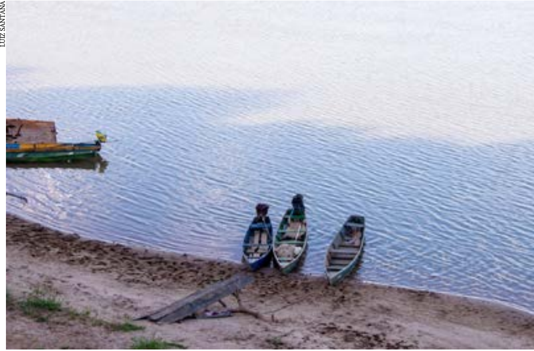
Ponte no município de São Francisco deve substituir barcos e balsas na travessia do rio