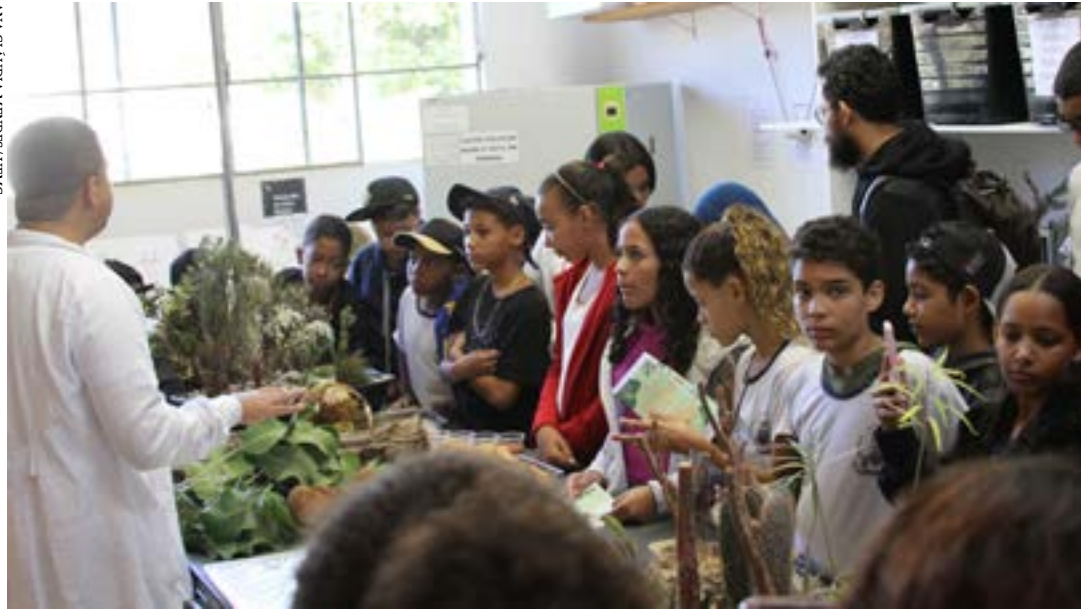
Atividade realizada no Herbário Norte-Mineiro durante visita de escola

Mobilizar a população em torno da importância da ciência como ferramenta para geração de valor, de inovação, de riquezas, de soluções para os desafios nacionais, de inclusão social e melhoria da qualidade de vida é este o objetivo da Semana Nacional de Ciência e Tecnologia. Instituída por decreto presidencial em 9 de junho de 2004, o evento é realizado todos os anos durante o mês de outubro pelo Ministério da Ciência, Tecnologia e Inovação (MCTI) em parceria com unidades de pesquisa, agências de fomento e entidades vinculadas.