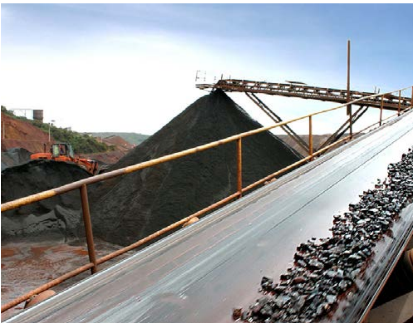
A extração de minério de ferro ajudou a elevar em 8,3% o percentual de crescimento

O boletim mostra que a dualidade entre o desempenho dos segmentos industriais associados ao crédito e à renda deve ser amenizada a medida que a inflação e a taxa de juros seguem em trajetória cadente. A resiliência do mercado de trabalho mineiro, o crescimento do rendimento médio real do Estado em patamar superior ao nacional e o programa de renegociação de dívidas devem continuar estimulando a demanda por bens industriais mais associados à renda, enquanto a continuidade do ciclo de redução da taxa básica de juros deve impulsionar a demanda por bens de consumo duráveis e semiduráveis, associados ao crédito. O documento destaca ainda que as expectativas positivas também são corroboradas pelo Índice de Confiança do Empresário Industrial (ICEI), que, em setembro, permaneceu acima dos 50 pontos indicando, pelo oitavo mês consecutivo, que os empresários mineiros estão confiantes. (Ascom BDMG)