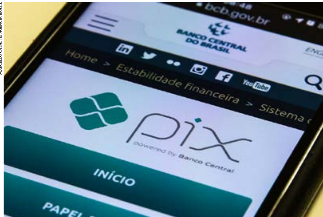
Recorde anterior havia sido registrado em setembro

o Pix acumulava, no fim de agosto, 153,36 milhões de usuários, conforme as estatísticas mensais mais recentes. Desse total, 140,65 milhões eram de pessoas físicas; e 12,71 milhões de pessoas jurídicas. Em agosto, o sistema superou a marca de R$ 1,53 trilhão movimentados por mês. (Agência Brasil)