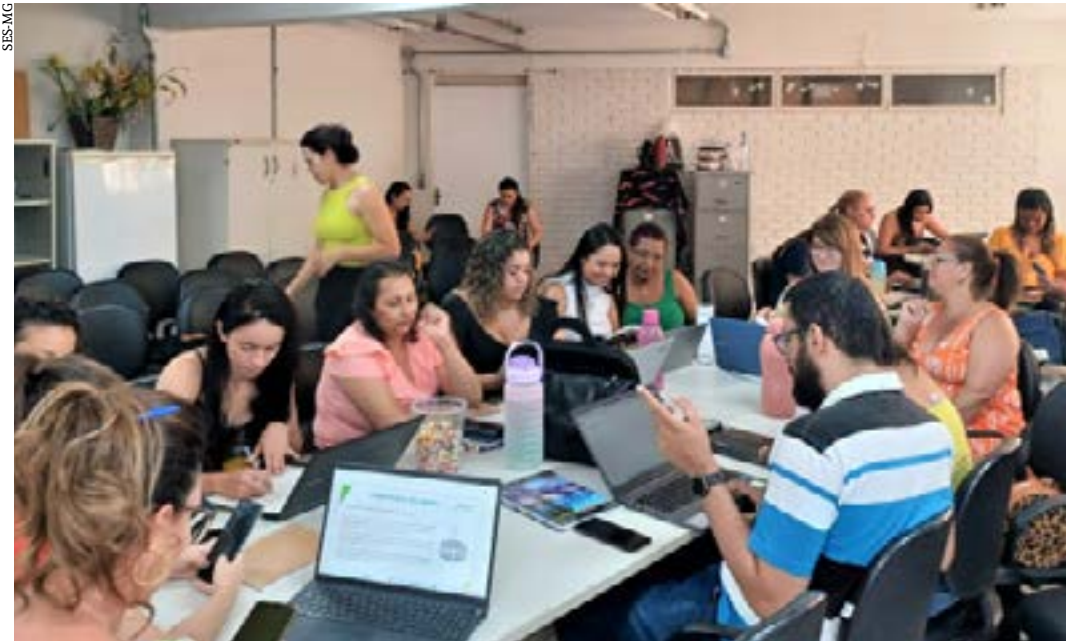
Oficina microplanejamento multivacinação

Com o reforço da necessidade de estabelecimento de estratégias diferenciadas com vistas ao aumento das coberturas vacinais, de acordo com a realidade de cada localidade, a Superintendência Regional de Saúde (SRS) de Montes Claros conclui nesta quinta-feira (11), a realização da 1ª Oficina de Formação de Profissionais Multipli-