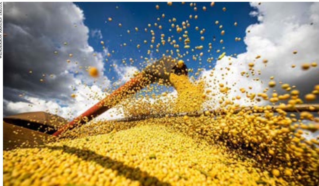
Produção pode ser 20,9% maior do que a registrada no ano passado

A produção de cereais, leguminosas e oleaginosas no país deverá fechar o ano com 318,1 milhões de toneladas. A previsão é do Levantamento Sistemático da Produção Agrícola, realizado em setembro, pelo Instituto Brasileiro de Geografia e Estatística (IBGE), e divulgado nessa terça-feira (10).