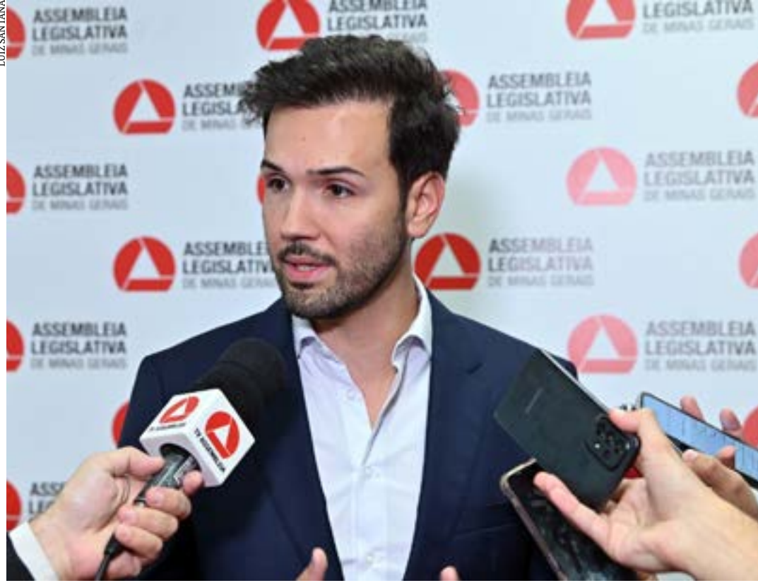
Presidente da ALMG fala sobre tramitação de proposições do Executivo que podem impactar economia do Estado

"Sabemos, também, que tanto o RRF quanto os processos que envolvem desestatizações no Estado ainda serão amplamente discutidos na ALMG e a participação, o diálogo e a construção junto aos parlamentares será fundamental na elaboração de um texto final que atenda aos interesses do povo mineiro", conclui a nota.