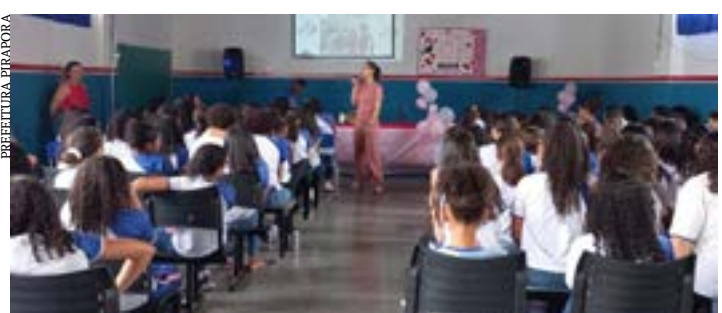
SECRETARIA DE SAÚDE DE PIRAPORA

A iniciativa da Secretaria de Saúde de Pirapora em promover essa palestra, visa fornecer informações essenciais para as adolescentes, capacitando-as a tomar decisões conscientes e responsáveis em relação à sua saúde menstrual, prevenção de gravidez e cuidados pessoais. (Ascom PMP)