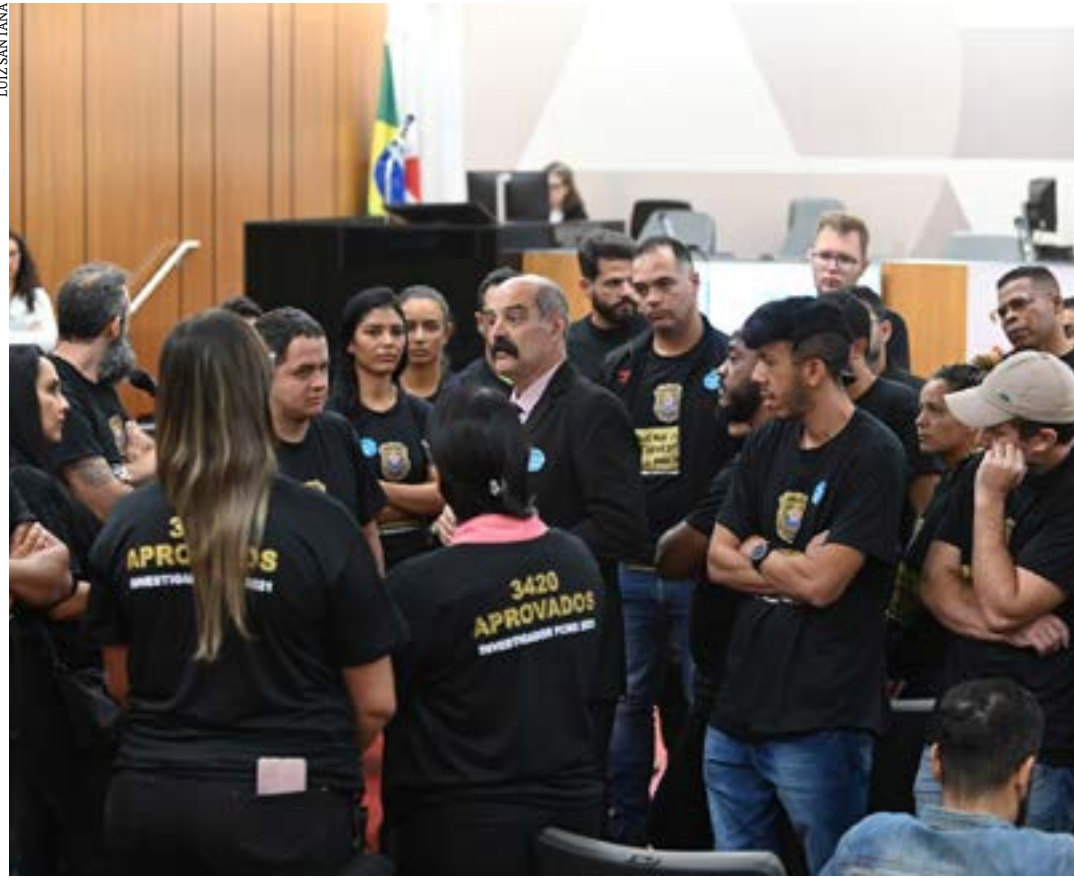
Aprovados em concurso da Polícia Civil pedem nomeação em virtude da insuficiência de pessoal