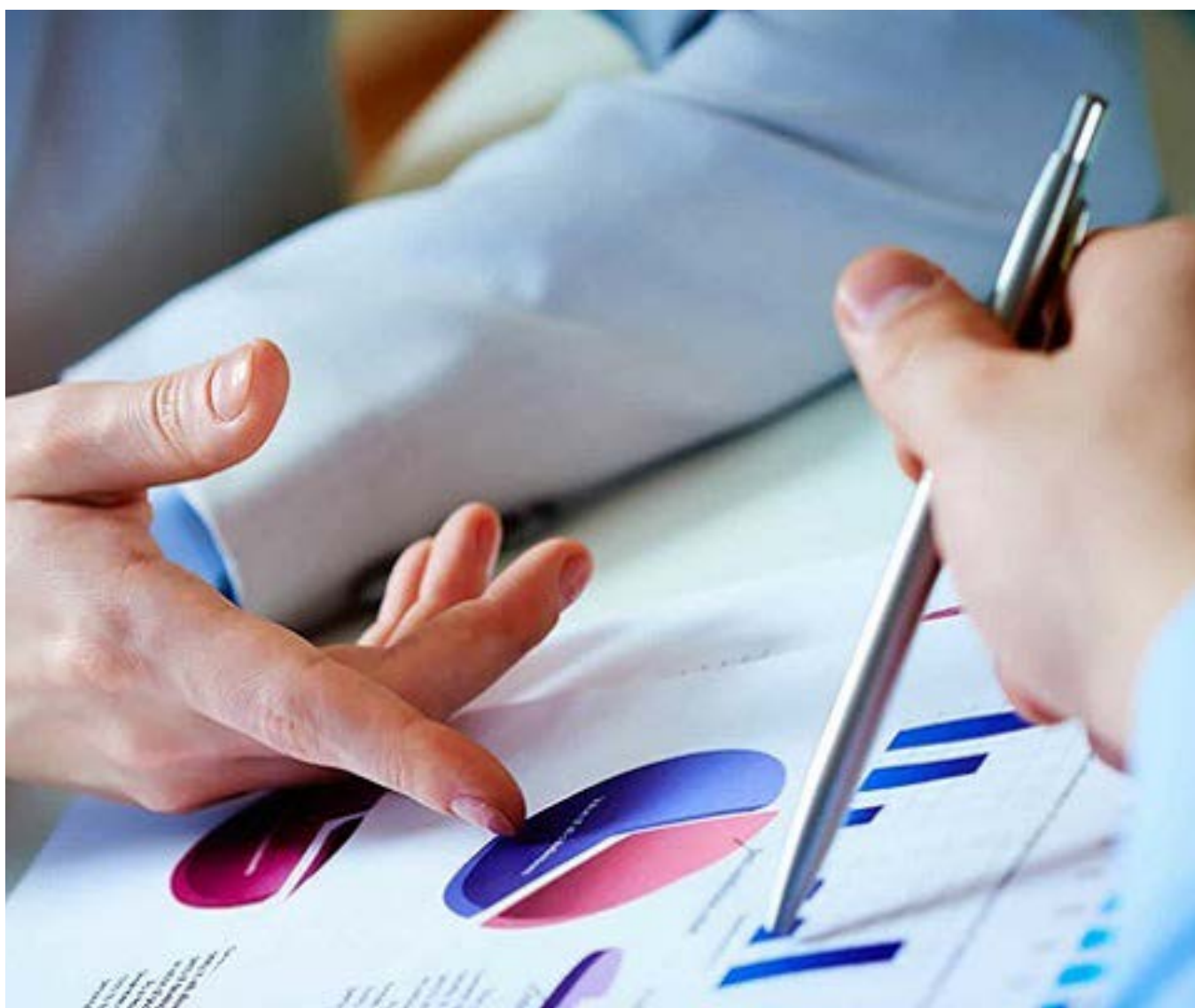
Pesquisa feita pelo Sebrae Minas mostra que índice ficou quatro pontos acima do mês anterior

O Iscon expressa a tendência para o nível da atividade, levando em conta o passado recente (últimos três meses) e o futuro próximo (próximos três). Um índice de confiança maior que 100 indica tendência de expansão da atividade; igual a 100, mostra a tendência de estabilidade da atividade e menor que 100, de retração da atividade. (Agência Sebrae)