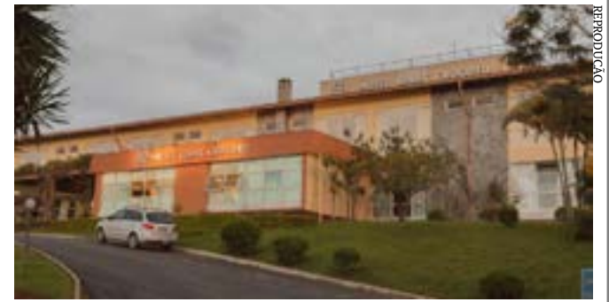
Localizado em Barbacena, primeiro hotel-escola da América Latina recebe investimentos em infraestrutura e tem ampliação dos serviços

Principais destaques dos jornais integrantes da Rede Sindijori MG