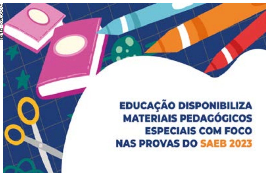
Os materiais são um complemento aos cadernos Mapa comuns e têm o objetivo de trabalhar com os estudantes as matrizes de referência e desenvolver as habilidades abordadas na avaliação

Com o objetivo de trabalhar as matrizes de referência e desenvolver as habilidades abordadas no Sistema de Avaliação da Educação Básica (Saeb) 2023, a Secretaria de Estado de Educação de Minas Gerais (SEE/MG) disponibilizou, de forma on line, cadernos especiais do Material de Apoio Pedagógico para Aprendizagens (Mapa). Os materiais Mapa-Saeb são voltados para alunos do 2º, 5º e 9º anos do ensino fundamental e do 3º ano do ensino médio, público da prova nacional, que será realizada entre os dias 23 de outubro e 10/11.