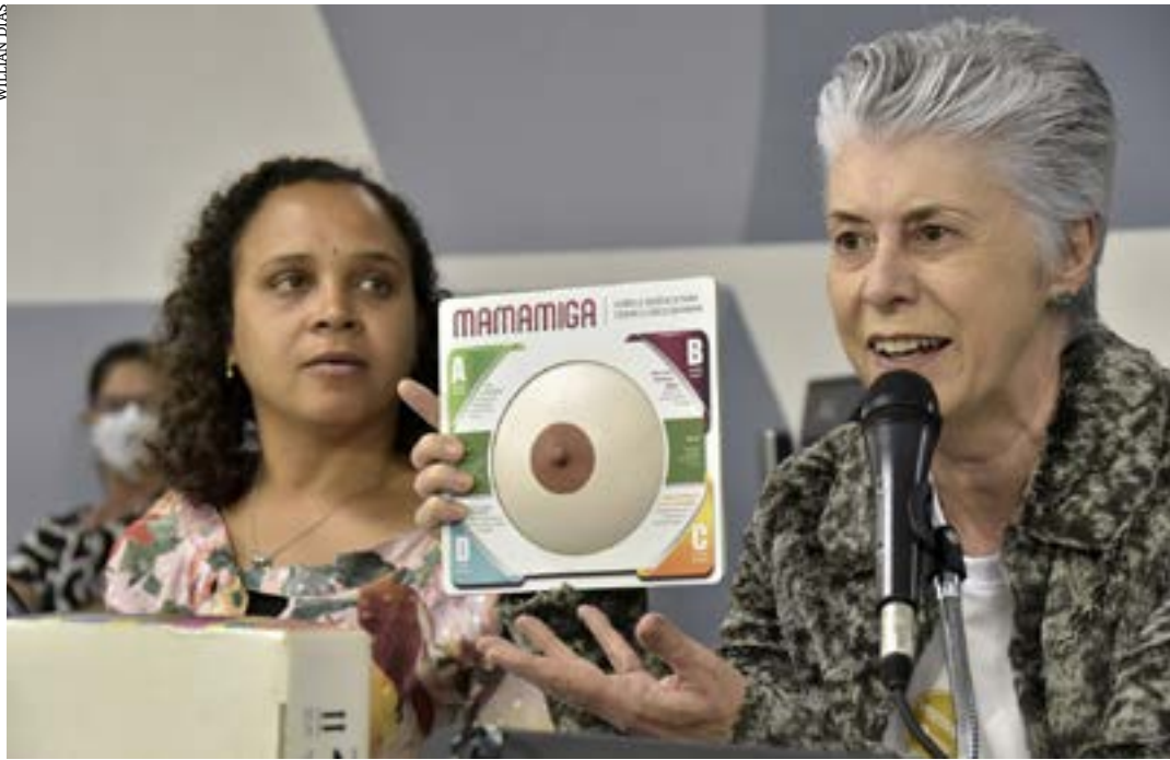
Audiência debaterá enfrentamento ao câncer de mama, alinhada com a campanha Outubro Rosa

A Comissão Extraordinária de Prevenção e Enfrentamento ao Câncer da Assembleia Legislativa de Minas Gerais (ALMG) realizará nesta quarta-feira (4), a partir das 13h30, no Auditório do andar SE da Casa, debate sobre as políticas públicas estaduais voltadas para o câncer de mama.