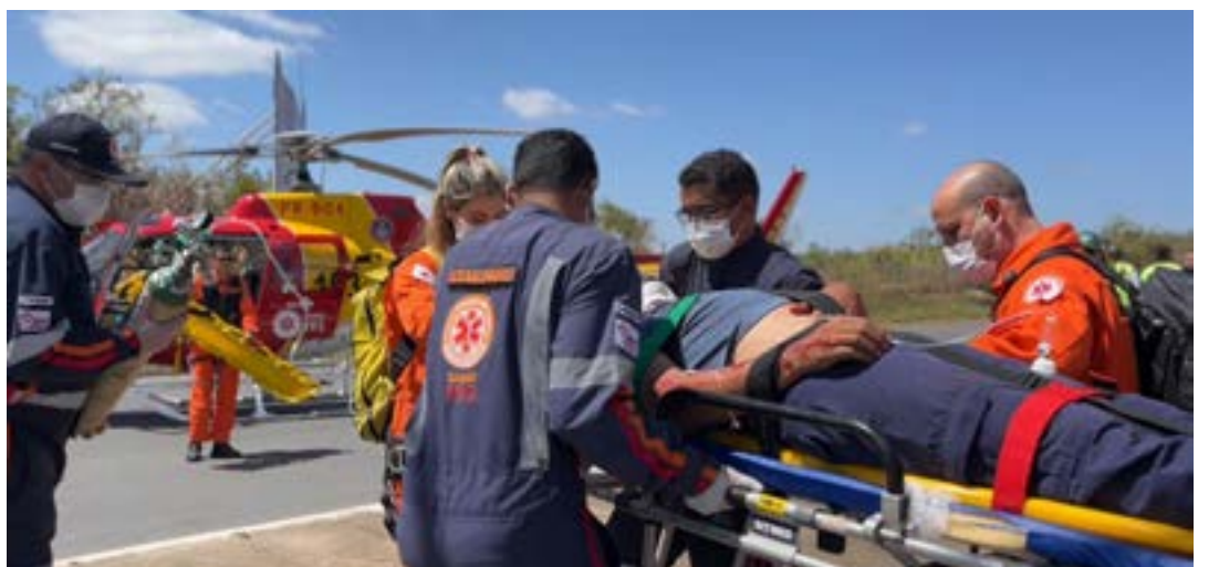
O serviço sendo realizado pelos socorristas

O SAMU em Montes Claros teve início como serviço municipal, em 2006. Com a Portaria do Ministério da Saúde nº 129, de 27 de janeiro de 2009, e a organização da Rede de Urgência e Emergência do Norte de Minas, em 2008, foi criado o SAMU Macro