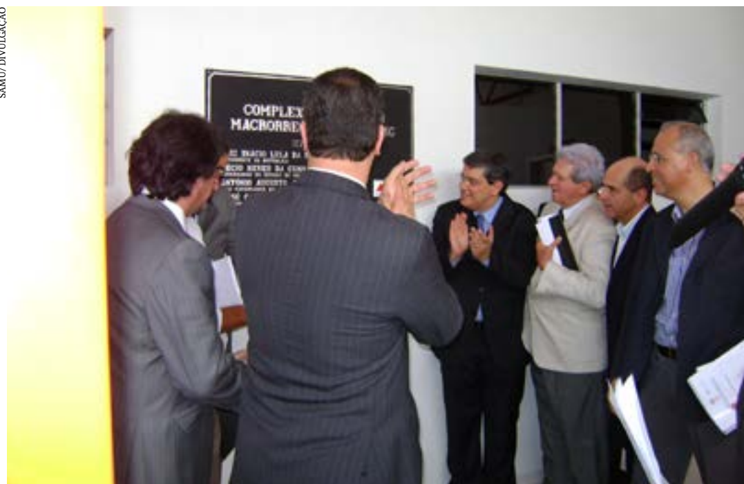
Data histórica, mostra o lançamento do serviço no Norte de Minas

O Serviço de Atendimento Móvel de Urgência (SAMU) comemorou 20 anos de implantação no Brasil, 17 anos em Montes Claros, e 14 de forma regionalizada, sob a administração do Consórcio Intermunicipal de Saúde da Rede de Urgência do Norte de Minas (Cisrun)/SAMU Macro Norte. O SAMU Macro Norte é o primeiro regionalizado do Brasil.