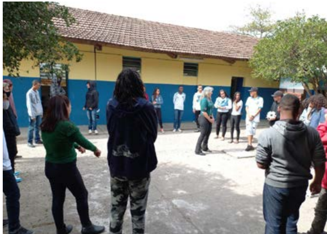
Estão previstas 63 vagas, para atuação nos Núcleos de Atendimento Educacionais (NAEs) distribuídos em diversos municípios

lecido junto à SRE, não limitando sua atuação à escola-polo. (Ascom SEE-MG)