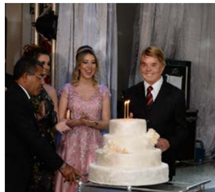
OUTRO MOMENTO marcante do meu aniversário era sempre os parabéns.