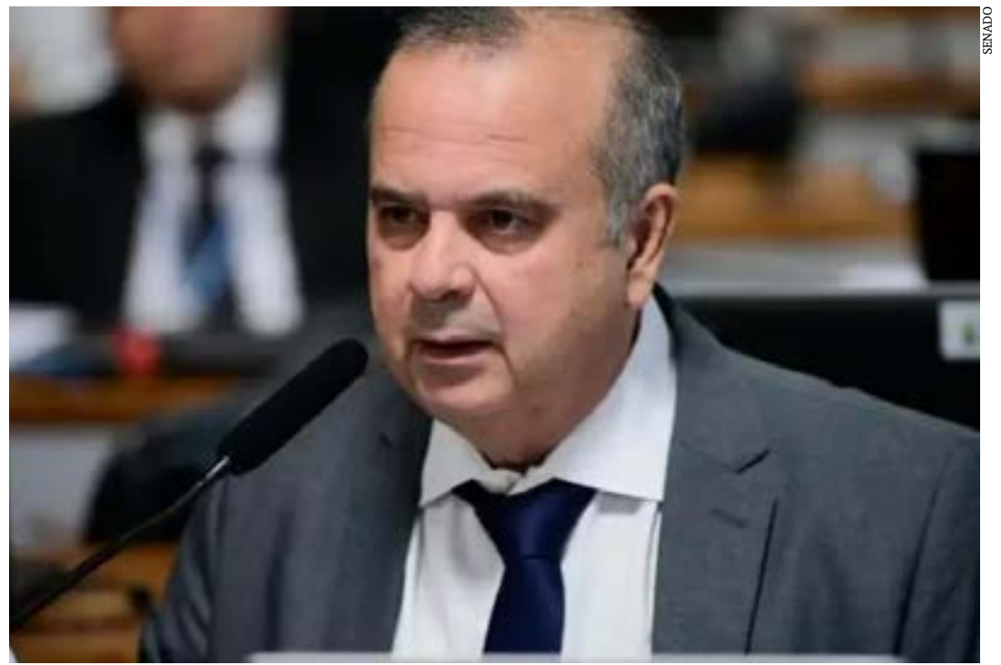
O senador Rogério Marinho

Em setembro de 2023, o Supremo Tribunal Federal (STF) entendeu ser constitucional a contribuição para não associados em caso de acordo, convenção coletiva ou decisão judicial. Porém, o STF considera que o empregado não é obrigado a pagar, desde que manifeste expressamente a oposição. (Agência Brasil)