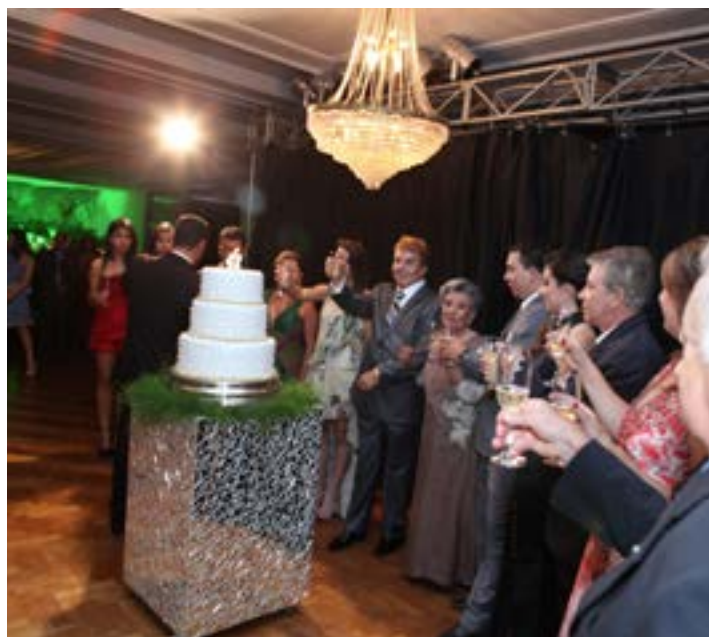
ESTE PARABÉNS ao lado dos meus familiares aconteceu no Automóvel Clube