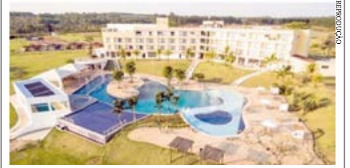
Wyndham Hotels & Resorts é parceira da Trul Hotéis, que assumirá a gestão do Furnaspark Resort