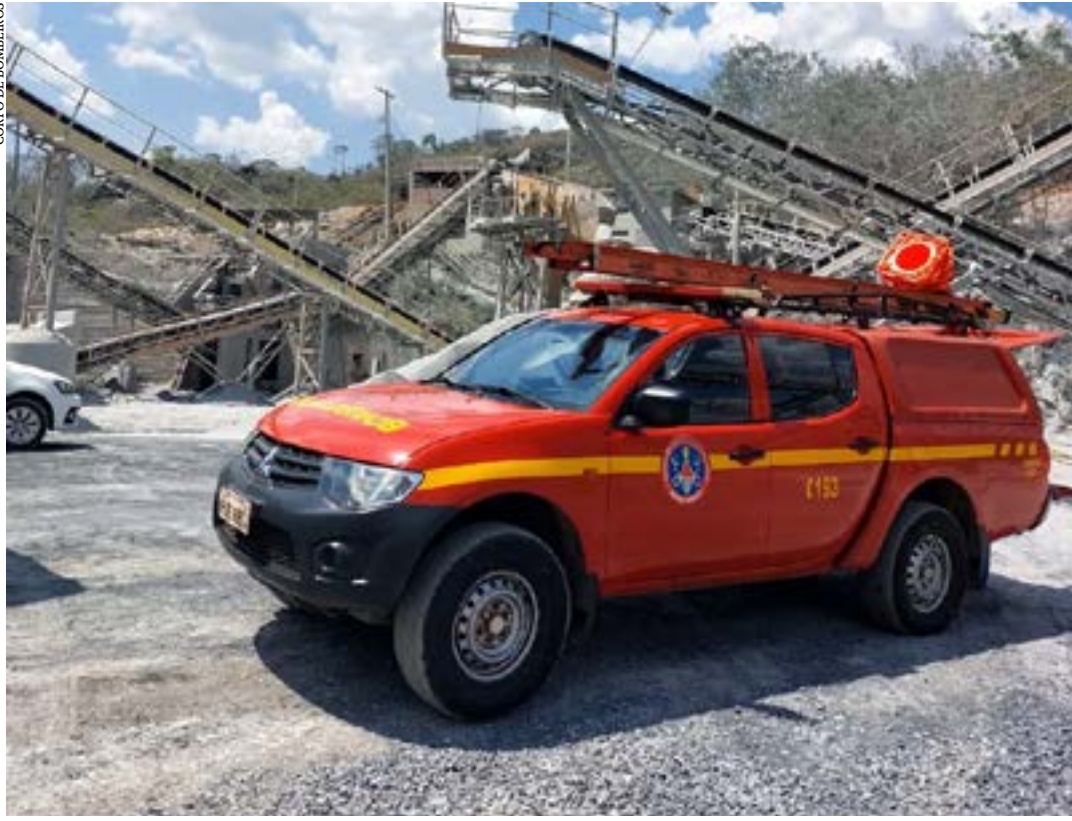
Local onde a vítima trabalhava