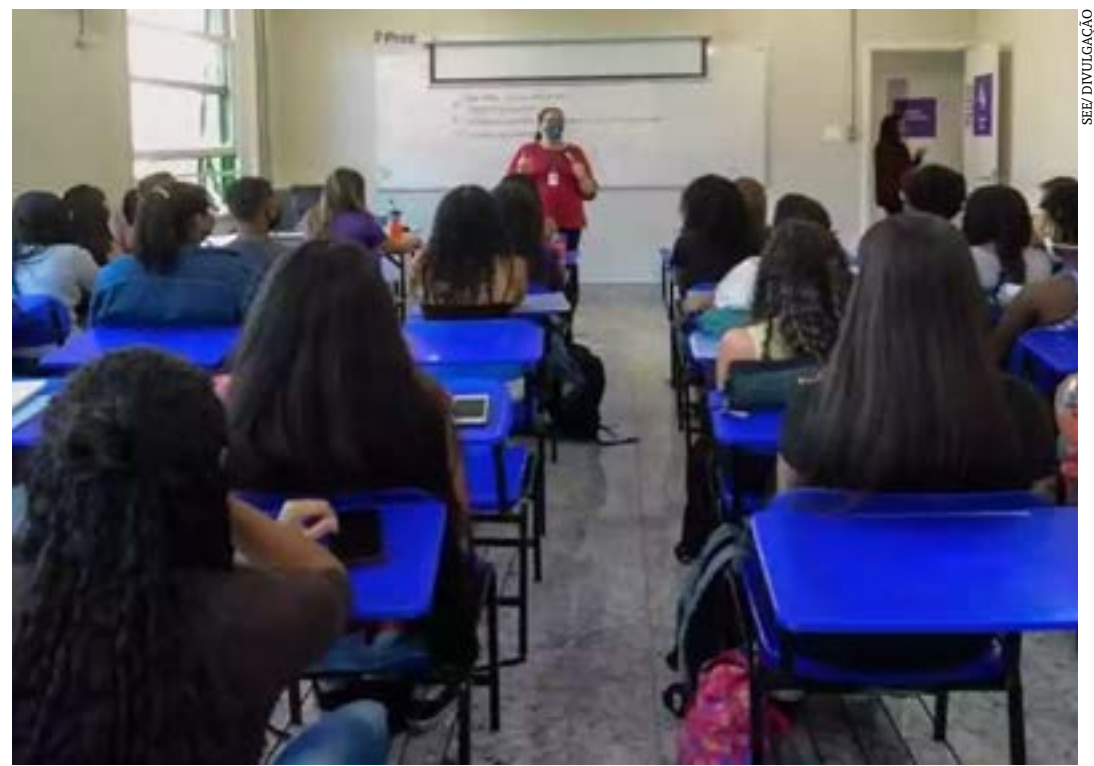
Previsão é de que as inscrições comecem em novembro e as aulas, em março de 2024

As instituições interessadas deverão apresentar a solicitação de credenciamento e a proposta de cursos acompanhada da documentação prevista no edital, exclusivamente em meio eletrônico e através de peticionamento no Sistema Eletrônico de Informações (SEI), conforme orientações disponibilizadas no site da Secretaria de Estado de Planejamento e Gestão (Seplag/MG). (Agência Minas)