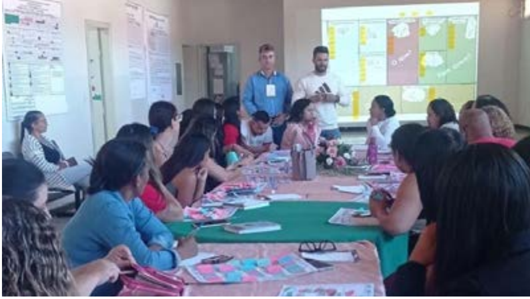
Evento promovido pelo Sebrae Minas e Prefeitura vai apresentar trabalhos de 25 escolas públicas

O Sebrae Minas em parceria com a Secretaria Municipal de Educação e a Prefeitura de Varzelândia realiza, na terça-feira (3/10), a 3ª edição da Feira de Educação Empreendedora. O evento, que tem o apoio da Secretaria de Estado de Educação de Minas Gerais, será realizado na praça Cícero Dumont, das 8h às 11h,