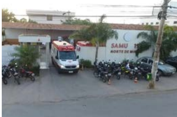
Base do Samu em Montes Claros

Após os trabalhos do perito da Polícia Civil, foi preciso usar uma corda para descer o corpo da vítima, que estava no alto da máquina. A Polícia Militar também compareceu no local.