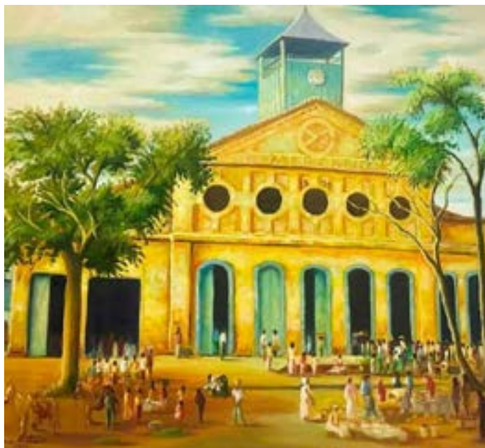
NOS ANOS 70. o renomado artista plástico, Onofre Santos, fez este retrato do nosso antigo MERCADO MUNICIPAL que como sabem, era onde funciona atualmente o SHOPPING POPULAR. Até hoje, a população não entende o porquê da falta de sensibilidade com a história de Montes Claros e derrubaram este patrimônio, deixando depois o Cimentão. Aliás, este e outros, só são vistos através das obras dos nossos grandes pintores. Estão acabando cada vez mais com a MEMÓRIA DE MONTES CLAROS. Nos últimos nãos, vimos vários casarios sendo restaurados e esperamos que a FACHADA DO AUTOMÓVEL CLUBE não seja destruída