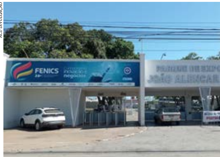
ACI realiza a feira de negócios com público estimado em 80 mil pessoas

A entrada da Fenics custa R$ 20 (inteira) e R$ 10 (meia-entrada). Os ingressos serão vendidos na bilheteria, no local. São esperadas cerca de 80 mil pessoas nos quatro dias do evento, que funciona das 18h às 23h59. O público terá a opção de estacionamento interno, no valor de R$ 30 para carros e R$ 15 para motos. Outras informações pelo site e redes sociais da acimoc.com.br. (Ascom ACI)