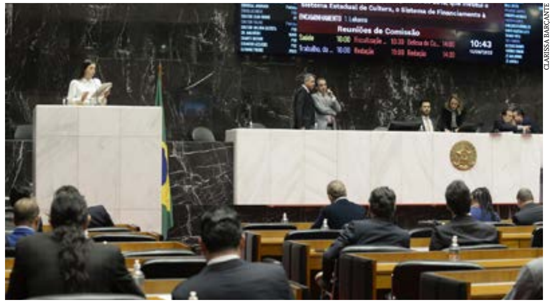
Os projetos sobre evasão escolar e participação de Minas no Consórcio Brasil Verde foram votados na manhã desta quarta (13)

Conforme a redação aprovada, assim que for alcançado o número mínimo de ratificações (11 estados), o protocolo de intenções será convertido no Consórcio Brasil Verde, autarquia interfederativa com natureza de consórcio