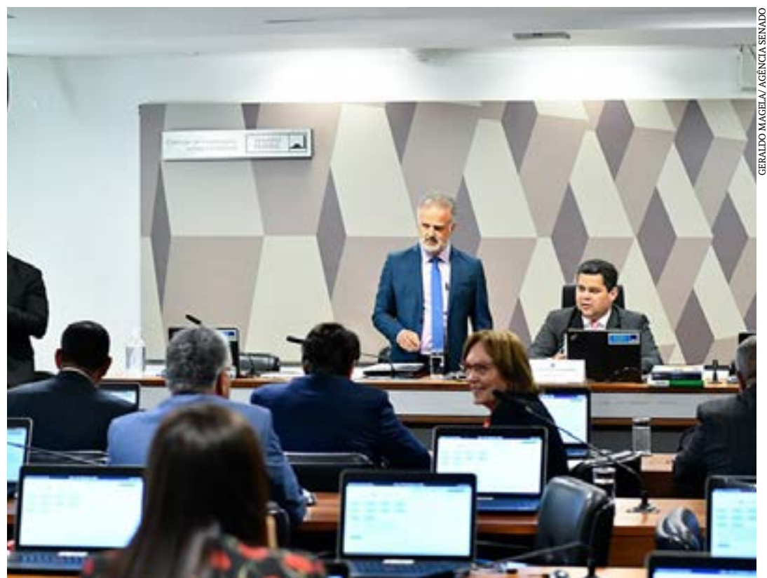
A PEC 38/2022, de Rogério Carvalho, tem relatório favorável de Jorge Kajuru e volta para a deliberação do Plenário

Ao apoiar a emenda, o senador Plínio Valério (PSDB-AM) afirmou que “nada mais justo do que tirar do Fundo Eleitoral” o montante para custeio dessas passagens. (Agência Senado)