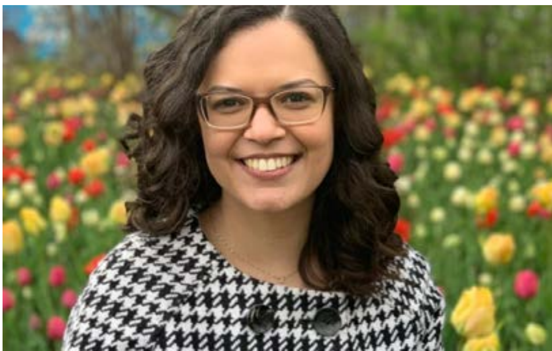
Saiba como dialogar com crianças e adolescentes sobre o papel da Espiritualidade em suas vidas

As inscrições podem ser feitas em: https://www.sympla.com.br/evento-online/forum-mundial-espirito-e-ciencia-da-lbv-2023/2092228