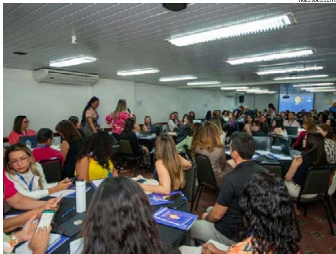
Oficina ocorre em três dias e reúne participantes dos diferentes níveis de atenção à saúde

Ela explica que o microplaneamento é uma ação integrada desenvolvida por profissionais de saúde dos diferentes níveis de atenção que compõe o Sistema Único de Saúde, nas diversas áreas relacionadas à imunização, como o Programa de Imunização, a Vigilância Epidemiológica, a Atenção Primária à Saúde e a Saúde Indígena. "Nesse contexto, é muito importante reforçar que a ação de vacinação ocorre dentro da Atenção Primária e que a porta de entrada para a população é a Unidade Básica de Saúde, onde se cria o vínculo com a população", conclui. (Ascom SES-MG)