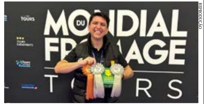
Anúncio da empresa ocorreu na reunião da Sudene, realizada na sede da Sudene, em Recife

Principais destaques dos jornais integrantes da Rede Sindijori MG