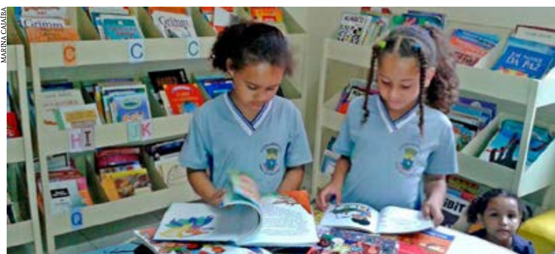
PEC determina que a biblioteca deve ser entendida como um “equipamento cultural obrigatório e necessário ao desenvolvimento do processo educativo”, com o propósito de democratizar o conhecimento, promover a leitura e a escrita, além de proporcionar lazer e suporte à comunidade

Conforme a exposição de motivos enviada pelo Poder Executivo, o acordo adquire especial relevância no atual contexto internacional de busca por maior transparência tributária, pelo incremento da cooperação entre as administrações tributárias e pelo cerceamento ao planejamento tributário agressivo, considerado pelo G-20 como um dos agravantes da crise financeira global. (Agência Senado)