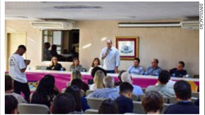
Anúncio da empresa ocorreu na reunião da Sudene, realizada na sede da Sudene, em Recife

Principais destaques dos jornais integrantes da Rede Sindijori MG