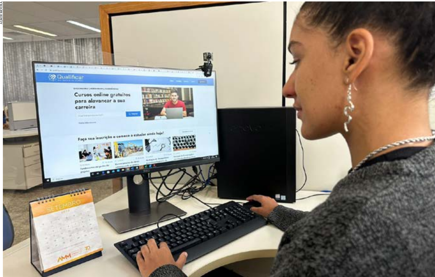
As aulas são no formato online e gravadas, e terão certificado de conclusão