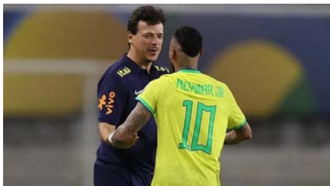
Jogo do recorde batido por Neymar também marcou a estreia de Fernando Diniz no comando da Seleção Brasileira