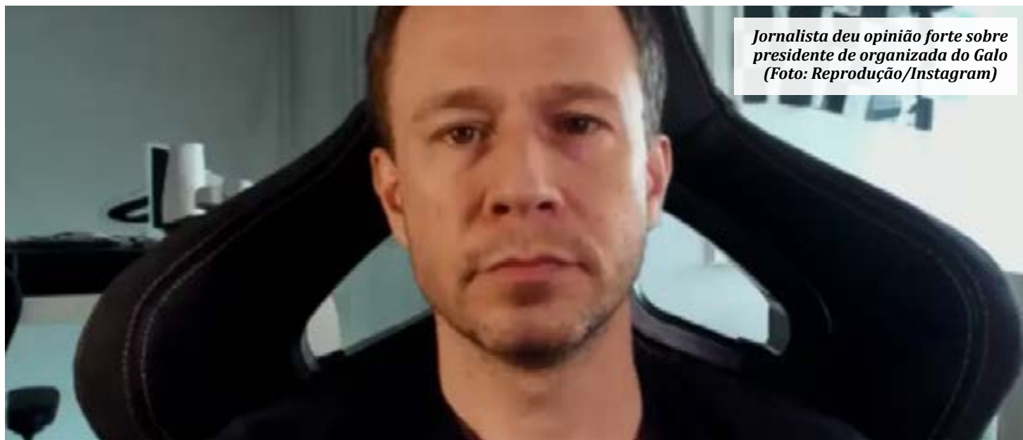
Jornalista deu opinião forte sobre presidente de organizada do Galo

- Você está largando a família para ir lá ameaçar o Vargas, você está doente, meu irmão. Você tá doente. Vai procurar ajuda. Você está maluco. O futebol não é teu. O Galo não é seu. O dinheiro do Galo não é seu, cai na real. Esses caras são completamente doentes e ninguém nota. Tem que expulsar esses caras da torcida organizada. Tem que expulsar - completamente. (Lance)