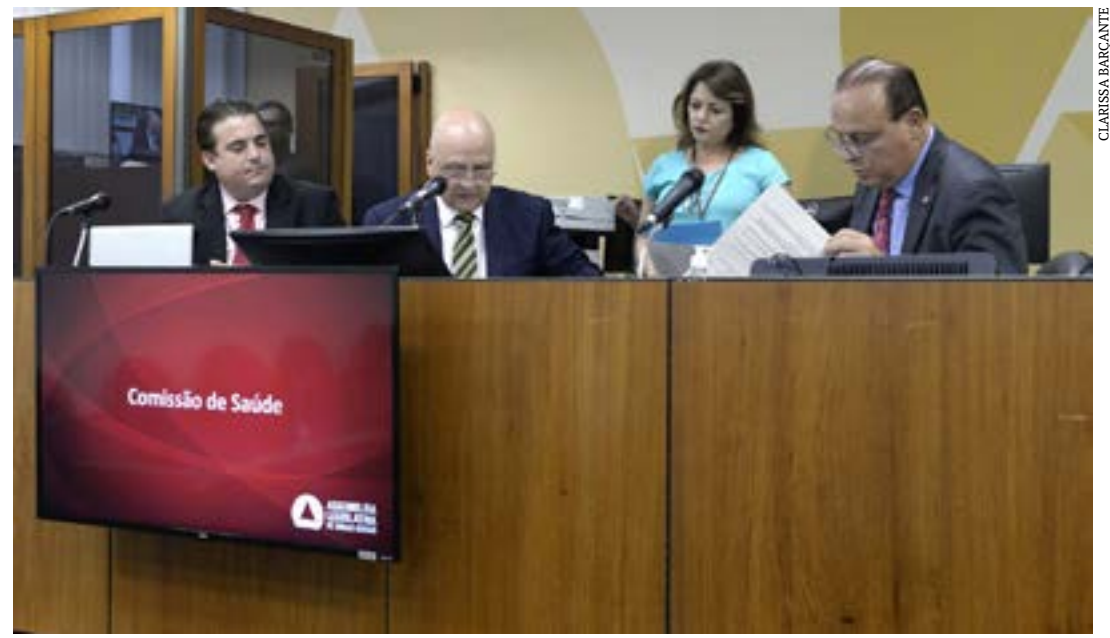
O parlamentar (ao centro) destaca que entre os beneficiários estão municípios e consórcios públicos de saúde

O Deputado ressalta que o prazo final para executar as ações vai até o dia 30 de novembro. Ele informa ainda que os municípios/consórcios poderão consultar o link https://www.saude.mg.gov.br/lei171 , disponibilizado pela Secretaria de Estado de Saúde, para tirar