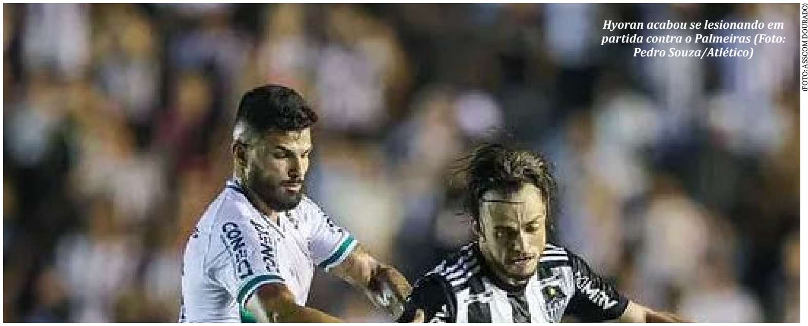
Hyoran acabou se lesionando em partida contra o Palmeiras

Na próxima partida, Hulk e Jemerson estarão cumprindo suspensão e não poderão entrar em campo. Já Maurício Lemos e Rodrigo Battaglia já cumpriram toda a punição por conta de cartões amarelos e estarão a disposição de Felipão para enfrentar o Botafogo no dia 16, na Arena MRV. (Lance)