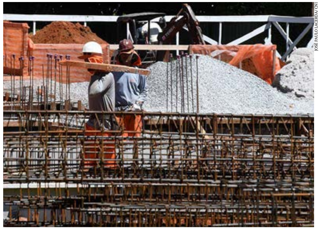
Construção civil é um dos setores beneficiados com a desoneração sobre a folha de salários

A renúncia fiscal com a desoneração no setor privado é estimada em cerca de R$ 9,4 bilhões, segundo o Ministério da Fazenda. No entanto, para o autor trata-se de uma política já existente, ou seja, o governo já não recebe esses recursos. Ele também afirmou que a