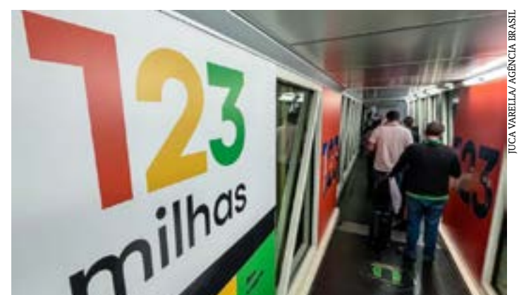
A suspensão dos pacotes e da emissão de passagens da linha promocional pela 123 Milhas deixou desamparados milhares de consumidores por todo o País

Muitos desses clientes só estão descobrindo que os bilhetes foram suspensos na hora que chegam ao aeroporto. A empresa diz que esses cancelamentos foram realizados de forma unilateral por outros prestadores de serviços.