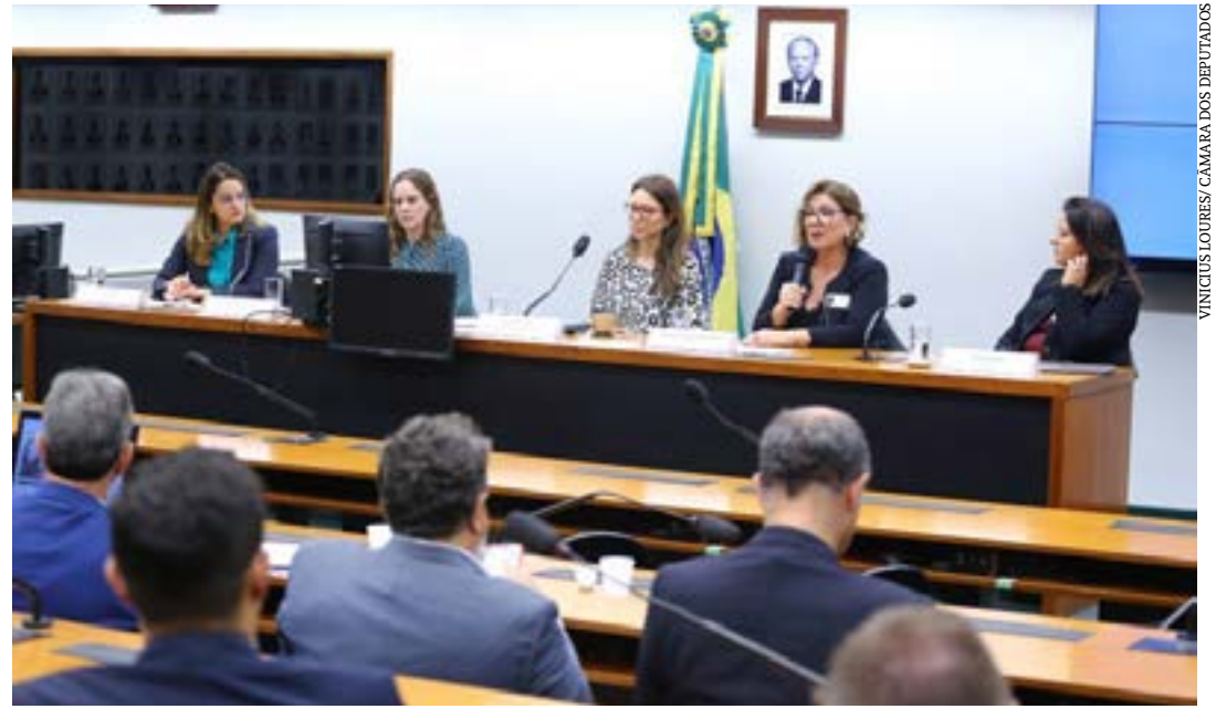
Audiência pública da Comissão de Desenvolvimento Econômico

da Sebrae, são cerca de 1,7 milhão de pequenos lojistas digitais, ou apenas 7% do varejo convencional desse porte. (Agência Câmara)