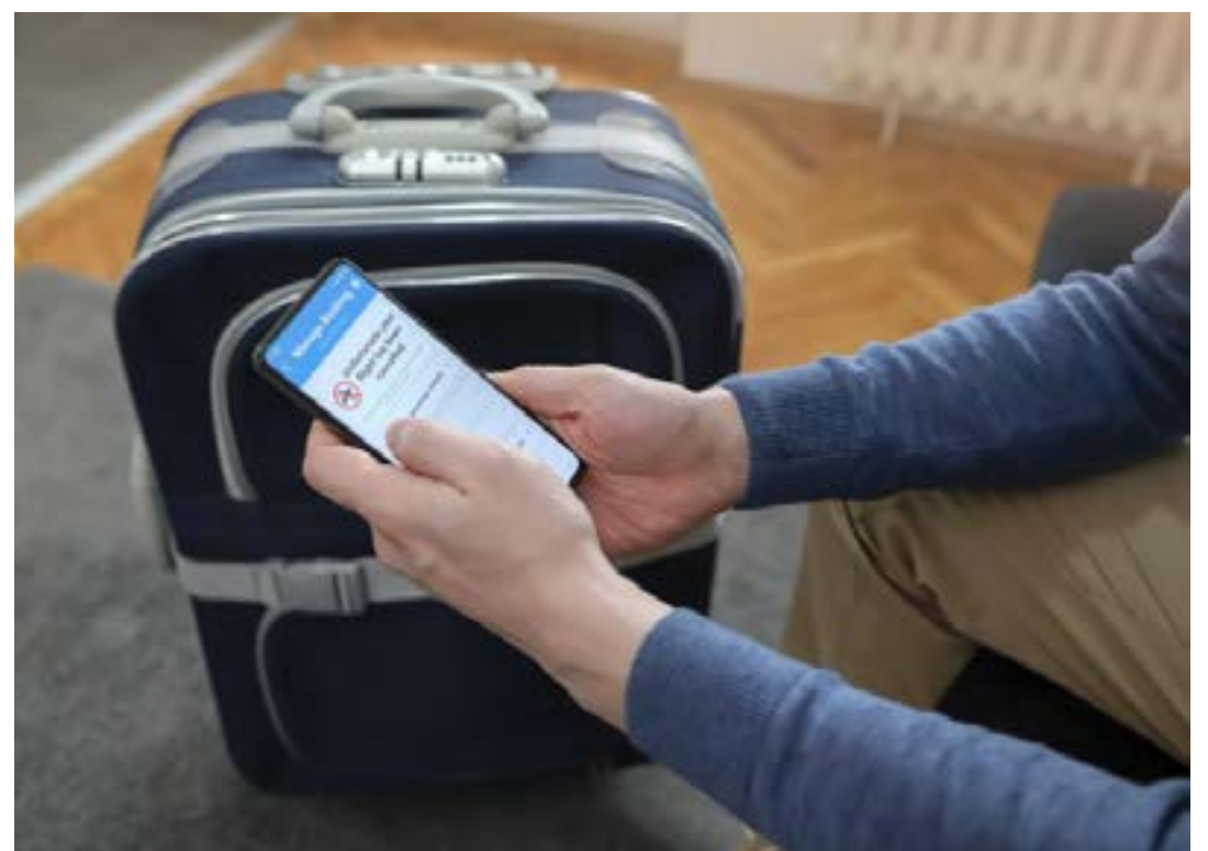
Empresa disse que vai devolver os valores pagos, mas por meio de vouchers

de informações falsas e promessa de rentabilidade alta ou garantida para atrair as vítimas e sustentar o esquema de pirâmide. (Agência Câmara)