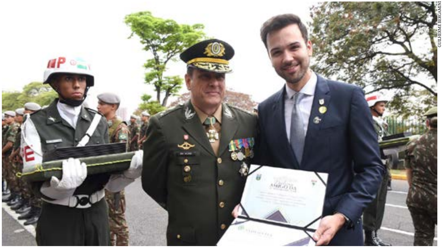
Cerimônia em comemoração ao Dia do Soldado e entrega de Diploma ao presidente da ALMG

Durante seu pronunciamento, o comandante da 4ª Região Militar, general Paulo Alípio Branco Valença, enalteceu a trajetória do Duque de Caxias e destacou características como a justiça, a bravura e a dignidade. O general também sublinhou a contribuição dada pelo Exército ao País, como a preservação de biomas, o acolhimento de estrangeiros e a colaboração com a comunidade internacional, e afirmou que "o legado de Caxias se consubstancia hoje no nosso soldado". (Portal ALMG)