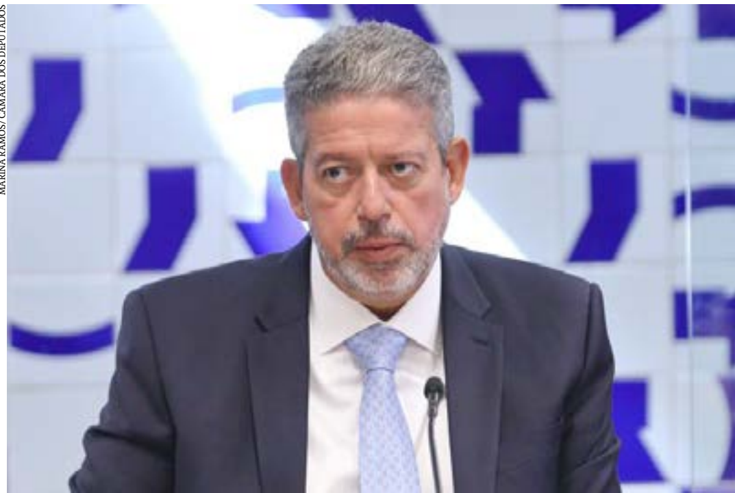
Lira preside a reunião do Colégio de Líderes

O presidente da Câmara dos Deputados, Arthur Lira (PP-AL), confirmou a votação da urgência e do mérito do projeto que prorroga a desoneração da folha de pagamentos para alguns setores da economia (PL 334/23) para a próxima terça-feira. Após reunião de líderes desta quinta-feira (24), Lira também afirmou que a Medida Provisória 1176/23, que institui o Programa Emergencial de Renegociação de Dívidas de Pessoas Físicas Inadimplentes, chamado de "Desenrola Brasil", também entrará na pauta do Plenário na próxima semana.