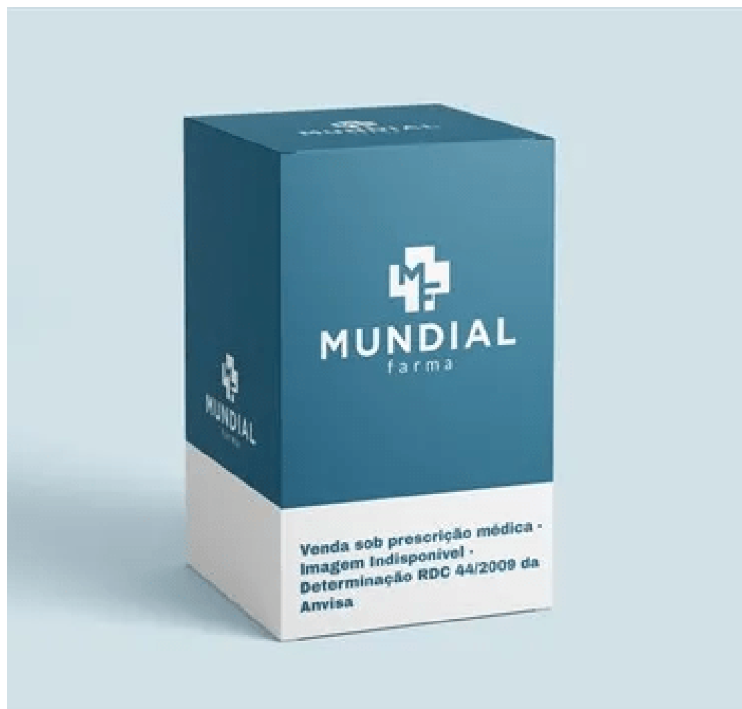
O medicamento Fosfato de Ruxolitibine que irá ajudar no tratamento do paciente

tente. Caso os entes federativos não cumpram a decisão no prazo consignado, proceda-se ao imediato lançamento de bloqueio, via sistema SISBAJUD, em nome de quaisquer dos réus (preferencialmente em desfavor da União e Estado de Minas Gerais, nesta ordem), no valor de R$ 134.040,00, relativo aos dois primeiros ciclos de tratamento. Frutífera a constrição, transfira-se o montante para conta judicial e, incontinenti.