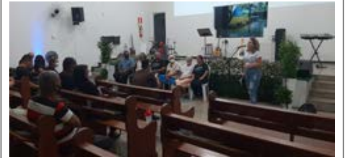
Nesta foto, membros fundadores da igreja que estão à frente recebendo homenagens.

Neste último final de semana a Igreja Batista do bairro Esplanada comemorou os seus 42 anos de existência.