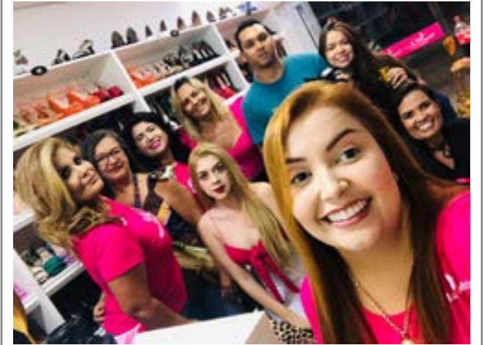
Na Live das maravilhosas do mês de março tiveram vários participantes inclusive esta colunista apesar de não entrar na foto.

Hoje me sinto muito feliz, nesse desafio.