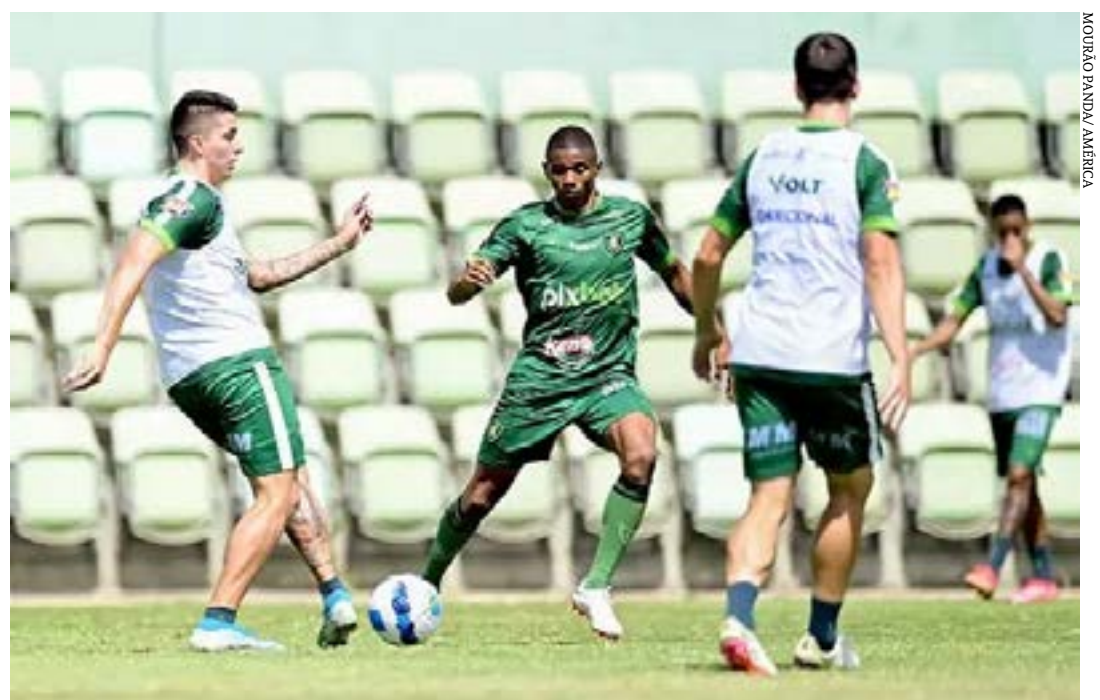
Elenco do América treinou na manhã deste sábado

Preços variam de R$ 130,00 (venda unitária) a R$ 3.800,00 (camarote de oito lugares). ( Superesportes )