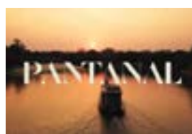
do José Leônico diz que vai desfazer o casamento. Mariana pensa em conversar com Gustavo.

Irma finge não entender o motivo dos ciúmes de Madeleine. Filó reclama da ausência de José Leônico. Madeleine compra roupas para o noivo. Tião e Quim se preocupam com a possibilidade de uma onça estar atacando o rebanho. Chega o dia do casamento. Antero faz um brinde emocionado para José Leônico. Maria e Gil fazem amor. Antero se diverte com as mentiras que contou para os convidados na festa. Madeleine afirma que não vai para o Pantanal e Antero se preocupa quando José Leônico diz que vai desfazer o casamento. Mariana pensa em conversar com Gustavo.