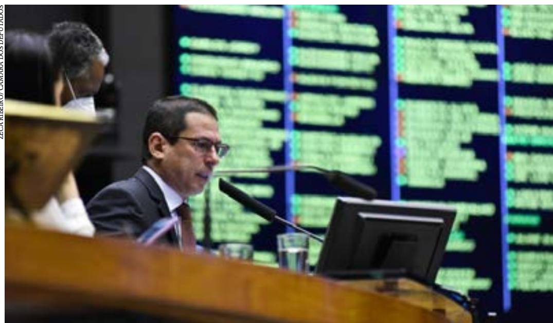
A primeira Sessão Deliberativa da semana será amanhã, às 13h55

Será ampliada também a possibilidade de uso dos benefícios para as pessoas jurídicas optantes pelos lucros presumido e arbitrado e pelo Supersimples. (Agência Câmara)