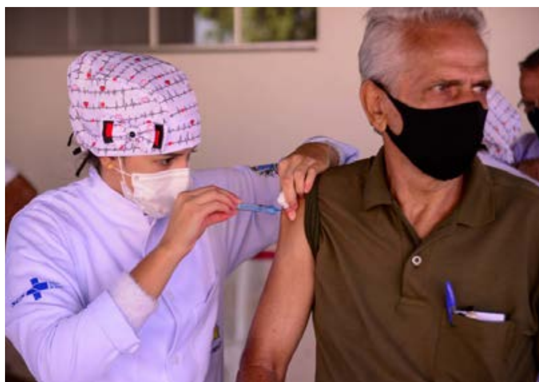
Estarão disponíveis 1 milhão de doses para essa faixa etária