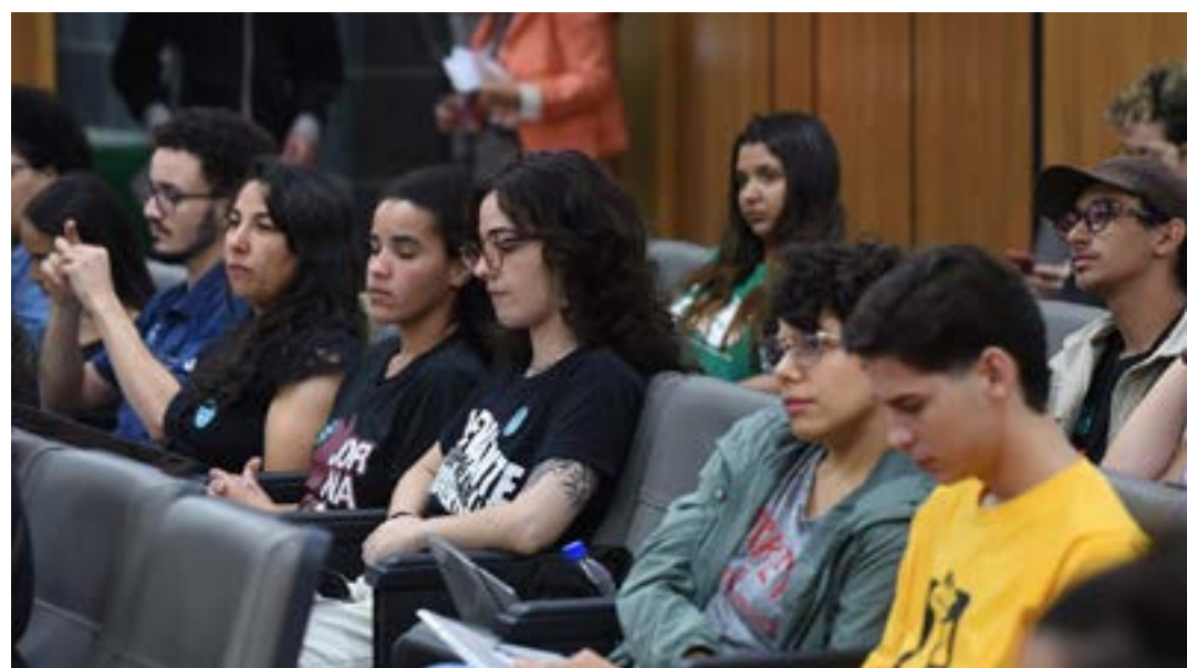
Falta de recursos para alimentação e moradia foi relatada pelos estudantes no debate desta segunda (21)

Ele acrescentou que, com esse levantamento, é importante constituir uma comissão para fazer estudos e, a partir daí, se pensar na aplicação de recursos para essa assistência. (Portal ALMG)