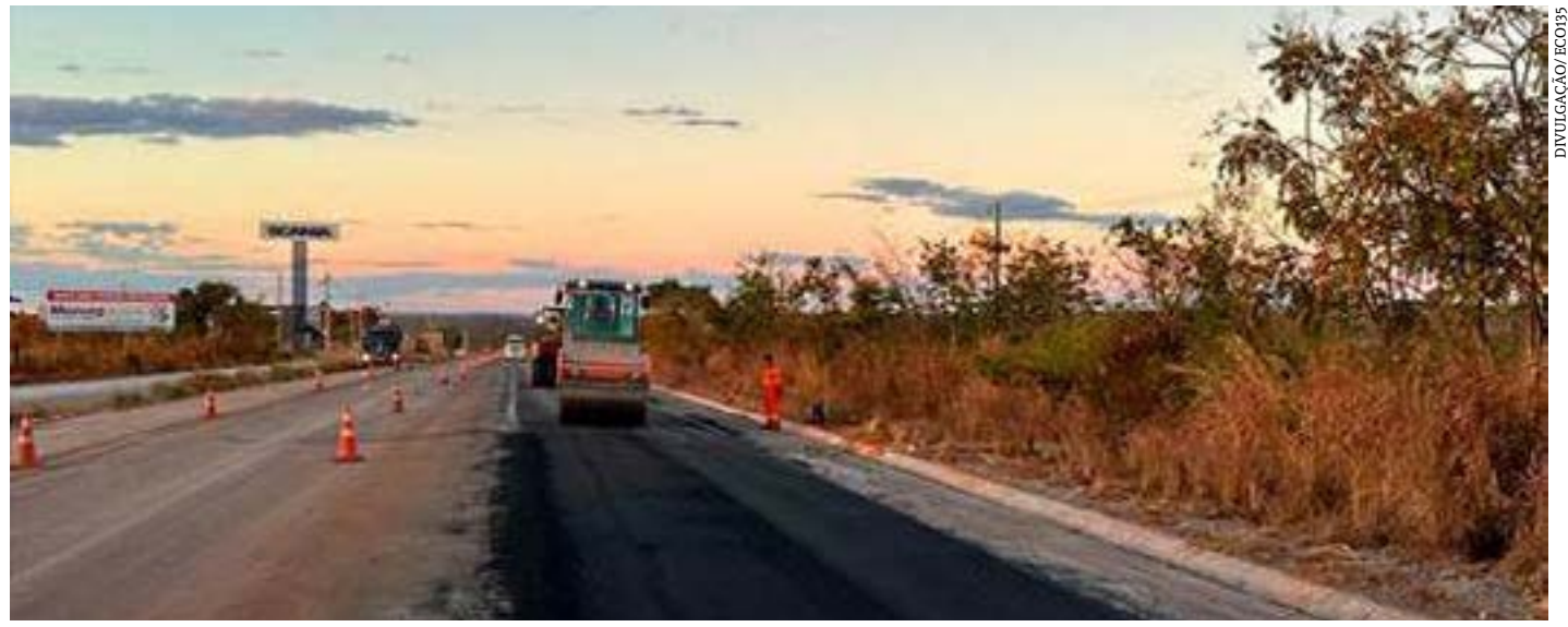
As intervenções fazem parte das obras de implantação e readequação de vias

As consultas sobre as condições de tráfego durante as obras podem ser obtidas pelo telefone: 0800 0135 135. (Com informações da ECO-135)