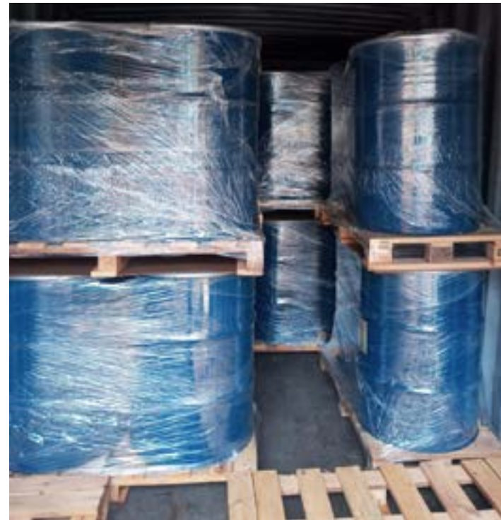
Com essa venda internacional, produtores esperam atingir novos mercados

Produtores rurais de Guaraçama e Bocaiuva exportaram 15 toneladas de mel silvestre orgânico a granel para a Bélgica. Isso ocorreu por meio da Cooperativa de Apicultores do Norte de Minas (Coopemapi) e com apoio do Agro. BR, um projeto da Confederação da Agricultura e Pecuária do Brasil (CNA) com a Agência Brasileira de Promoção de Exportações e Investimentos (Apex-Brasil) que tem a missão de ampliar a pauta exportadora brasileira.