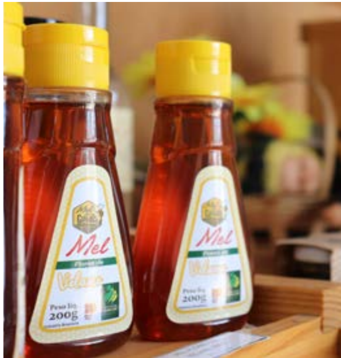
Méis envasados no entreposto da Coopemapi ganharam diversas formulações de produtos agregados