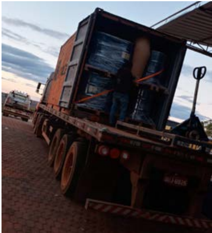
Carregamento foi feito no entreposto do mel, em Bocaiuva