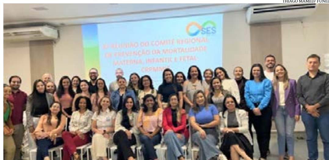
Membros do Comitê Regional de Prevenção à Mortalidade Materna, Infantil e Fetal