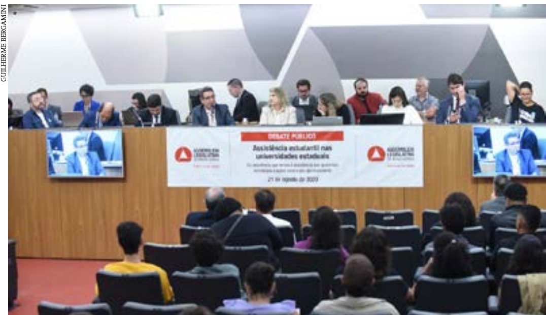
Debate público está sendo realizado ao longo desta segunda (21) pela Comissão de Educação, Ciência e Tecnologia

“O debate mais essencial é como manter os alunos lá. A evasão tem sido grande, tanto nas universidades públicas quanto nas particulares. Concordo que o auxílio por si só seja insuficiente, mas por meio de debates como esse de hoje podemos melhorar”.