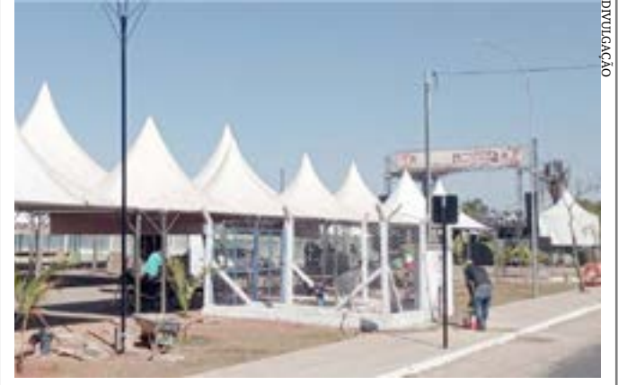
O estacionamento da Praia Popular foi estruturado para a realização do festival em Formiga

Principais destaques dos jornais integrantes da Rede Sindijori MG