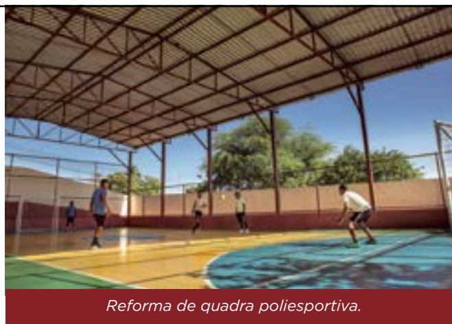
Reforma de quadra poliesportiva.