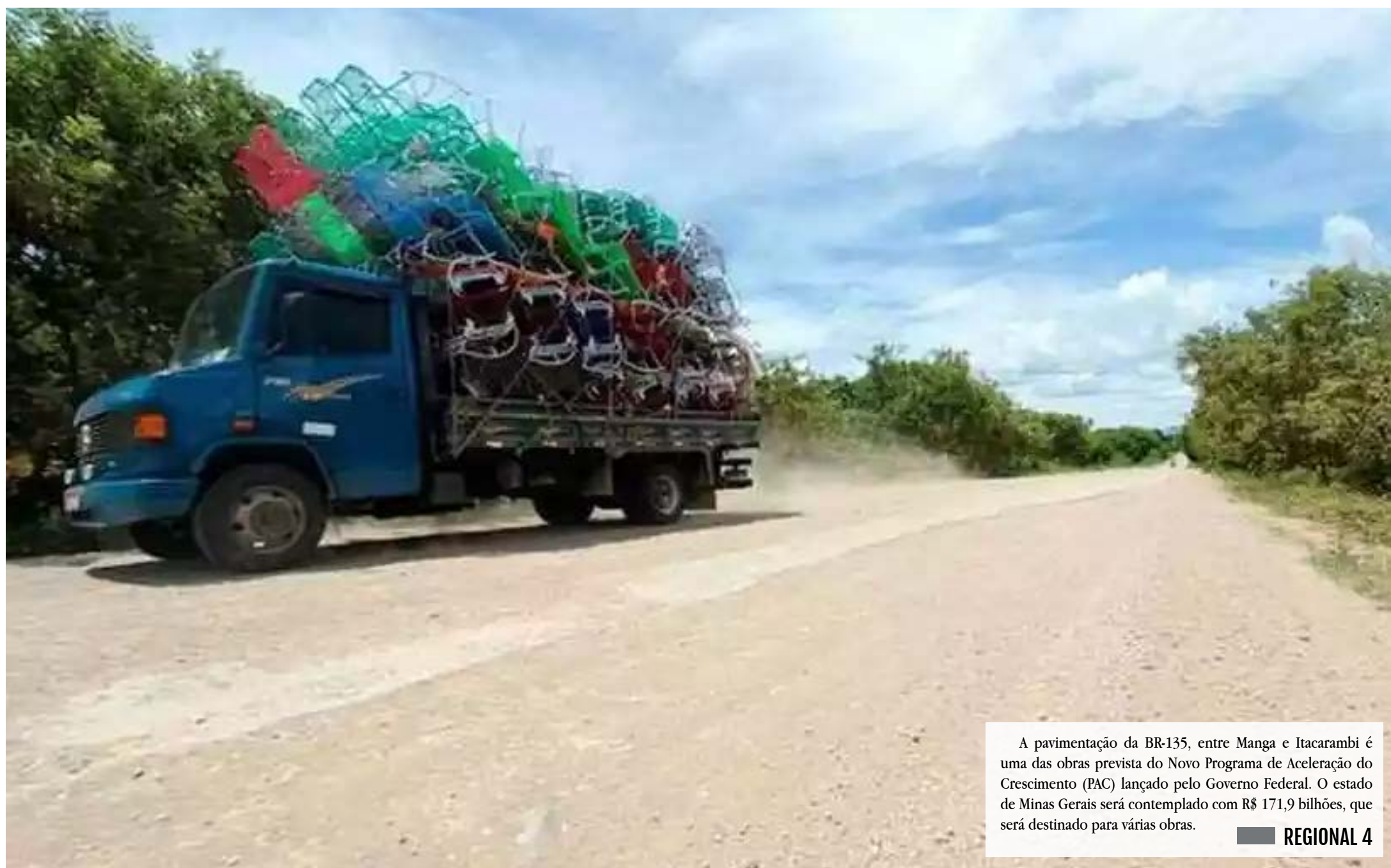
A pavimentação da BR-135, entre Manga e Itacarambi é uma das obras prevista do Novo Programa de Aceleração do Crescimento (PAC) lançado pelo Governo Federal. O estado de Minas Gerais será contemplado com R$ 171,9 bilhões, que será destinado para várias obras. REGIONAL 4