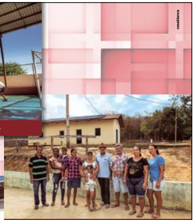
Equipamento de energia solar para comunidades.