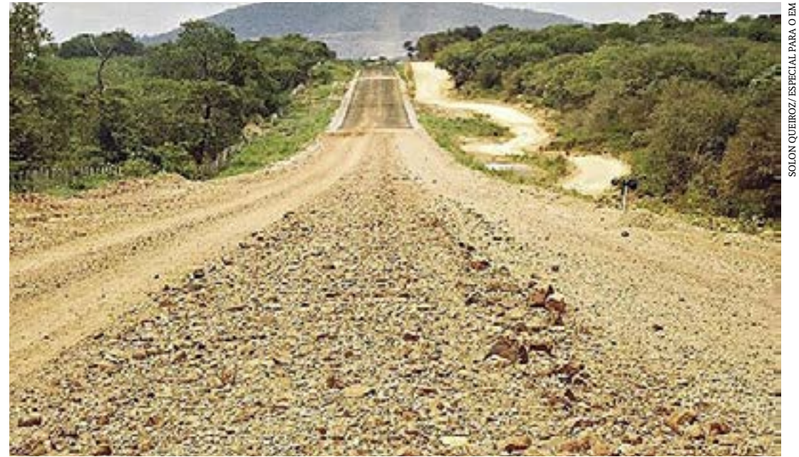
A pavimentação da BR-135, entre Manga e Itacarambi é uma das obras aguardadas pela região

O eixo Transporte Eficiente e Sustentável reúne os investimentos em rodovias, ferrovias, portos, aeroportos e hidrovias em todos os estados do Brasil a fim de reduzir os custos da produção nacional para o mercado