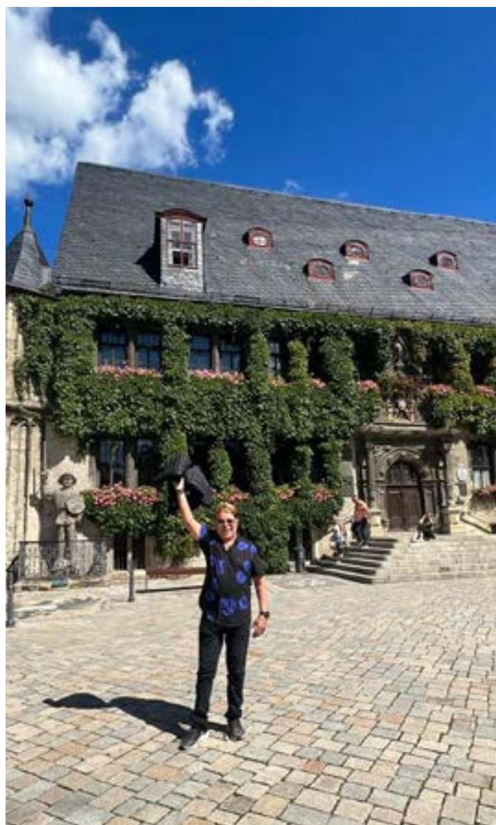
COMEÇANDO a despedir desta viagem fantástica com temporada de 20 dias percorrendo o leste da Europa.