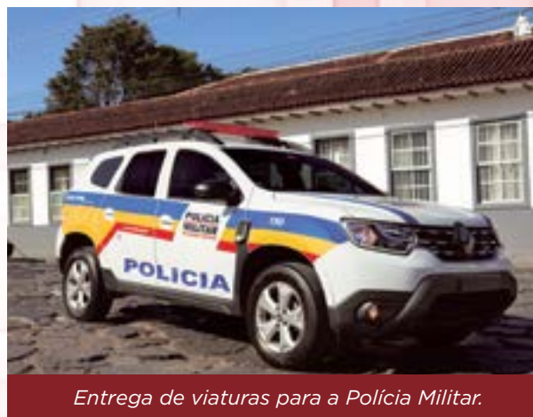
Entrega de viaturas para a Polícia Militar.