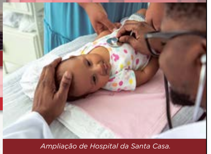
Ampliação de Hospital da Santa Casa.

Os deputados estaduais trabalham por todos os mineiros. Eles escutam as pessoas para conhecer as realidades do estado e levam resultados reais para todo canto de Minas.