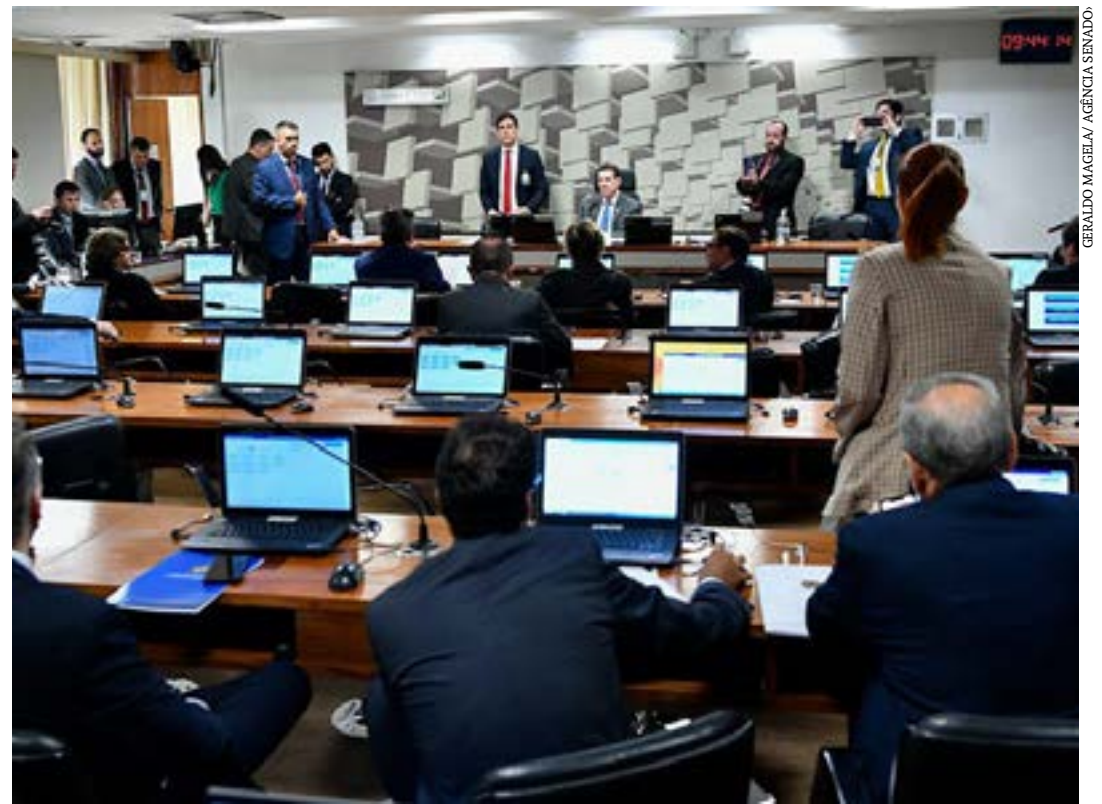
O ciclo de debates deve explorar cinco grandes tópicos, entre eles, simplificação e desburocratização tributárias