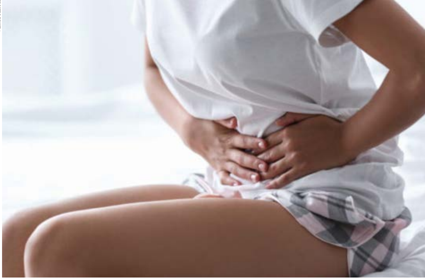
PROJETO DE VIDA