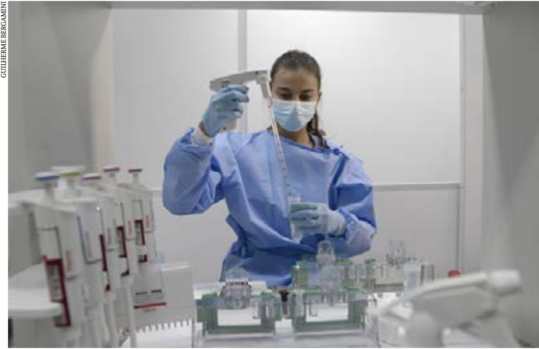
Em 2021, a Comissão de Educação, Ciência e Tecnologia visitou o CT/Vacinas da UFMG

A Calixcoca, que promete tratar a dependência em cocaína e crack, será tema de debate na Comissão de Educação