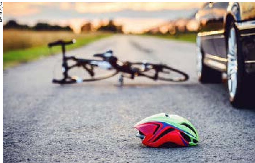
Ombro é uma das principais partes lesionadas em quedas de bicicleta, explica SBCOC

Em 19 de agosto, celebra-se o Dia do Ciclista, data criada com o intuito de reforçar o respeito a esse público. O dia é uma homenagem ao ciclista Pedro Davison, que morreu em 19 de agosto de 2006, em Brasília, depois de ser atropelado por um motorista que dirigia em alta velocidade e embriagado. E as estatísticas de acidentes envolvendo ciclistas são alarmantes. De acordo com o DataSUS, de janeiro a junho deste ano, o Sistema Único de Saúde contabilizou 7.296 internações de ciclistas, uma média de 40 registros por dia. No mesmo período, 152 pessoas perderam a vida.