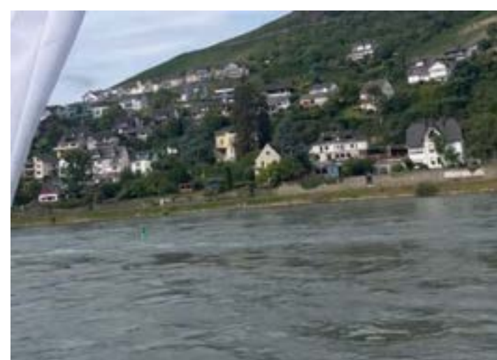
FOTOGRAFANDO as margens do famoso rio Neno