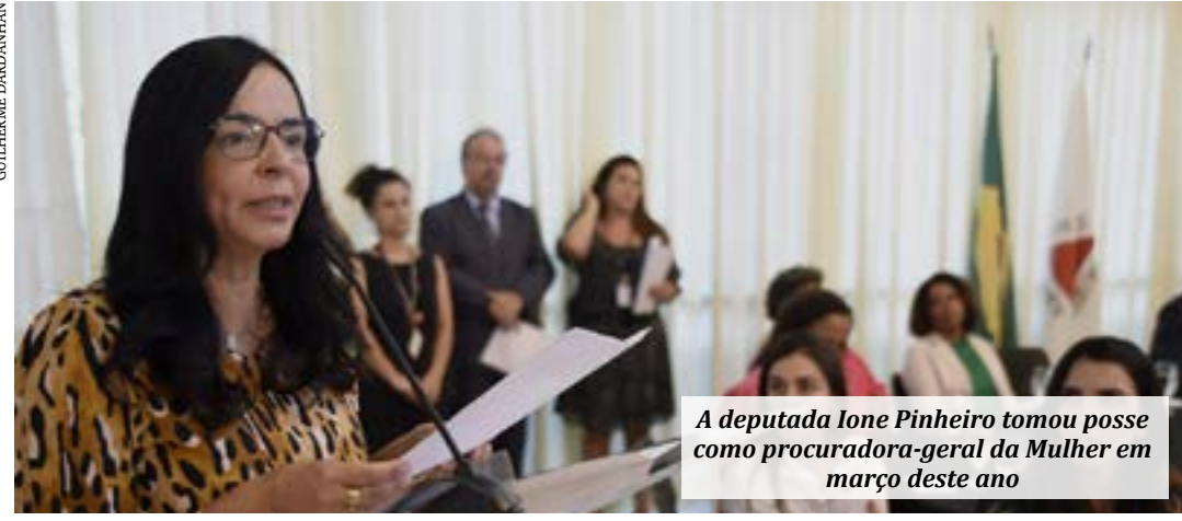
A deputada Ione Pinheiro tomou posse como procuradora-geral da Mulher em março deste ano

A Procuradoria da Mulher da Assembleia Legislativa de Minas Gerais (ALMG) inicia nesta terça-feira (8) mais uma série de encontros para debater políticas públicas, ações e programas voltados para a equidade de gênero e para o enfrentamento das violências contra a mulher. O evento começa às 14 horas, no Auditório do andar SE.