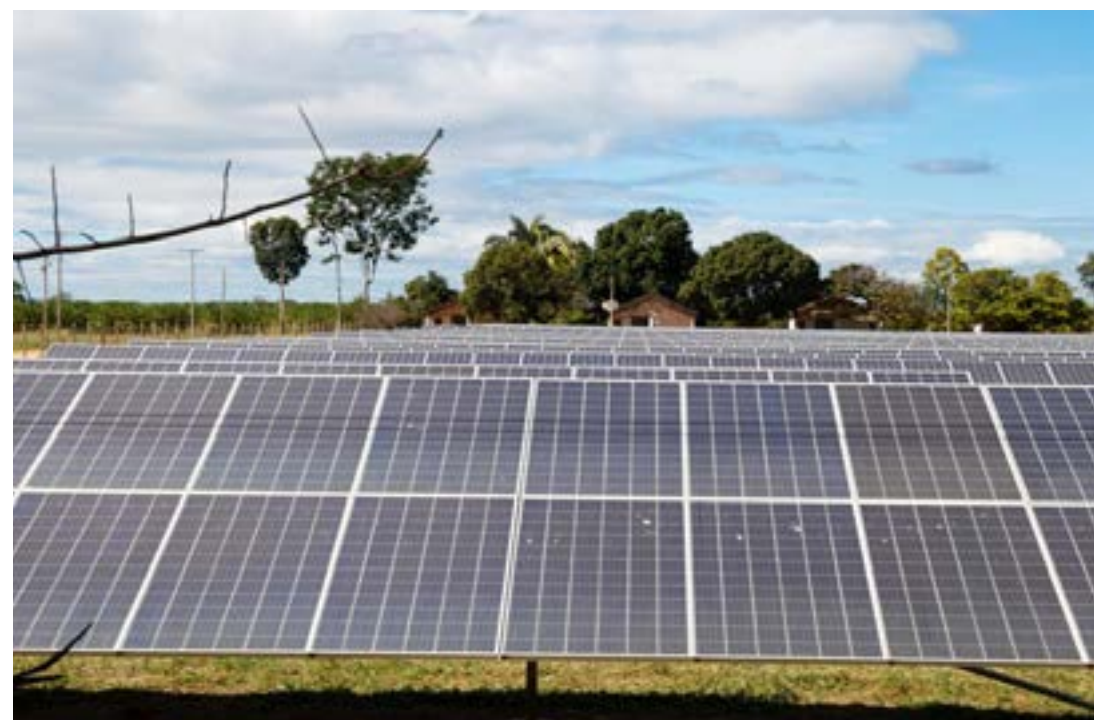
Cemig, Epamig e CPQD viabilizam proposta inédita que desenvolverá metodologias para a produção de alimentos e energia elétrica em um mesmo local

A implantação destes pilotos vai permitir a utilização, em uma mesma área, para produção conjunta de energia