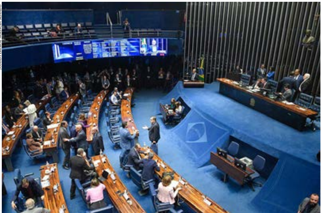
Na sessão do dia 2, senadores já haviam aprovado nomes, e retomam nesta terça a análise das indicações pendentes