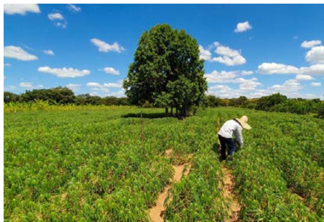
Na safra 2022/2023, Estado investiu mais de R$ 5 milhões no programa, que garante renda mínima aos agricultores familiares do semiárido mineiro que sofrem perdas nas lavouras por dificuldades climáticas

terações do Cadastro da Agricultura Familiar – Marcos Vinicius Dias Nunes / diretor de Política Agrícola e Cooperativismo - Fetaemg