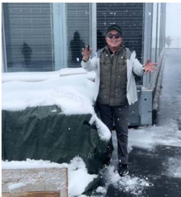
ME SENTINDO uma criança brincando com o gelo nos Alpes Suíço. Viva a vida!