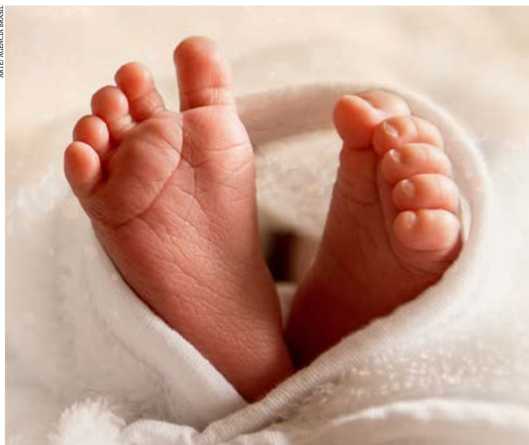
Esta doença pode ser detectada pelo teste do Teste do Pezinho

A terceira medicação é a terapia gênica (Zolgensma). A Comissão Nacional de Incorporação de Tecnologias no Sistema Único de Saúde (Conitec) já deu parecer favorável, mas o medicamento não foi ainda incorporado pelo guia PCDT (Protocolos Clínicos e Diretrizes Terapêuticas). Essa terapia foi liberada para crianças até seis meses de idade. "Mas se a gente não consegue diagnosticar precocemente, não vai conseguir tratá-las com essa terapia", ressaltou a médica. (Agência Brasil)