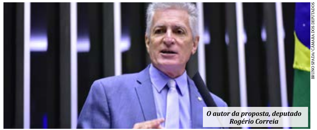
O autor da proposta, deputado Rogério Correia

O projeto de lei tramita apenas a outras propostas que tratam da destinação de recursos oriundos do combate à corrupção (PLs 3394/15 e 906/19). Após a análise das comissões permanentes, os textos deverão seguir para o Plenário. (Agência Câmara)