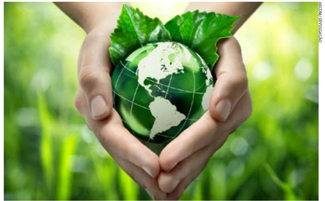
Parceria entre Sebrae Minas e Consórcio União leva capacitação para educadores de 15 cidades

11h – Paineis: 3: Novas tecnologias e valorização dos resíduos - Revisão dos conceitos ligados ao lixo, sua geração, compo-