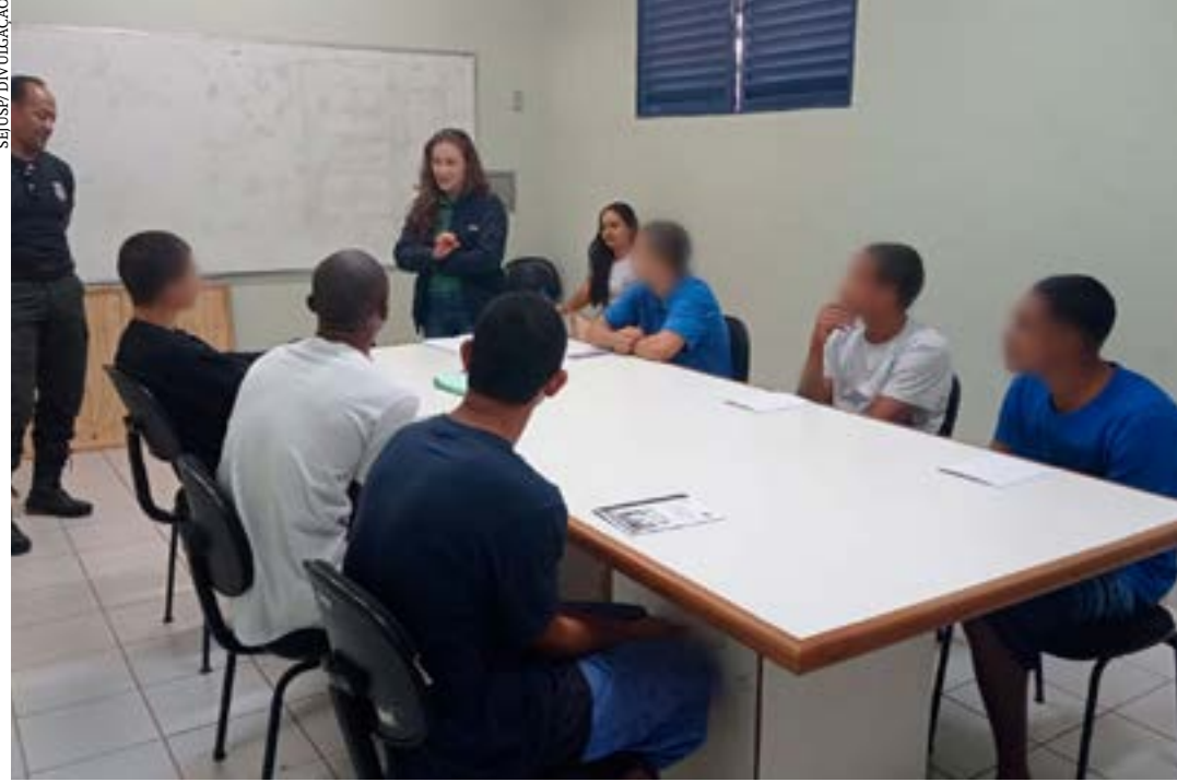
Capacitação começou nesta semana e vai atingir 950 adolescentes; intenção é ressignificar o futuro dos adolescentes quando deixarem a internação

Adolescentes de todas as 41 unidades socioeducativas do estado passarão por cursos de pré-qualificação profissional, para preparação para o mercado de trabalho. A nova capacitação tem a missão de ressignificar o futuro para esses jovens, instigando-os na criação de projetos de vida e na realização de sonhos. Parte das 950 vagas previstas para a capacitação já começaram a ser preenchidas nesta semana, com atividades iniciadas em várias unidades do estado.