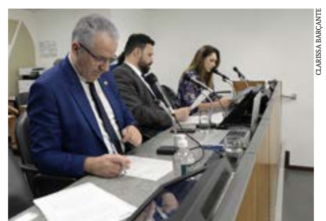
Propostas foram analisadas em reunião da Comissão de Agropecuária e Agroindústria

São ainda descritas as finalidades dos consórcios, como: fomentar o desenvolvimento rural sustentável; promover a ampliação de mercados e do comércio de produtos agrícolas e agroindustriais; e estimular a geração de emprego e renda desse setor e a valorização do trabalhador rural. (Portal ALMG)