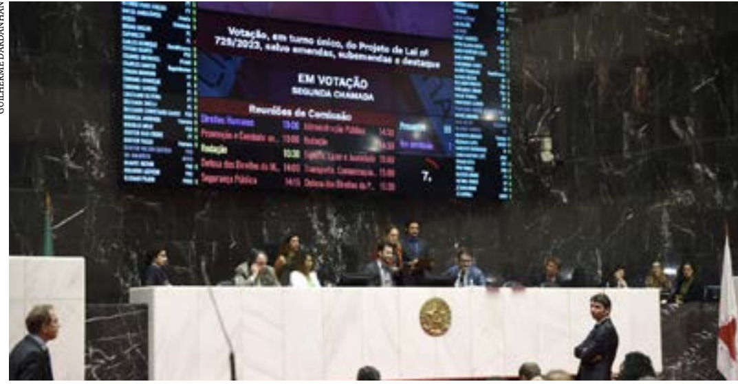
Projeto da LDO tramitou em turno único e foi aprovado pelo Plenário em 11 de julho

Foi sancionada pelo governador Romeu Zema (Novo) e publicada na edição do Minas Gerais dessa quinta-feira (3) a Lei de Diretrizes Orçamentárias (LDO), que vai nortear a elaboração do orçamento estadual de 2024.