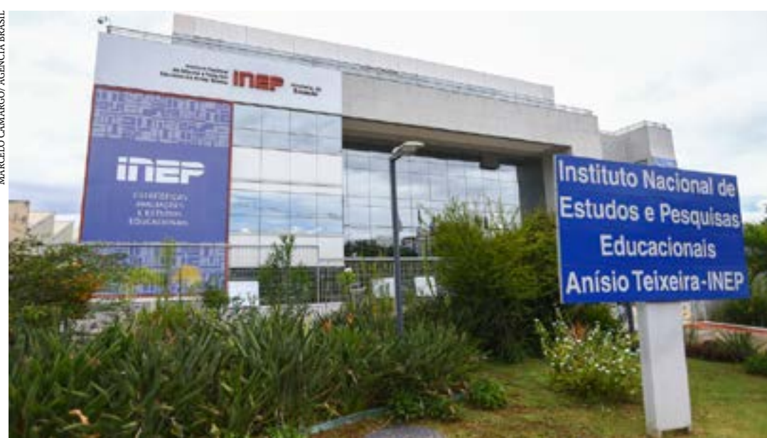
Portaria explica cálculos e traz calendário com etapas do processo

Os resultados finais do Conceito Enade e do IDD deverão ser divulgados no dia 10 de setembro e do CPC e os do IGC, em 15 de dezembro. (Agência Brasil)