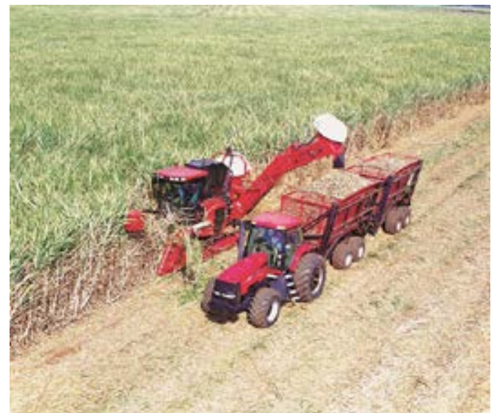
Setor sucroenergético produz combustível mais limpo e renovável, gera cerca de 180 mil empregos em Minas Gerais