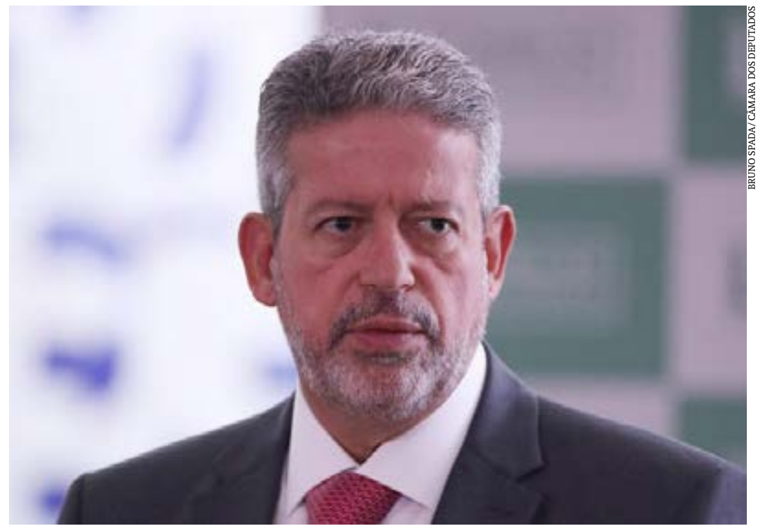
Presidente Lira diz que deputados vão avaliar se manterão as mudanças dos senadores

Após a reunião, o líder do PT, Zeca Dirceu (PR), adiantou que a pauta da próxima semana é extensa e inclui o projeto que prorroga a Lei de Cotas e propostas de interesse dos alunos, já que em 11 de agosto comemora-se o dia do estudante. (Agência Câmara)