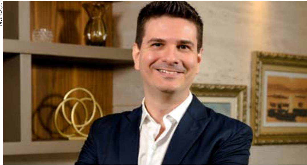
O especialista destaca busca qualificada e assertiva são fundamentais para a continuidade de negócios em família