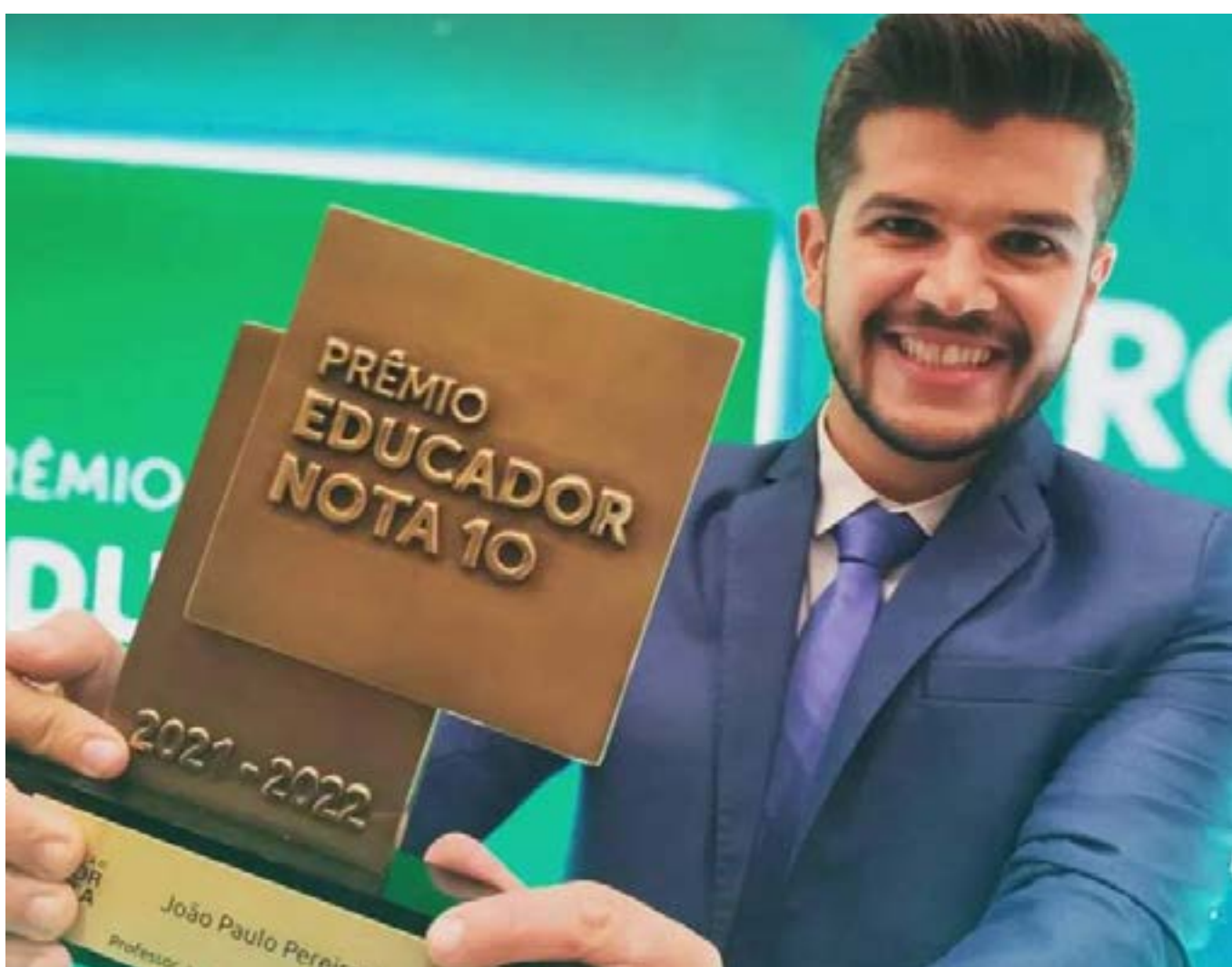
Edição de 2023 vai trazer um olhar sobre os Objetivos de Desenvolvimento Sustentável (ODS)

O Prêmio Educador Nota 10 foi criado em 1998 pela Fundação Victor Civita e, em suas 24 edições anteriores, reuniu mais de 82 mil projetos e premiou 261 educadores, com R$ 3,2 milhões de reais distribuídos em premiações, ao longo destas edições. A 25ª edição terá a união entre o Instituto Somos e a Fundação Victor Civita, na realização da honraria, para uma edição totalmente nova. (Ascom SEE-MG)