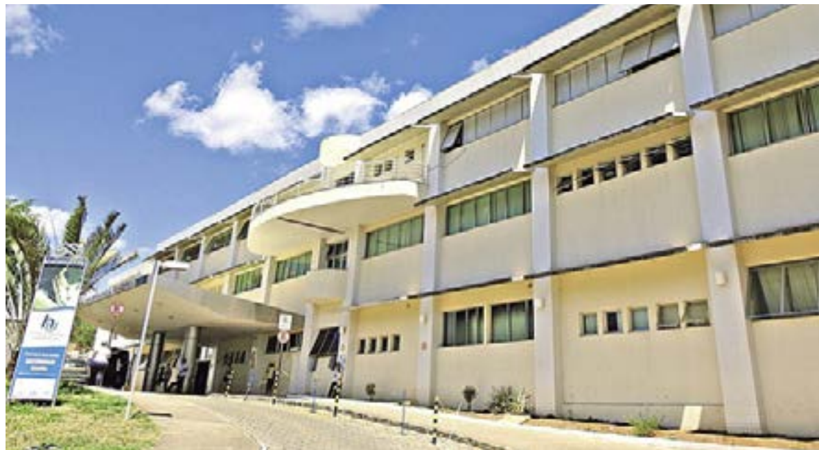
A Maternidade Maria Barbosa do Hospital Universitário Clemente de Faria (HUCF), vinculado à Universidade Estadual de Montes Claros (Unimontes), realizará durante este mês a campanha em conscientização e incentivo à amamentação das crianças e direitos de mães e pais trabalhadores, em comemoração ao 'Agosto Dourado'.