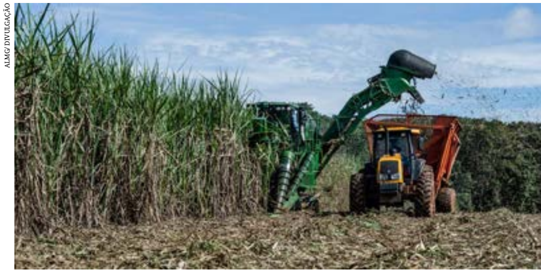
Demandas do setor sucroenergético serão apresentadas em evento nesta quarta-feira