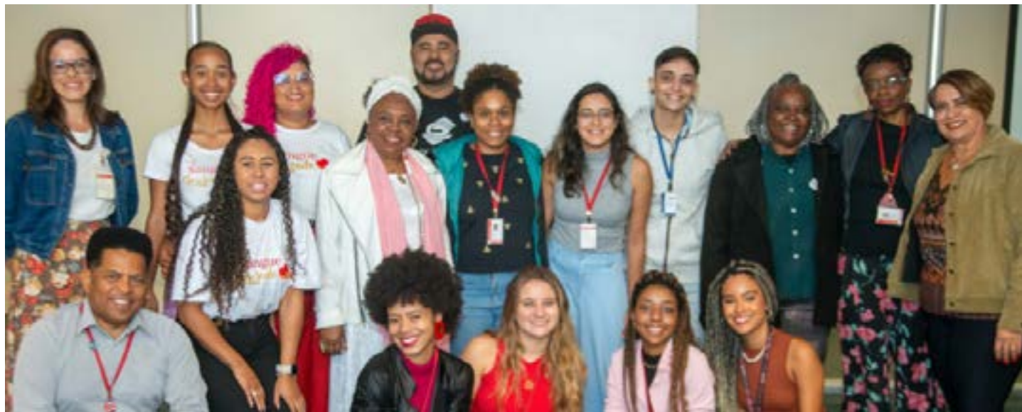
Comitê temático atualizou Plano Operativo da Política Estadual, que visa garantir acesso igualitário e universal a esse público

Durante a reunião, além da apresentação da Política Estadual de Promoção à Saúde (POEPS), incluindo o Indicador 6, que tem várias ações que visam a melhoria da qualidade da assistência à saúde