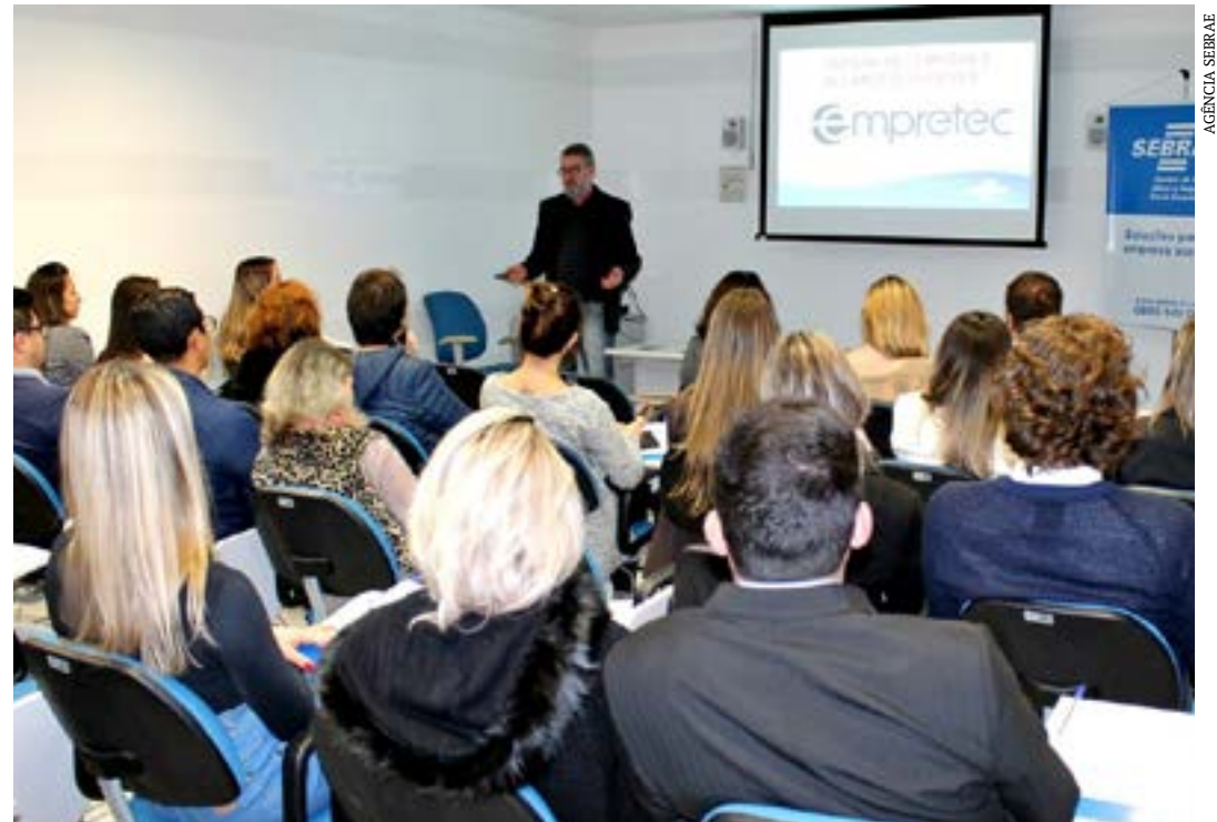
Evento promovido pelo Sebrae Minas tem entrada gratuita e é voltado para os empreendedores que já concluíram o seminário Empretec

Segundo dados do Sebrae, 67% dos empresários que participaram do Empretec aumentaram o faturamento de suas empresas e 75% declararam ter obtido aumento da renda mensal. A taxa de mortalidade entre empresas que passaram pelo treinamento é de apenas 7%, enquanto a média brasileira é de 46%. Para saber mais, acesse o site do Empretec. (Agência Sebrae)