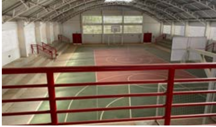
A obra do complexo foi paralisada em 2018 e a retomada será nos próximos meses