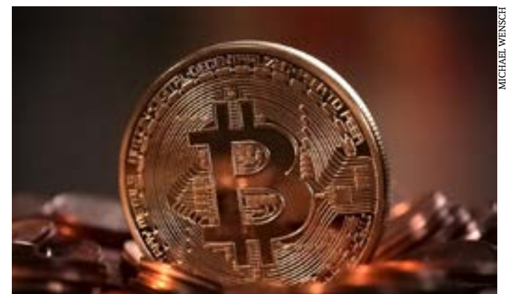
Durante segundo semestre, sociedade poderá apresentar sugestões

No fim do ano passado, a Lei 14.478 trouxe diretrizes para a prestação de serviços de ativos virtuais no país. Em junho, o Decreto 11.563 estabeleceu o Banco Central como o órgão competente para regular o setor. (Agência Brasil)