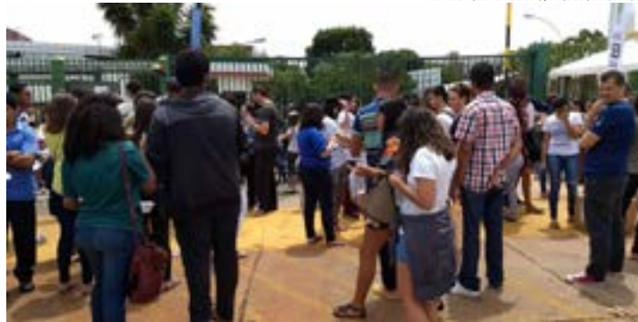
Resultado está disponível no Portal Único do MEC