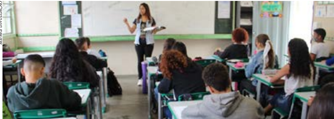
Serão ocupadas vagas de professores e especialistas em educação básica para atuar em 128 municípios

O Governo de Minas Gerais, por meio da Secretaria de Estado de Educação de Minas Gerais (SEE/MG), publicou mais um lote com mil nomeações de excedentes do concurso público realizado em 2017. O terceiro lote deste ano, referente aos excedentes aprovados segundo o Edital nº 7/2017, foi divulgado nesta terça-feira (18/7), a