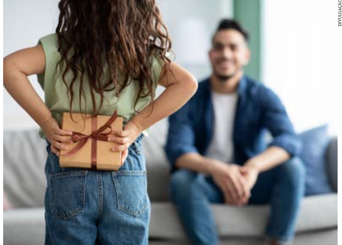
Uso das redes sociais já desbanca a propaganda como ação de marketing

próprio (15,0%), aplicativos de entrega (5,6%), Facebook (3,7%), e seguido pelos marketplaces (3,7%). (Ascom Fecomércio MG)