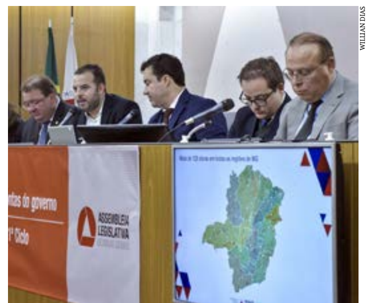
Deputados durante a reunião de prestação de contas com a Secretaria de Estado de Infraestrutura e Mobilidade

Esta linha de diálogo e independência foi anunciada pelo presidente Tadeu Martins Leite (MDB) já durante a cerimônia de posse da atual Mesa da ALMG. “Não são os homens, mas são as ideias que brigam, como nos ensinou Tancredo Neves”, lembrou o presidente.