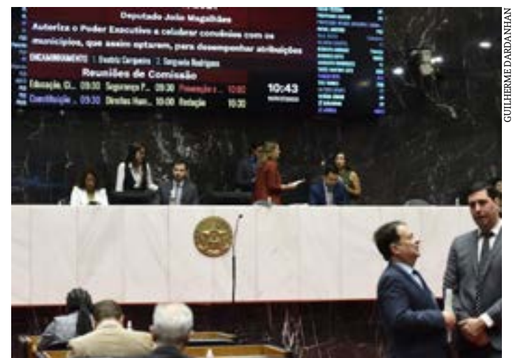
Projeto que deu origem à lei sobre o IPVA foi votado em Plenário no dia 11 de julho

ativamente a janeiro deste ano, tendo em vista a atualização do piso nacional do magistério. ( Portal ALMG )