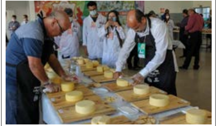
Entre as novidades do evento, a mostra diversos queijos no Minas Láctea, em Juiz de Fora

Principais destaques dos jornais integrantes da Rede Sindijori MG