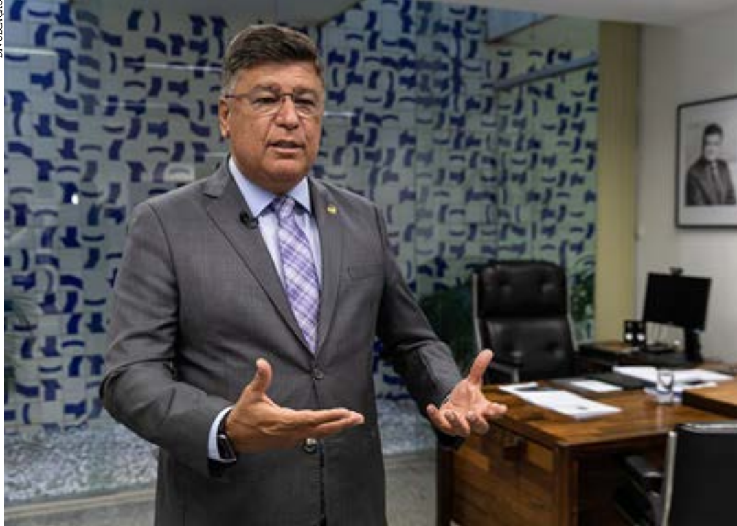
O senador Carlos Viana é o autor do projeto

“Sabemos que há uma proporção enorme de pessoas habilitadas a adotar. Porém, as restrições relacionadas a idade, cor, condição física pesam de tal maneira que jogam as estatísticas da adoção para baixo. Preconceitos de toda ordem disseminam-se pelo nosso tecido social. Mas políticas públicas de reparação das injustiças e da desigualdade servem de contrapeso”, disse o senador durante a entrega da primeira edição do prêmio, em 2022 ( Agência Senado )