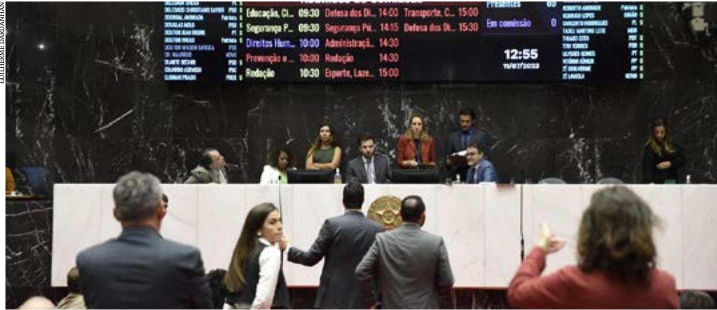
O projeto da LDO foi votado na Reunião Extraordinária de Plenário realizada na manhã desta terça-feira (11)

O reajuste é previsto no PL 822/23, do governador, que aumenta em 12,84% os salários dos profissionais da educação básica, retroativamente a janeiro deste ano, tendo em vista a atualização do piso nacional do magistério. (Portal ALMG)