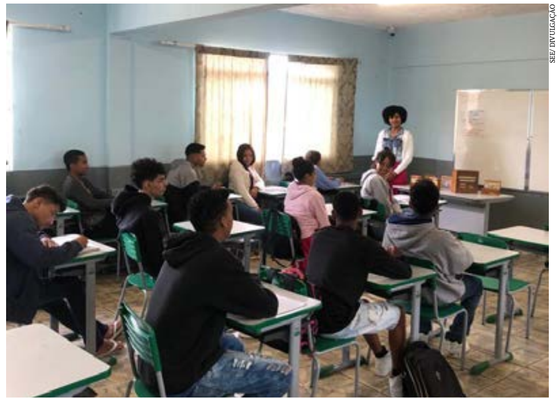
Projeto de aprendizagem realizado nas escolas é direcionado a crianças e adolescentes de todo o estado; novas turmas começam em 1/8

O professor planeja as aulas do reforço escolar utilizando metodologias diferenciadas com o objetivo de serem trabalhadas com os estudantes que não consolidaram as