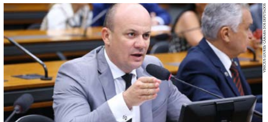
Silva: "Integrantes das forças de segurança precisam estar em constante aperfeiçoamento"

A proposta será analisada em caráter conclusivo pelas comissões de Segurança Pública e Combate ao Crime Organizado; de Educação; e de Constituição e Justiça e de Cidadania. (Agência Câmara)