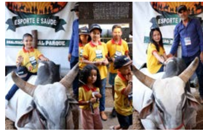
Victor Oliveira Solidário e Sicoob Credinor: Crianças do Projeto JABS ganham um domingo de diversão na Expomontes

No domingo (9), 33 crianças assistidas pelo programa social Projeto JABS – Jovem e Adolescente em Busca de Superação – participaram do encerramento da 49ª Expomontes no Parque de Exposições João Alencar Athayde, em um momento de diversão e descontração.