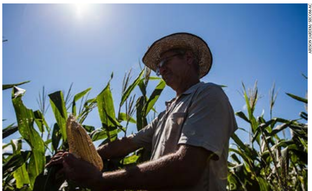
O Pronater executa a Política de Assistência Técnica e Extensão para Agricultura Familiar e Reforma Agrária

Entre os objetivos da Pronater, estão: promover o desenvolvimento rural sustentável; apoiar iniciativas que promovam as potencialidades e vocações regionais e locais; aumentar a produção, a qualidade e a produtividade, inclusive de atividades agroextrativistas, florestais e artesanais; construir sistemas de produção sustentáveis a partir do conhecimento científico, empírico e tradicional; apoiar o associativismo e o cooperativismo, bem como a formação de agentes de assistência técnica e extensão rural; além de contribuir para a expansão do aprendizado e da qualificação profissional. (Agência Senado)