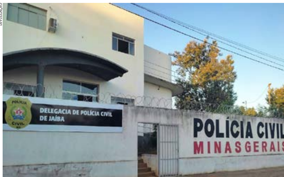
A Polícia Civil investiga o caso

Cinco pessoas, entre elas uma criança, de 9 anos, foram baleadas em um bar em Jaíba, na noite desse domingo (9).