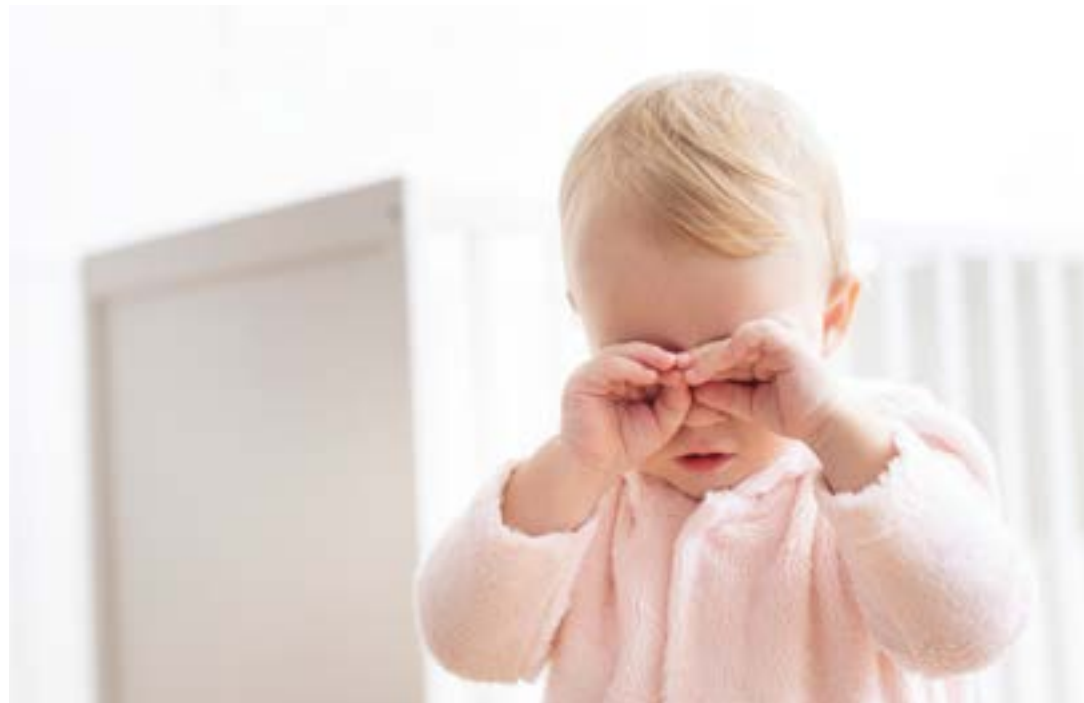
Especialista destaca ainda a importância do teste do olhinho para o diagnóstico precoce de doenças

“Vale lembrar que o sistema visual da criança ainda é imaturo e o tratamento precoce é essencial para o seu correto desenvolvimento. O Teste do Olhinho Ampliado é um exame rápido, indolor e de grande importância para a saúde ocular dos bebês”, finaliza.