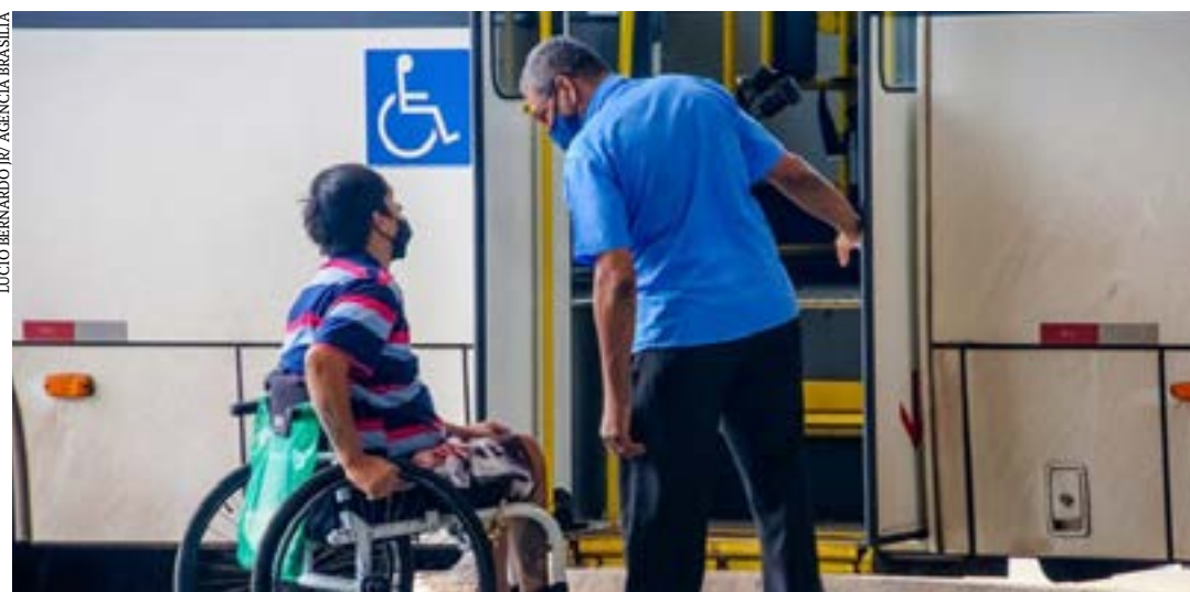
A acessibilidade é um dos itens a serem observados nos planos de mobilidade

O presidente Luiz Inácio Lula da Silva enviou ao Congresso Nacional a Medida Provisória 1179/23, que estende o prazo para os municípios elaborarem seus Planos de Mobilidade Urbana. A MP foi publicada em edição extra do Diário Oficial da União (DOU) de sexta-feira (7).