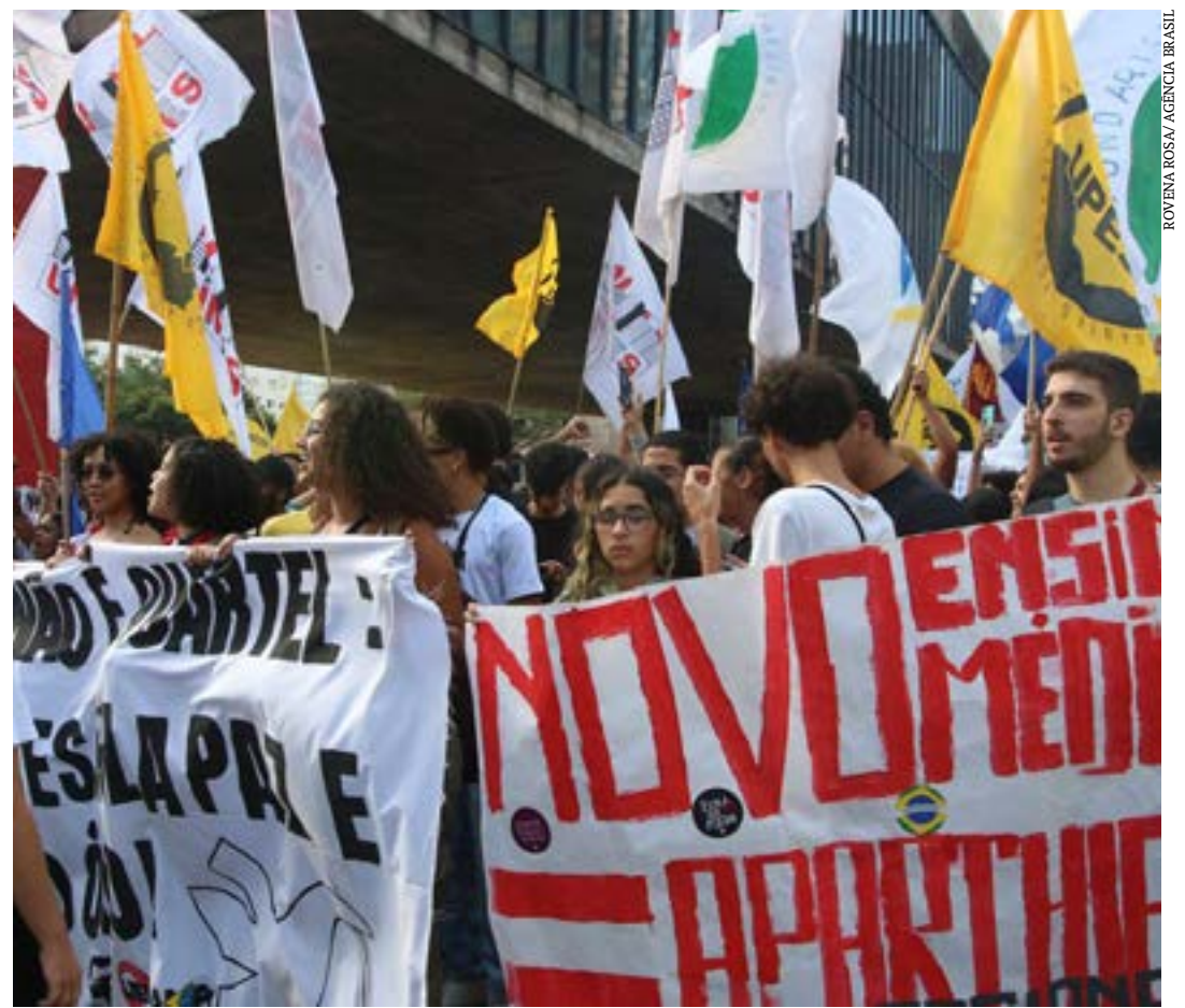
Ministro fez balanço de processo para ouvir comunidade escolar

A revogação do Novo Ensino Médio tem sido uma reivindicação de entidades do setor e de muitos especialistas. Apesar disso, o governo federal não cogitou revogar a medida por completo, mas fazer ajustes a partir dos resultados obtidos na consulta. (Agência Brasil)