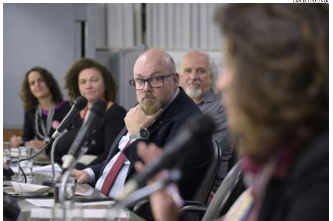
O presidente da Comissão de Cultura, deputado Professor Cleiton, defende uma análise minuciosa do projeto do “Descentra Cultura Minas Gerais” antes da aprovação

Dessa forma, com as alterações propostas pelo PL 2.976/21, o Executivo espera aumentar para 150 os municípios contemplados com recursos da Lei de Incentivo à Cultura. Quanto aos recursos do FEC, a meta é beneficiar 400 municípios em um primeiro momento.