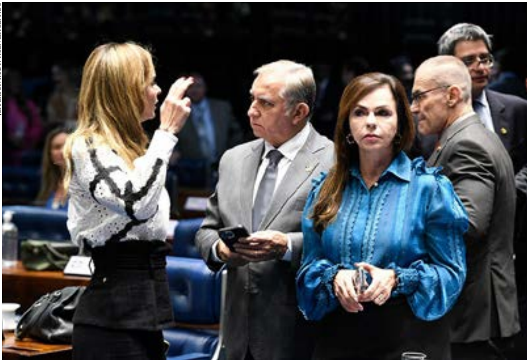
A senadora Professora Dorinha Seabra (à dir.) é relatora de projeto que cria o programa Escola em Tempo Integral

O Plenário do Senado deve votar cinco projetos da área da educação na terça-feira (11), a partir das 14h. Na pauta, está o PL 2.617/2023, que cria o programa Escola em Tempo Integral para fomentar a abertura de novas matrículas na educação básica com carga horária estendida. O projeto prevê cerca de R$ 2 bilhões em assistência financeira para 2023 e 2024.