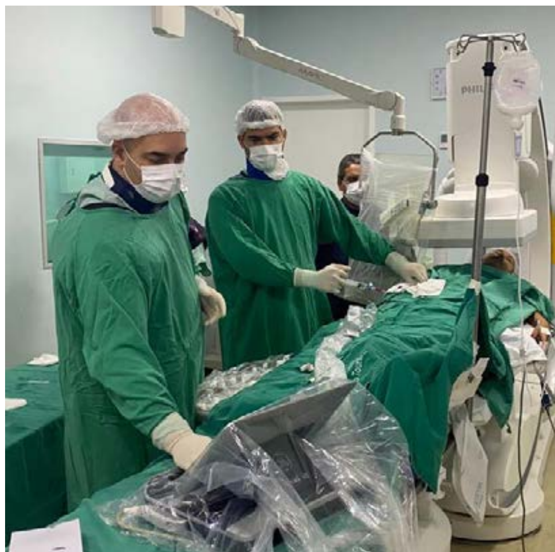
PREFEITURA DE JUNDIAÍ