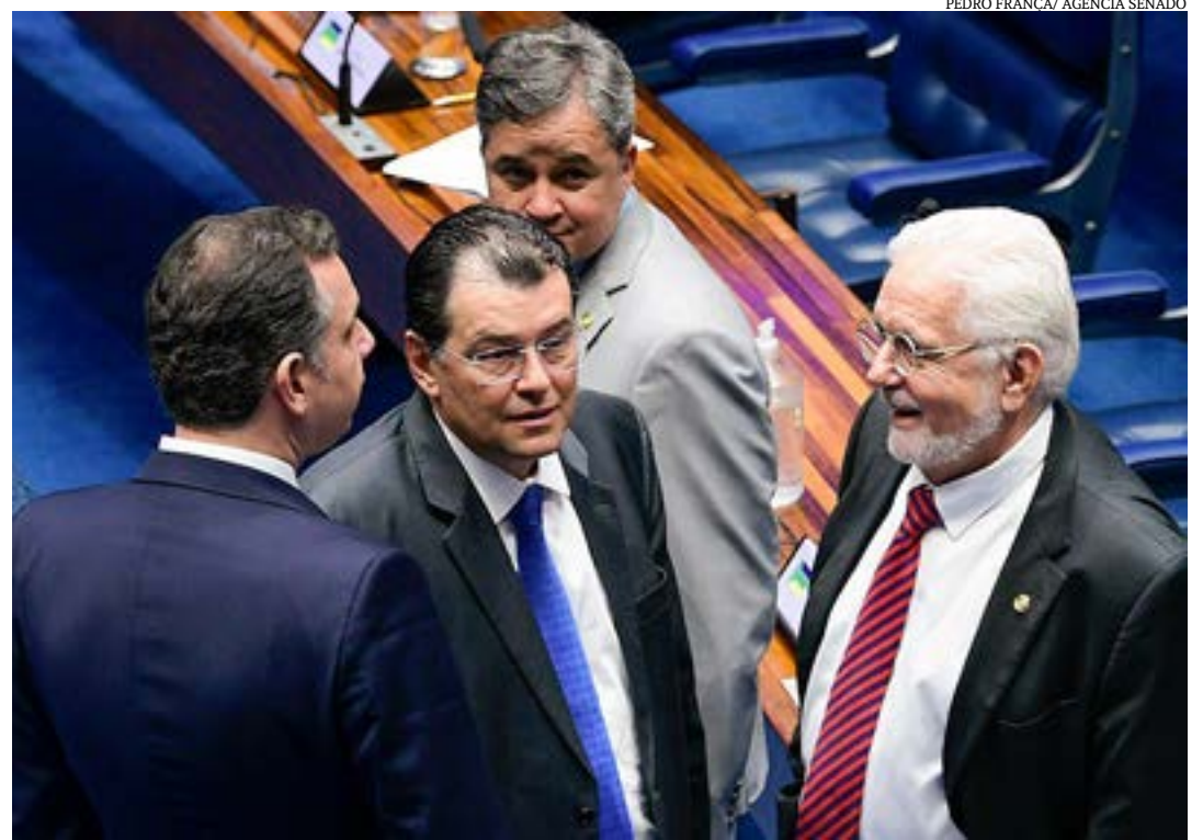
Pacheco, Eduardo Braga e Jaques Wagner participam das negociações sobre os decretos do Executivo que regulamentam o marco do saneamento

Ele explicou que já há um esboço do texto e que o governo ainda pode fazer alterações depois das observações feitas no Senado.