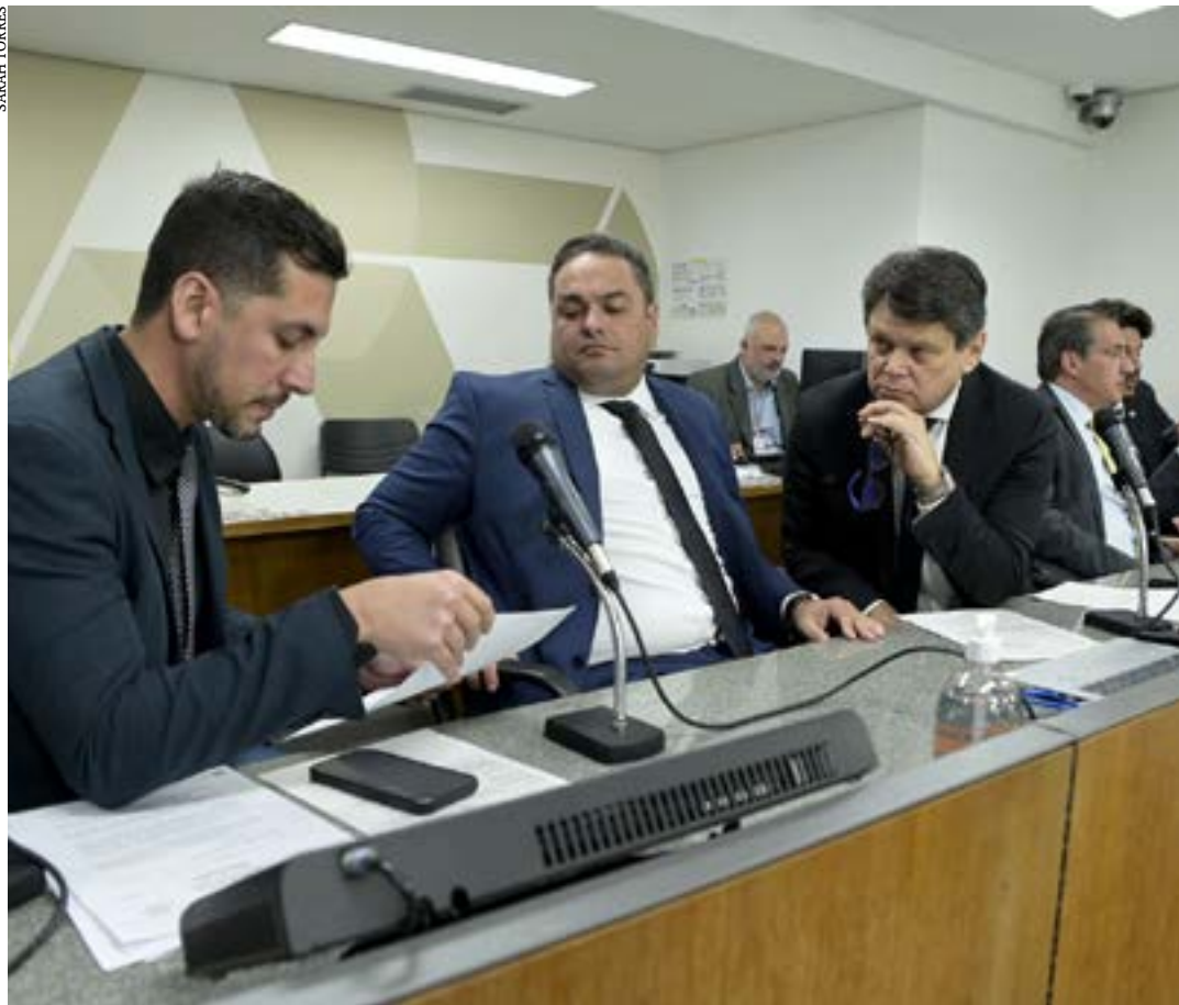
Parlamentares aprovaram um novo texto para projeto que aumenta taxas cartoriais

E também que órgão competente do Tribunal de Justiça possa limitar a remuneração dos interinos e de seus substitutos de acordo com a arrecadação do cartório. (Ascom ALMG)