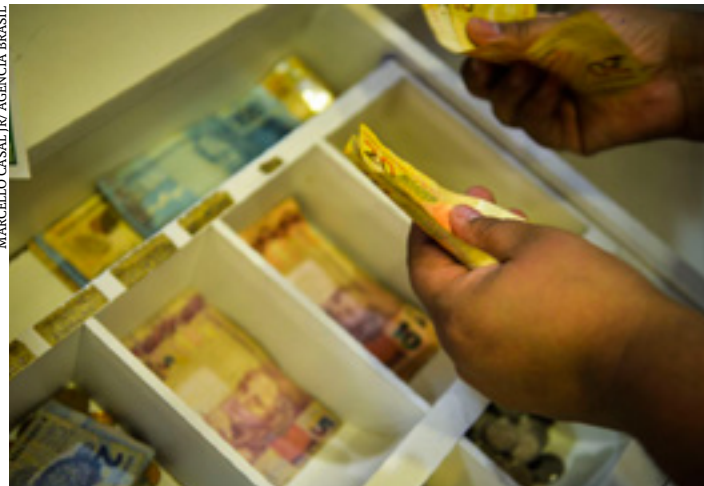
Desde o início da autorregulação, em 2020, punições chegam a 1,2 mil

Já são 1.200 as medidas administrativas aplicadas a correspondentes bancários por irregularidades na concessão do crédito consignado desde o início de vigência das regras de autorregulação, em janeiro de 2020. Segundo a Federação Brasileira de Bancos (Febraban) e a Associação Brasileira de Bancos (ABB), em março, foram aplicadas 22 sanções aplicadas, entre advertências (6),