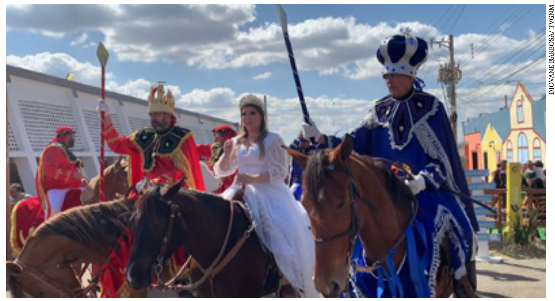
As apresentações aconteceram no parque de exposições João Alencar Athayde

Segundo registros, o evento era realizado em Montes Claros desde 1905. “A nossa ideia era retomar a apresentação nas comemorações dos 150 anos de Montes Claros, em