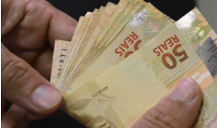
Diminuição das importações puxaria melhora no saldo

zantes caíram 55,2% em junho, na comparação com o mesmo mês do ano passado. O preço médio dos combustíveis importados diminuiu 40,4% na mesma comparação. O preço médio do trigo, outro produto que o Brasil importa em grande quantidade, cai 18,6%. (Agência Brasil)