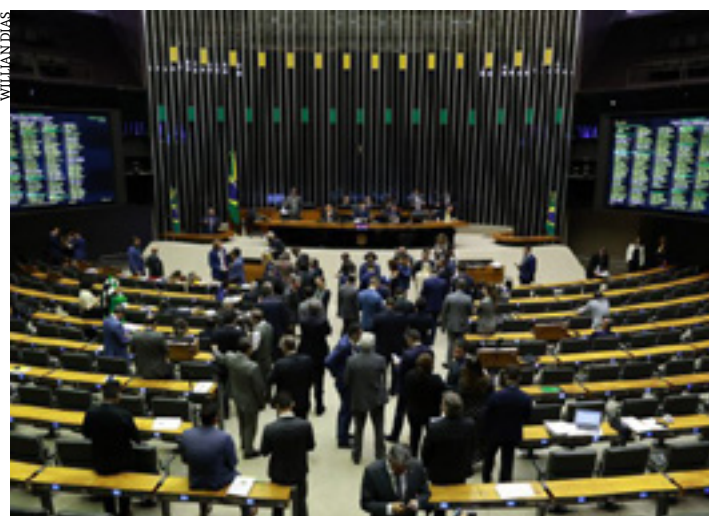
Experiência da Assembleia na discussão participativa do PPAG pode auxiliar nos debates com a União

A Comissão de Participação Popular da Assembleia Legislativa de Minas Gerais (ALMG) debate, nesta segunda-feira (3), a elaboração do Plano Plurianual (PPA) da União. O PPA é o principal instrumento de planejamento orçamentário de médio prazo do governo federal e está sendo construído, de forma participativa, em todo o País. A reunião será às 14 horas, no Auditório José Alencar.