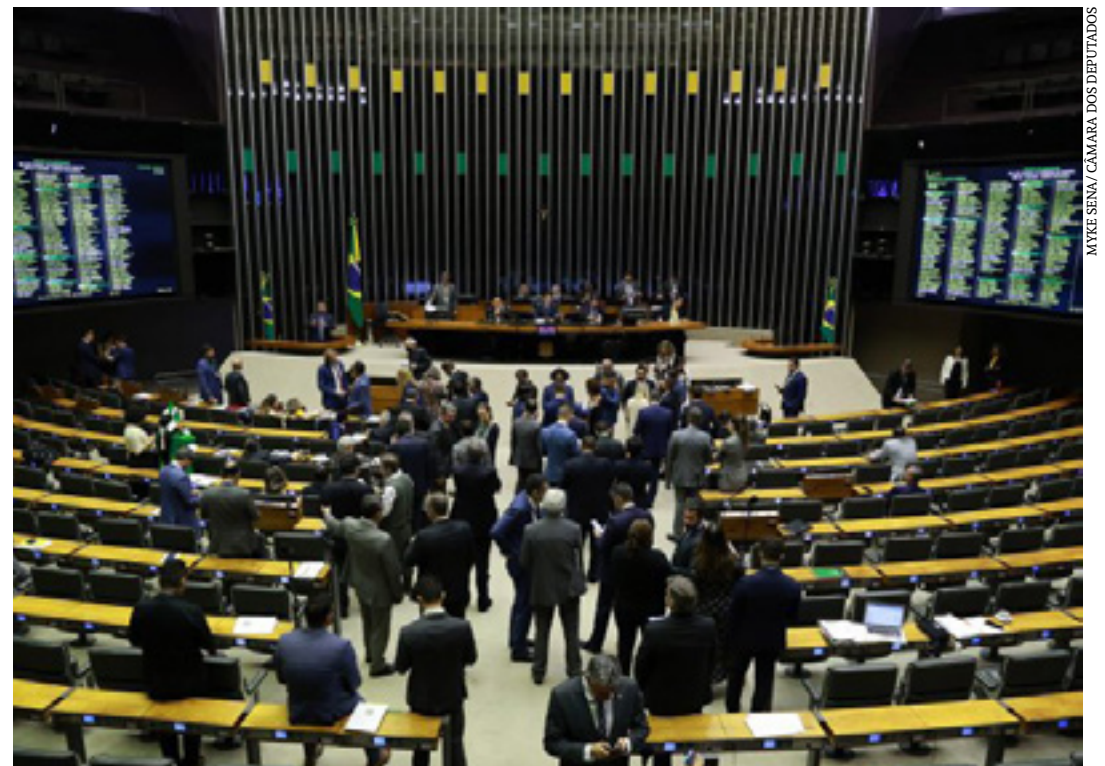
Deputados analisam propostas no Plenário

A meta é alcançar, até o ano de 2026, cerca de 3,2 milhões de matrículas. O relator do projeto é o deputado Mendonça Filho (União-PE). (Agência Câmara)