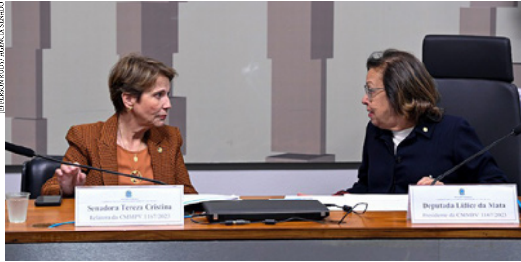
A relatora, senadora Tereza Cristina, e a presidente da comissão mista, deputada Lídice da Mata

A comissão mista que analisa a MP 1.167/2023 agendou reunião para esta terça-feira (4), às 15h, para votar o relatório da senadora Tereza Cristina (PP-MS). Depois disso, a matéria segue para votação nos Plenários da Câmara e do Senado.