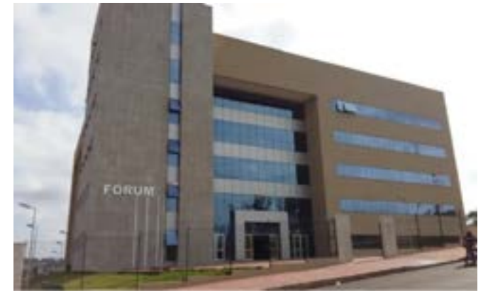
Corregedoria-Geral do TJMG apura denúncias sobre possíveis desvios funcionais registrados no fórum de Divinópolis

Principais destaques dos jornais integrantes da Rede Sindijori MG