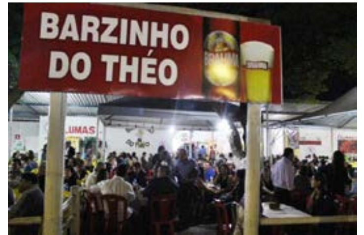
Outra fachada de entrada do famoso e inesquecível barzinho do Theo