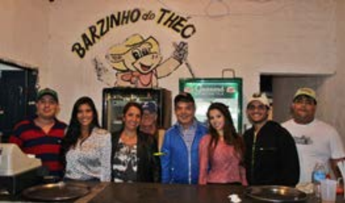
Era muito bom trabalharmos ali com os familiares