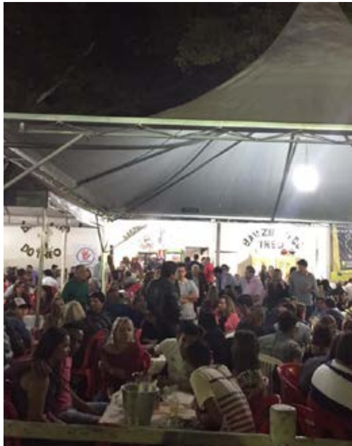
Não só o barzinho do Theo mas todos os outros naquele espaço ficam super lotados