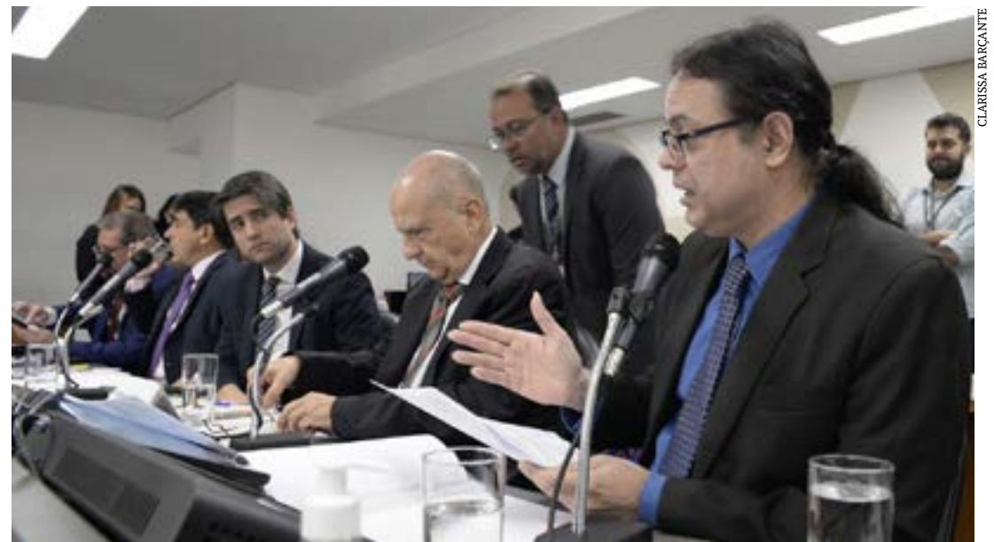
Cumprimento de prazos legais e pressões sobre pacientes preocupam deputados

“Precisamos estender essa fiscalização para analisar onde os recursos vão e se estão sendo bem utilizados”, defendeu.